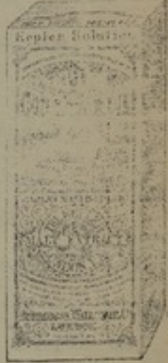
شكل مصغر جداً

محلول ، كپلار ، ذو طعم شهى كاجود انواع العسل