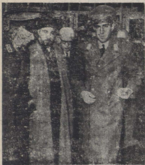
والا حضرت شاهیور طبرضا هنرمند ورود بسجده سلطانی قبل از ظهر امروز مجلس ختم مرحوم ادیب السلطنه سمیعی در مسجد سلطانی از طرف دربار شاهنشاهی منتهی گردید از ساعت نه صبح آقای هندی رئیس کل تشریفات شاهنشاهی با خان سایر روسای دربار شاهنشاهی در مسجد سلطانی حضور یافتند آقای سرانجامی معاون نخست وزیر نیز بنیابتی از طرف آقای نخست وزیر در مجلس ختم حاضر شده بودند بتدریج کلیه طبقات دانشندان روحانیون رجال اخصای فرهنگستان ایران و جسم کثیری از وجوه اهالی در مراسم ختم مرحوم سمیعی شرکت نمودند و این ضایع را با فراخ اندان سمیعی که در مسجد حضور داشتند تسلیت گفتند. مقرر ساعت ده صبح آقای فلسفی واعظ بنبر رفت و شرح جامعی در باره پایه علمی مرحوم سمیعی و خدمات وی بیان داشت و شمار زیادی از انجمن نیز قرائت نمود. ساعت یازده والا حضرت شاهیور طبرضا بسجده سلطانی وارد شدند و در همین موقع بیانات آقای فلسفی خانه یافت والا حضرت دستور برچین ختم را صادر کردند و مجلس خانه یافت.