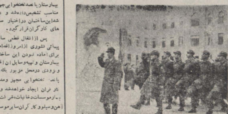
واحدهای مختلف دانشجویان دانشکده امیری از برابر تمال شاهنشاه دره میروند (جریان در صفحه پنجم ستون ورزشی چاپ شده است)