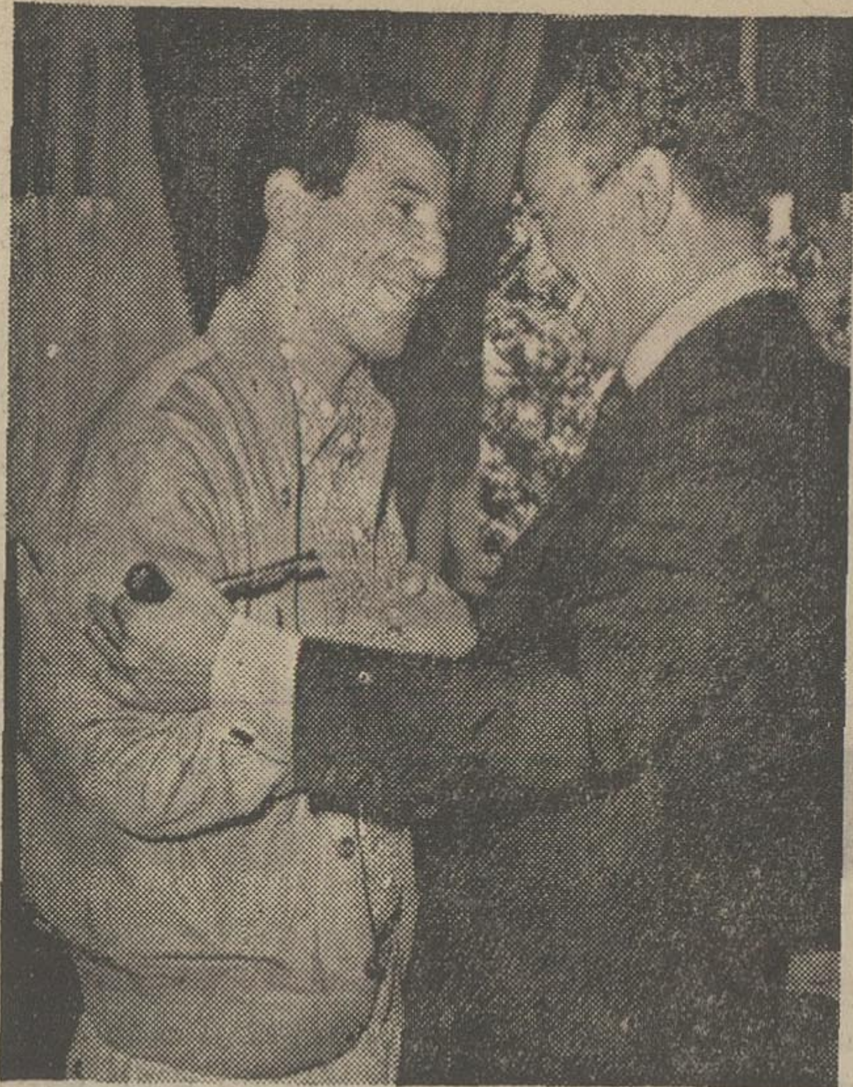
سرهنک جلود دوست سادات هنگام ملاقات اخیر با رئیس‌جمهور مصر در قاهره نشان میدهد.