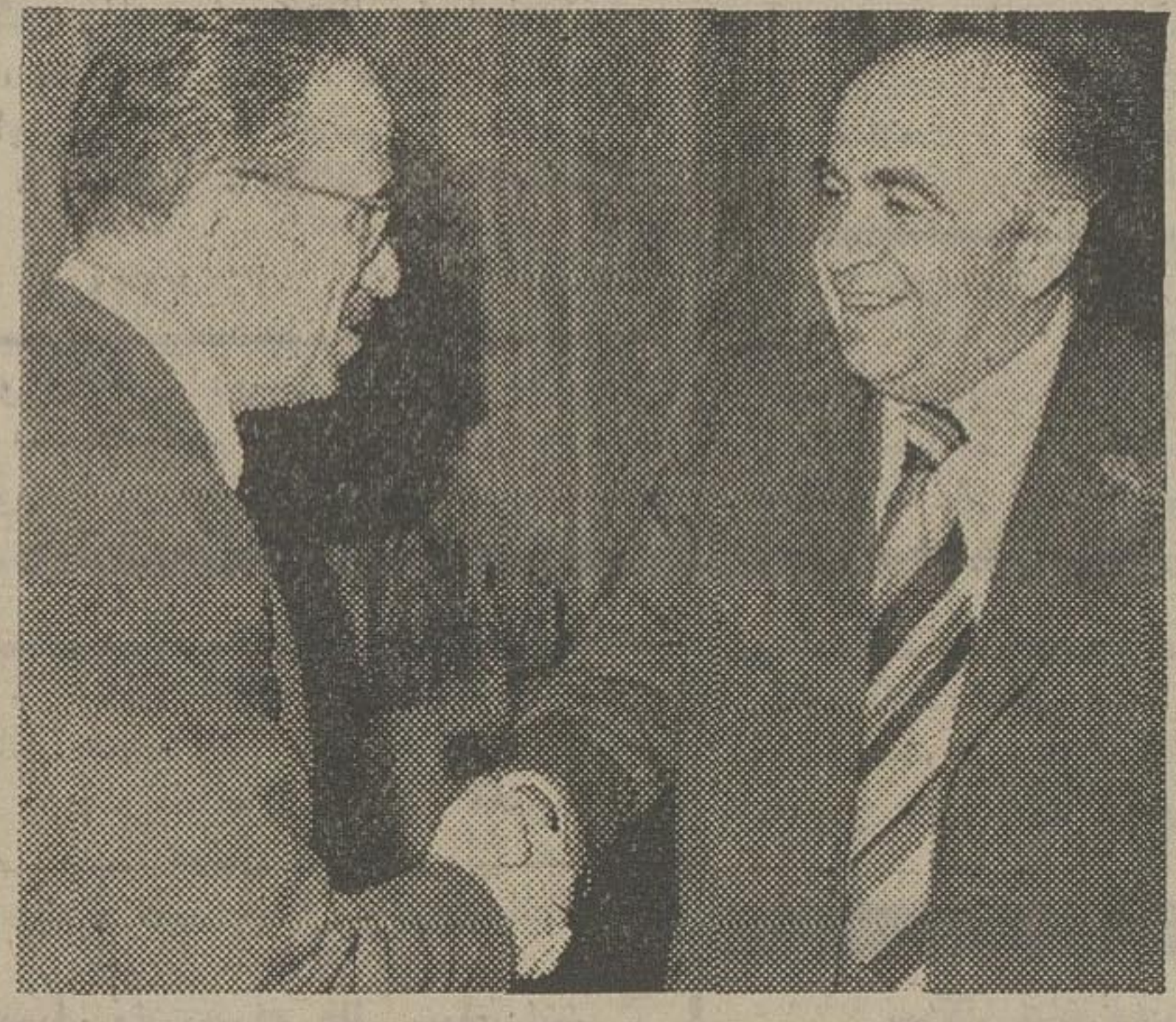
توران گونش وزیر خارجه ترکیه که بدنبال شرکت در اجلاس شورای وزیران سازمان همکاریهای عربی منطقه‌ای سرگرم دیداری خصوصی از ایران و گفتگو با مقامات تهران است دیروز با امیر عباس هویدا نخست‌وزیر در کاخ نخست‌وزیری ملاقات کرد .

شرقیایی وزیران خارجه ایران و ترکیه بعد از مذاکراتی که یک ساعت بطول انجامید ، صرفنظر از این مذاکرات ، همسر وزیر خارجه ترکیه که قبلا به حضور شهبانو رسیده بود نیز همگام با وزیر خارجه حضور داشت . گونش که برای نخستین بار در مقام وزیر خارجه آن ایران دیدن میکند سرگرم مذاکراتی با مقامات تهران است که ناظران سیاسی برای آن اهمیت قائل اند . مذاکرات او در حقیقت نخستین تماس در سطح عالی میان تهران و آنکارا بدنبال