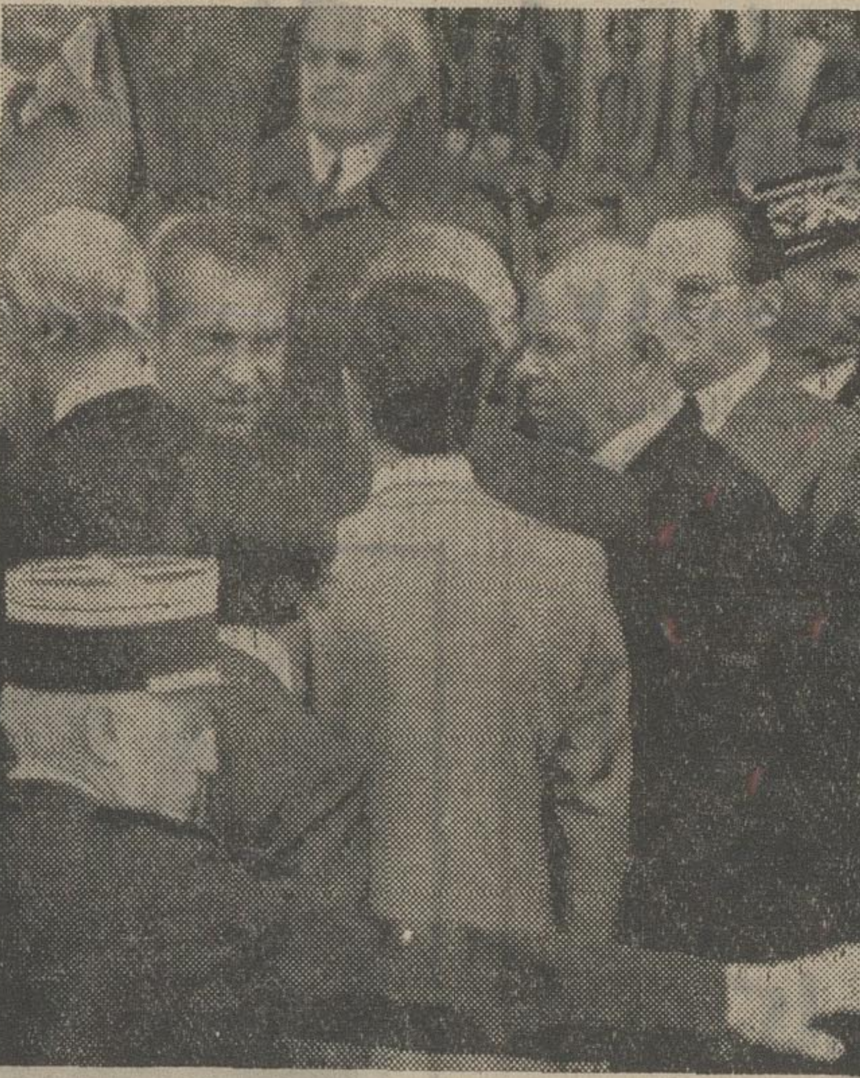
نیکسون با یادگورنی و سران اروپا مذاکره کرد

لئونه رئیس جمهور ایتالیا پول هارتلیک نخست وزیر دانمارک گفت که هرزه کشوری و تاناکا نخست وزیر ژاپن در مذاکرات مشترک اروپا عضویت دارند . نیکسون صبح امروز با نیکای یادگورنی صدر هیئت رئیسه سورایبعالی اتحاد شوروی و تاناکا نخست وزیر ژاپن نیز ملاقات کرد . در ملاقات با یادگورنی نیکسون صبح امروز با نیکای یادگورنی صدر هیئت رئیسه سورایبعالی اتحاد شوروی و تاناکا نخست وزیر ژاپن نیز ملاقات کرد . در ملاقات با یادگورنی نیکسون صبح امروز با نیکای یادگورنی صدر هیئت رئیسه سورایبعالی اتحاد شوروی و تاناکا نخست وزیر ژاپن نیز ملاقات کرد .