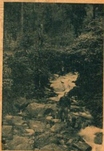
在泗水日山園，寺後園，立石橋上，聽泉聲，如出，悠然自得。 天下無難事，只要肯去做。