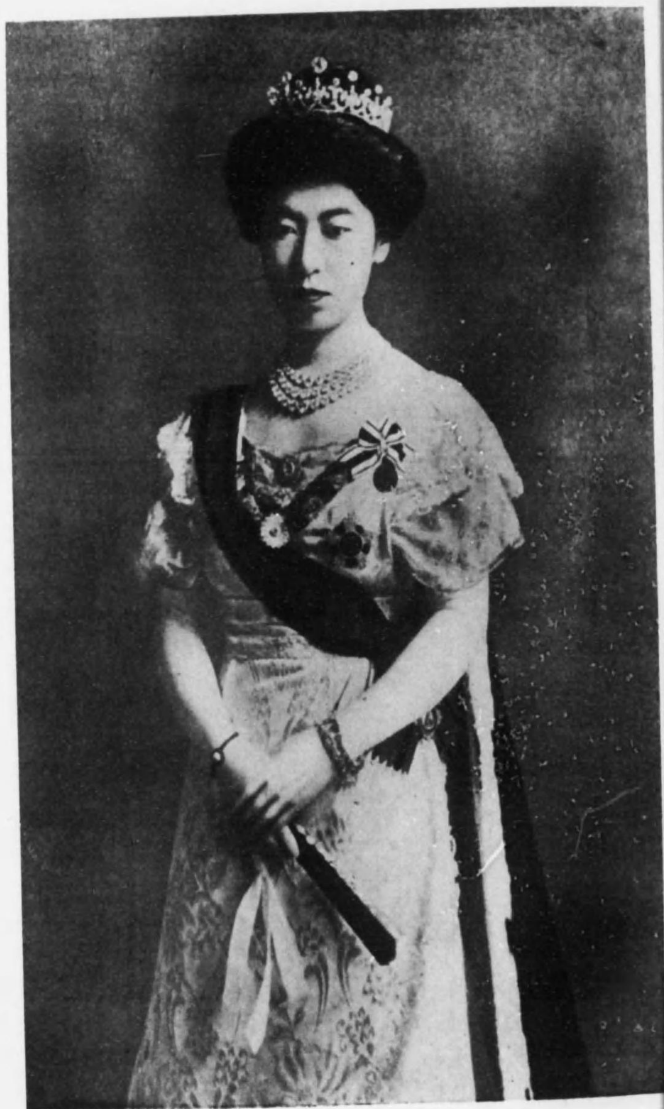
下 陞 后 太 皇