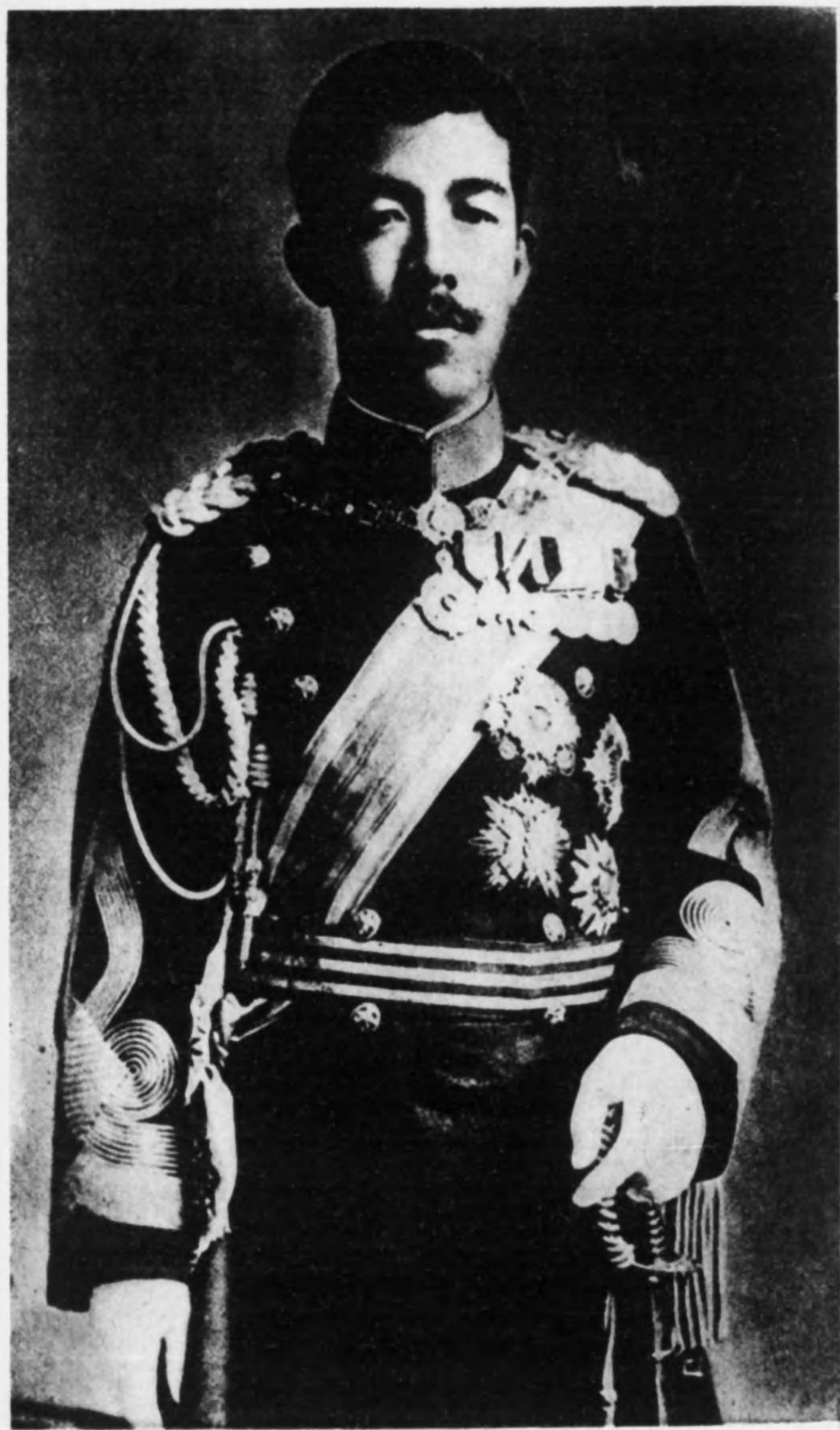
大 正 天 皇