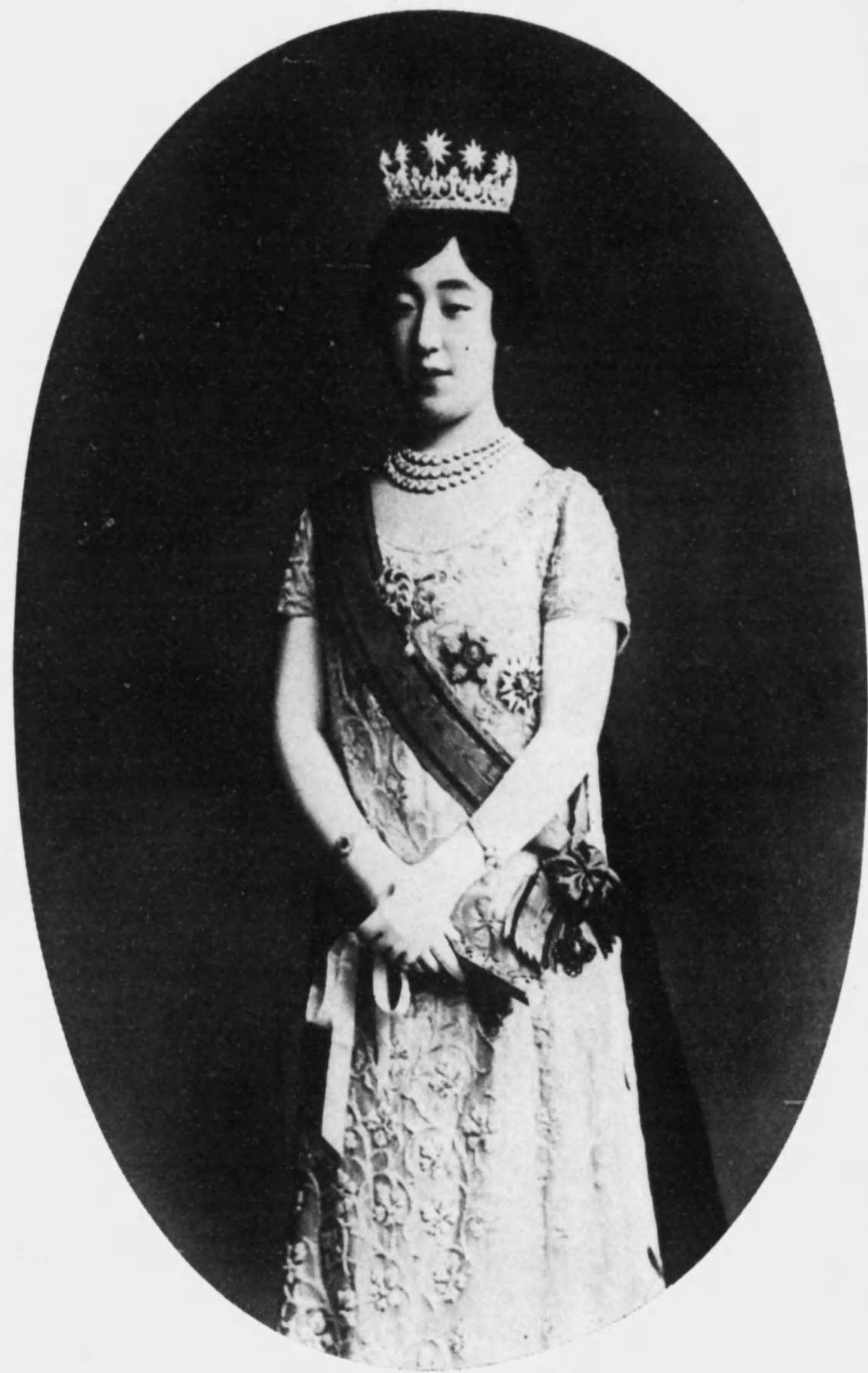
下 陞 后 皇