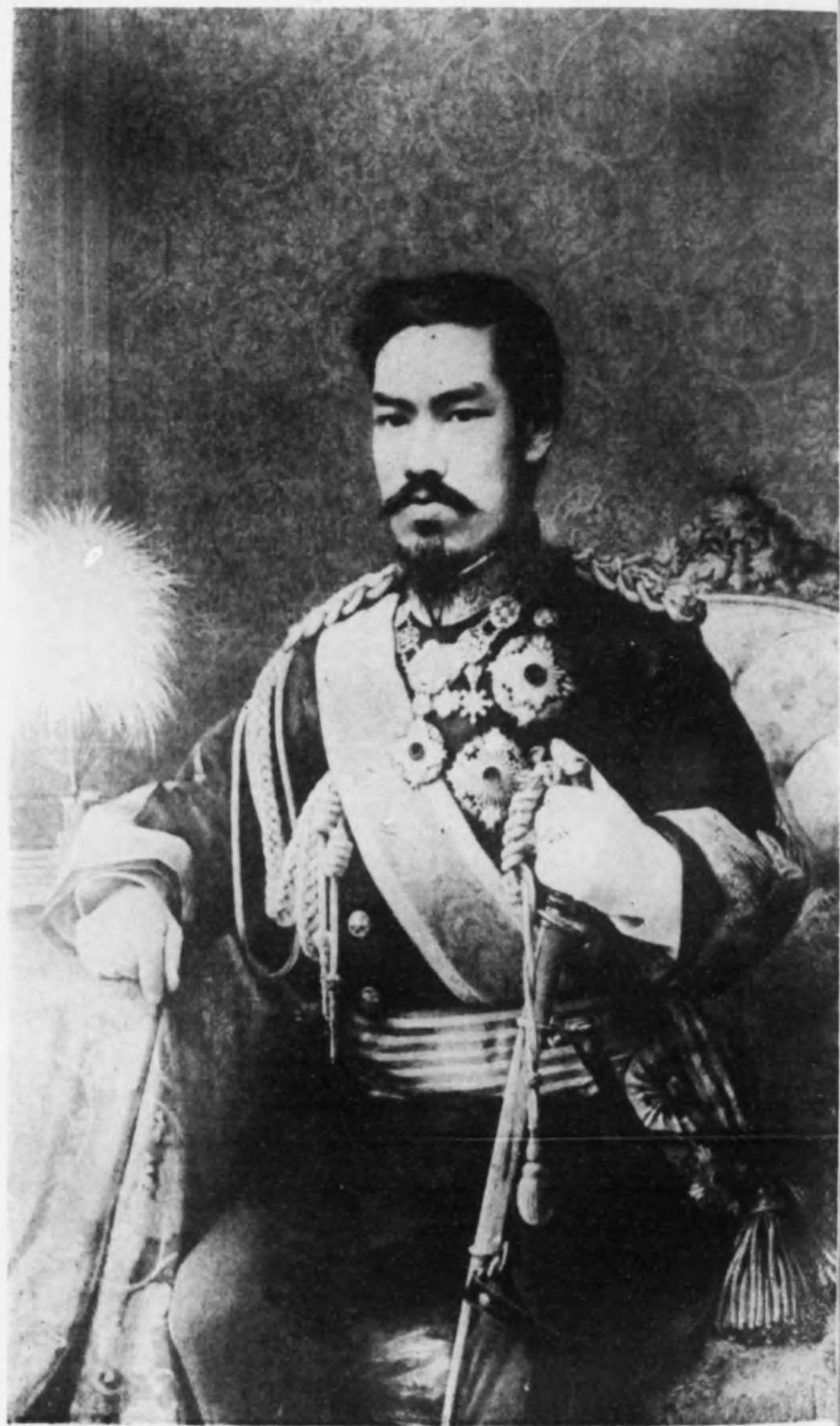
明 治 天 皇