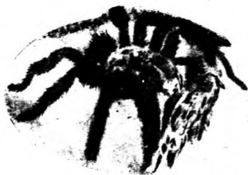
△ 毒極性其，蛛大，有，中林森洲美南 健蟻，二萬毒八腿毛有，食為以， 。蛛蜘蛛毛為之呼人土，力多

不是一切的蜘蛛都織網。例如那種所謂「跳躍蜘蛛」，雖然拉絲，卻不會用來作陷阱。牠們隱伏在同牠們自身顏色一樣的樹枝或樹葉上，等著牠們的俘虜物。有的蜘蛛則用絲織成一個陷阱，牠自己則深藏在裏頭；洞口的外面