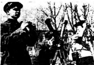
○蘇聯觀兵砲擊蘇之線戰蘭克烏守防

很明顯的，這是必須仰賴於外交供給的國家。自去年四月佔領丹麥，挪威，五月佔領荷蘭，比利時，以及相繼佔領法國以來，這些國家的食糧供給，也由德國來擔負。當然，這些國家，並不是完全不能自給的國家，然由於捲入戰禍之後，人心不安，生產減少，乃係當然之理。所以德國只有取諸於農產豐富之巴爾幹半島，來消滅其支配國內食糧不足之恐慌。然而巴爾幹的面積，本極狹小，如於短期間結束戰事，巴爾幹之供給，尙不至發生大問題，如戰事一旦延長，其困難，誠無待於說明。 然擺在目前的事實，美國參戰之機運，日益成熟，此於全盤局面，是一個大變化。因美國參戰時，戰爭絕不能短期結束，如欲使美國屈服，極德國之武力，必須達到美洲，而此事絕非急切所能辦到者。因此，德國爲謀求長期之食糧策，必須着手於有「歐洲穀倉」之稱的南俄羅斯之烏克蘭。 烏克蘭，面積二十六萬方哩，人口三千四百萬，以小麥之生產地而著名。於第一次大戰，一九一七年，德國曾爲了食糧問題，在烏克蘭以武力樹立政府，此時送至奧地利亞及德國的穀物，解救了柏林和維也納的危機。二百年來，烏克蘭是德人移植之地。近年由蘇聯之迫害，已逐漸減少，然而與俄羅斯人之混血者，尙有相當的潛勢力。 烏克蘭除掉穀物以外，其他出產於蘇聯治下，亦大見發達。農產物中，尙有棉、砂礫、麻等，牧畜亦特別發達。礦物資源，煤——年產六千九百萬噸，（約當蘇聯全產額之十分之四、六），鐵礦——年產二千七百萬噸，（即蘇聯全產額之十分之五、九）如此地帶落於德人之手，則東方之巴庫石油（年產二千萬噸）與伊期之石油（年產一千萬噸），均易置於德國勢力之下。 由上所述，從來之德蘇關係，以及國境間軍隊對峙之狀態等，已知德蘇戰事，遲早間必然爆發。復加以美國參戰之迫切，更促成德國佔領烏克蘭之決意。至開戰後之戰局，現在所看到的，只是局部的，然大局之決定，因雙方皆有準備，爲期則尙遠。