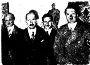
◊ 保加利亞國王亞利加親王至柏林會見希特勒

德蘇兩國間的問題，有着必歸於巴爾幹半島上之運命。從歷史上來看，此半島，向為德俄兩國勢力競爭之焦點。由俄國說，土耳其以前之首都君士坦丁堡（今之伊斯坦布爾）為俄羅斯國教大本營，此事為一般俄人，所難忘者，而且其旁之博斯波魯斯，達達尼爾兩海峽，為俄國之農產物及其他生產品向西歐輸送之出口，因而也可以說是生命線。復加以巴爾幹半島之住民，與俄羅斯人為同一之斯拉夫民族。