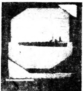
探測器之目鏡所見之目標。圖中顯示探測器之目鏡所見之目標，其目標為一艘船隻，且其目標之位置可經由探測器之目鏡直接觀察到。