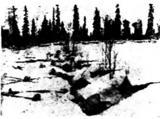
◊ 軍地雪蘭芬之軍聯蘇擊抵力奮