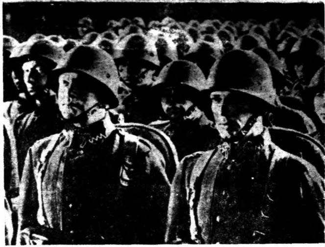
◊ 堪稱世界第一流之波蘭陸軍。