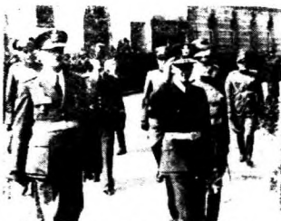
◊ 南斯拉夫大起反德之變革之維蘇維克將軍及王國後得第二

在政治上，經濟上，都是使之能向印度，東亞方面發展之良策。所以蘇聯之前進與德國之前進，無論如何，在巴爾幹半島上，是極易於惹起衝突的。尤其是羅馬尼亞之六百萬噸（三