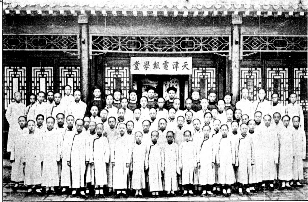
天 津 電 報 學 堂