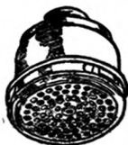
吸 濾 罐 四 圖