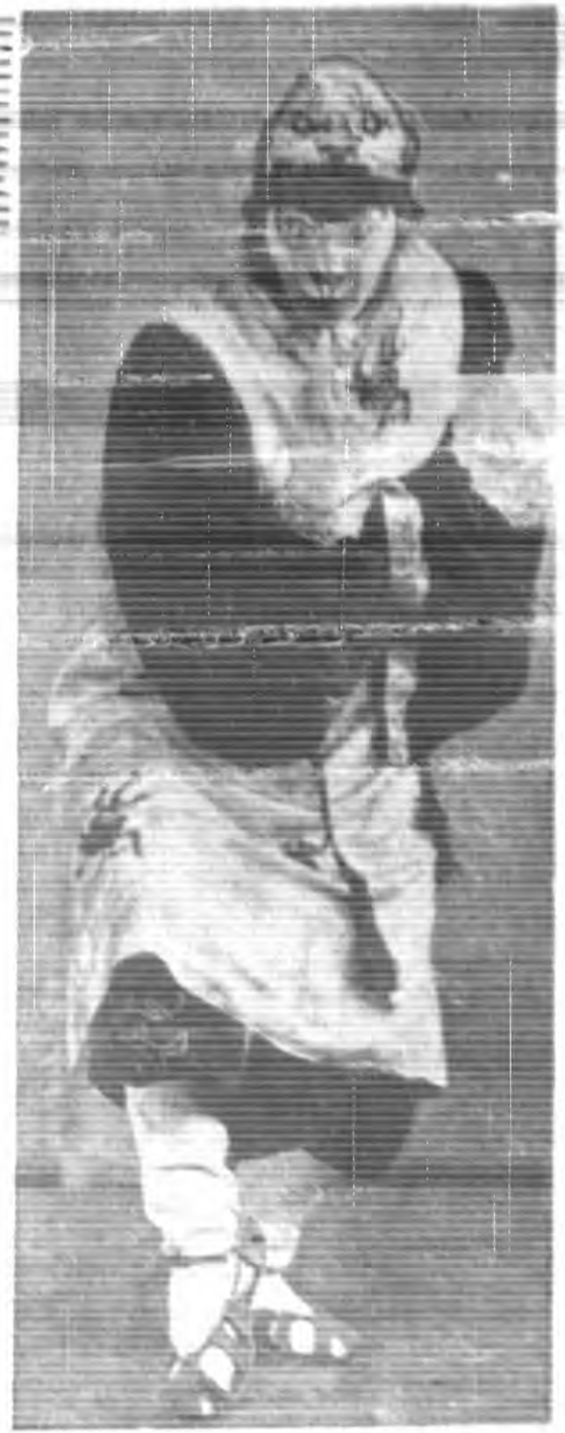
西遊記中之二個主人翁