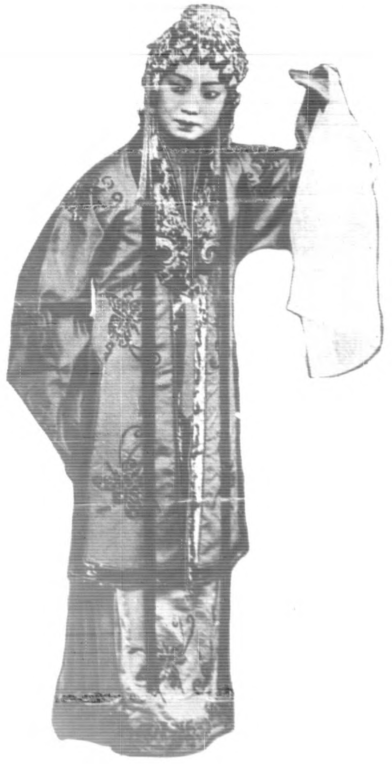
◆ 照劇集選鳳琴文張旦坤 ◆