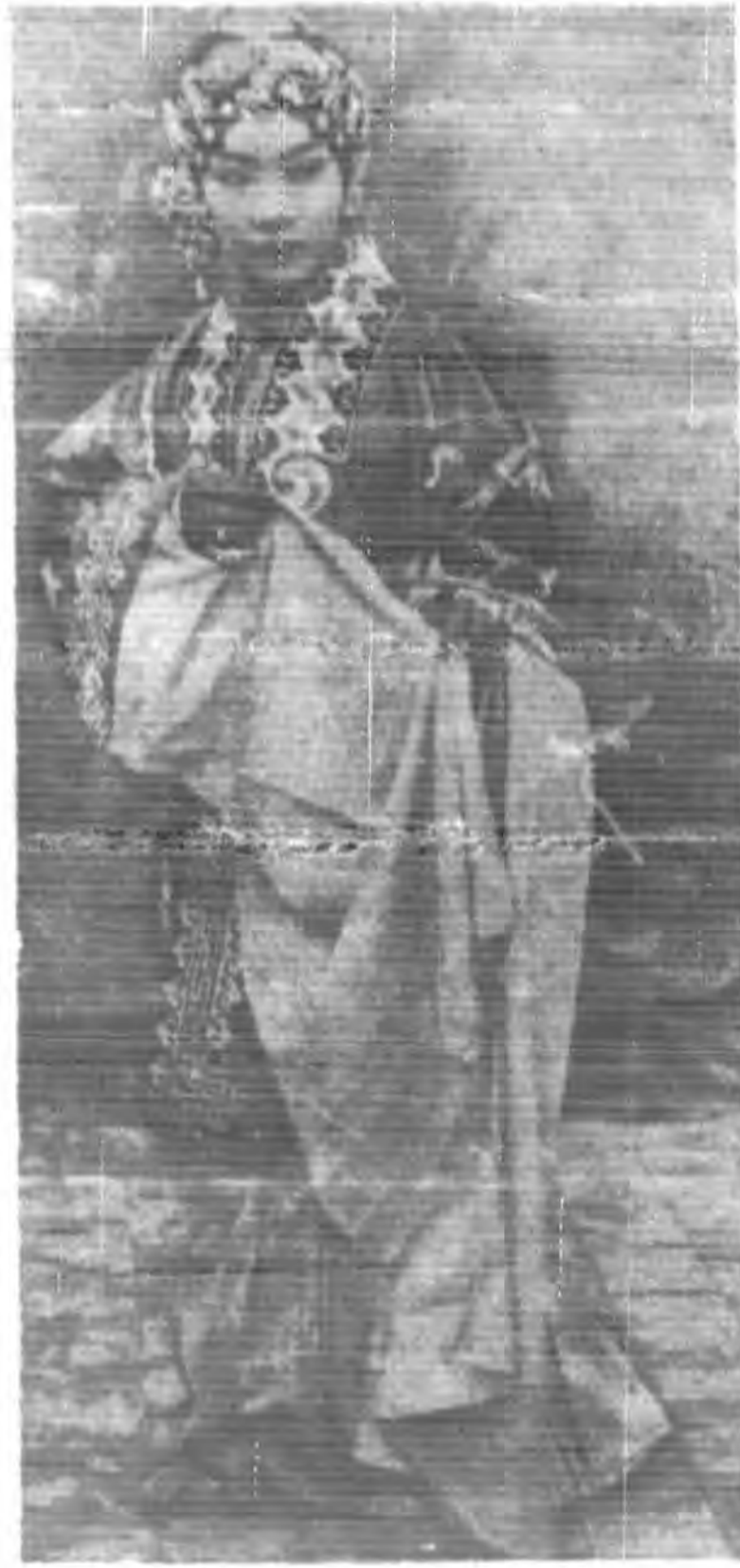
左素秋 之寶蓮 燈(左) 御碑亭 (下)