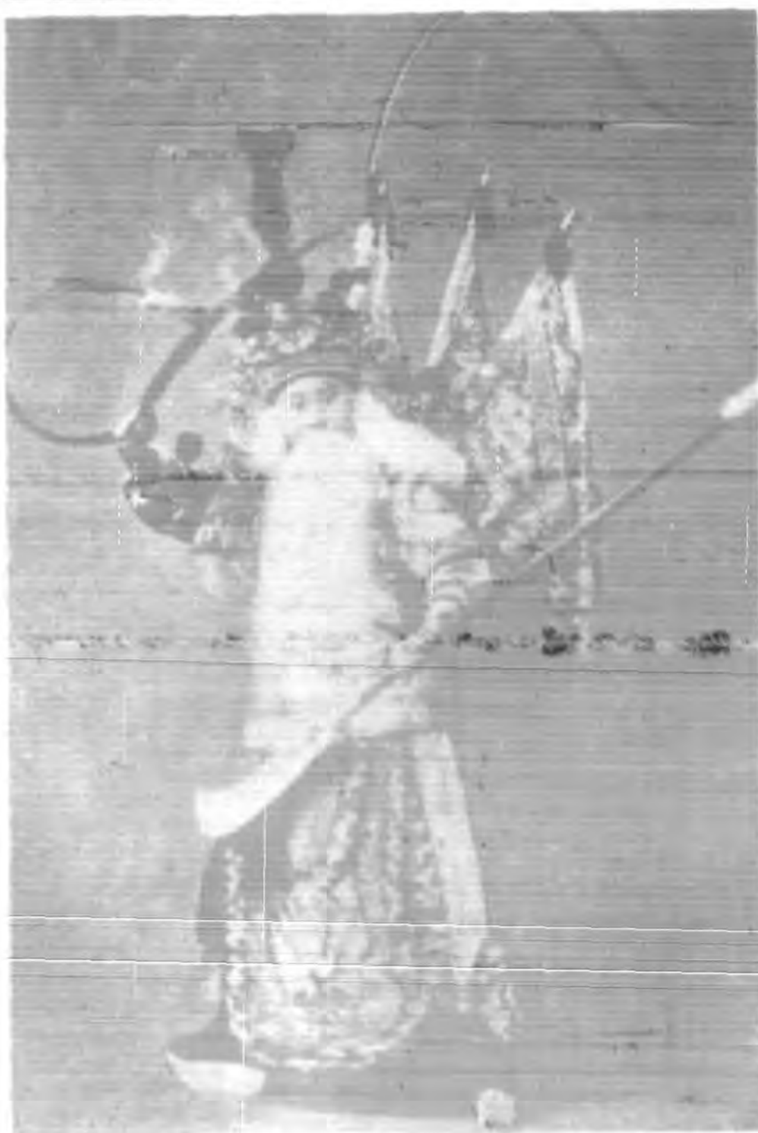
郝文蔚之珠簾寨劇照