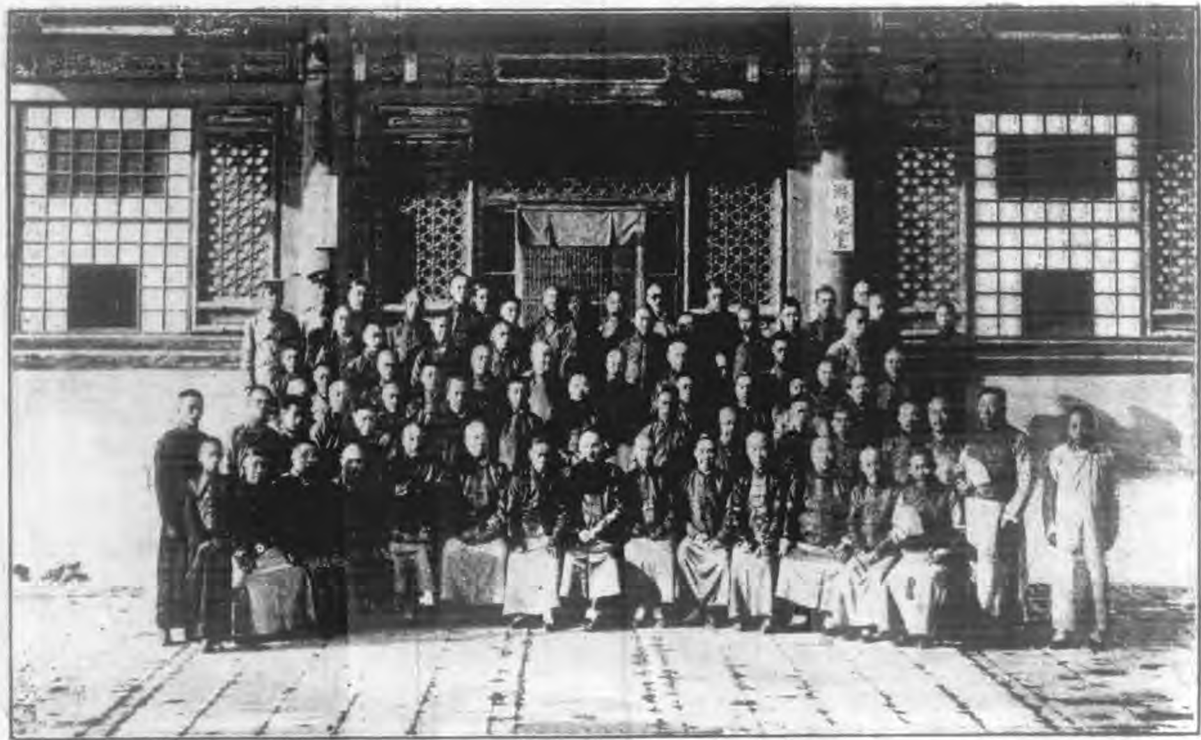
北京教育會道德教育研究部成立大會之攝影