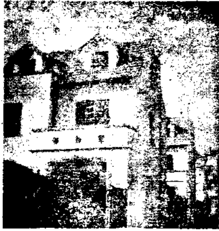
本公司新益一邨外景

該邨位於福履理路台拉斯脫路最近落成地點通中二十二路公共汽車可以直達四週均為高等住宅環境優美不潔塵囂 各宅均為假三層雙開間式底層客廳書房均合理想二樓臥室二間分配均勻三樓因東南臨空光線亦極充足可以遠眺高牆亦可用作正屋 各宅間維持寬闊地位陽光充沛空氣流通屋宇高爽佈置雅潔為標準之新穎住宅