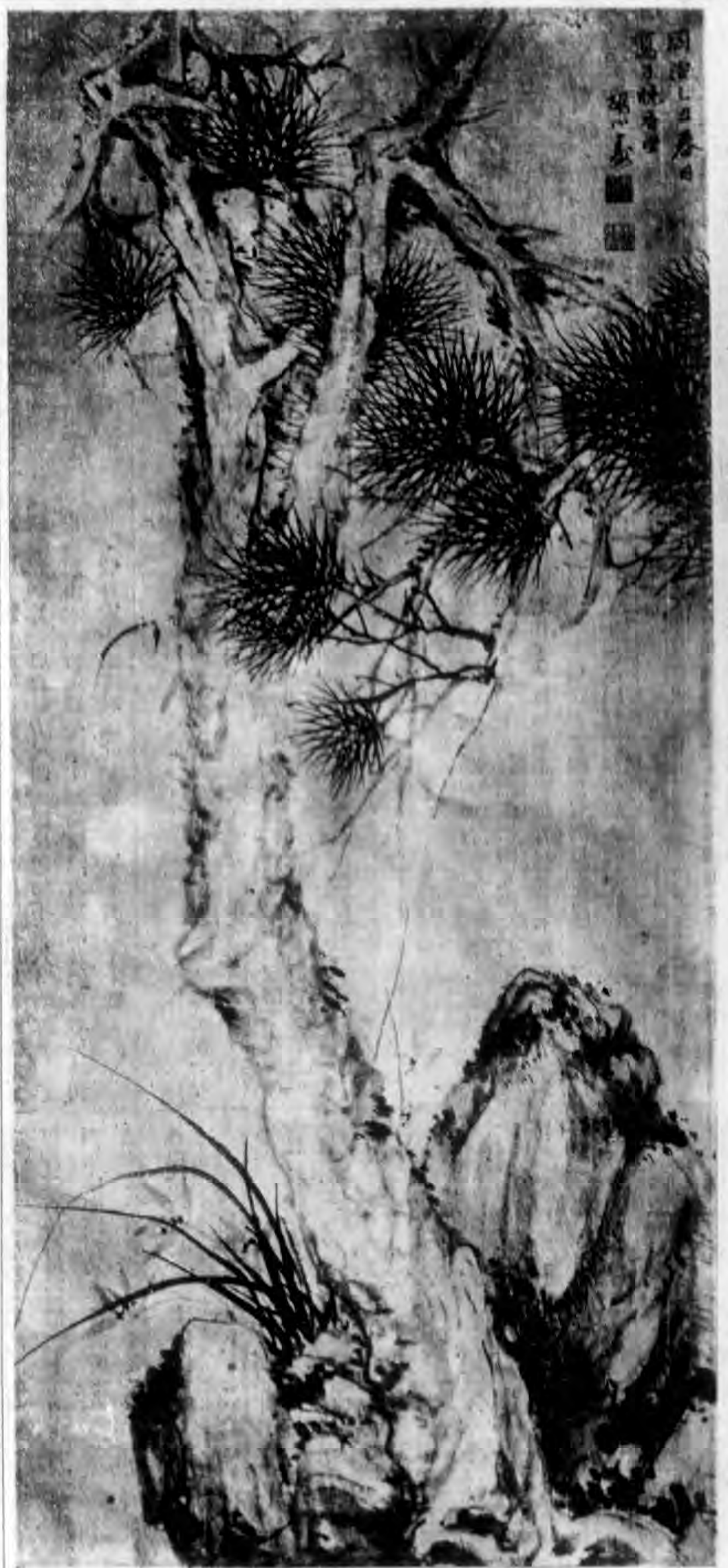
胡遠。字公壽。華亭人。於畫無不能。且善以書法入畫。遒勁挺拔。自有家法。與別家為能者。自不可同日而語。寫松尤為胡氏特長。當時罕有儔匹。觀乎此幅。即知余言之不謬焉。(溫旬誠)