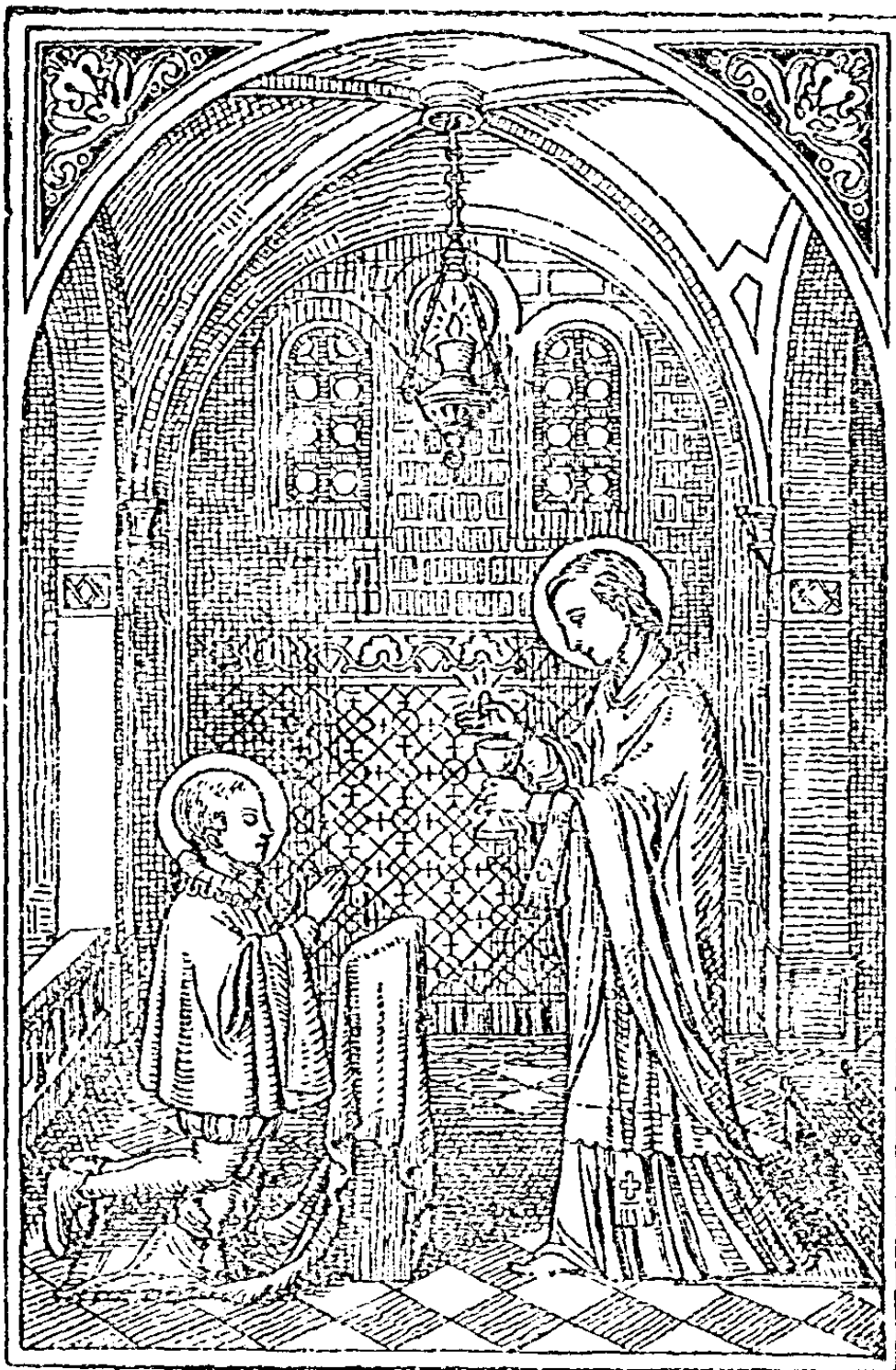
體聖領次初思類聖