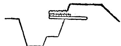
以鎗眼式掩堡為最良