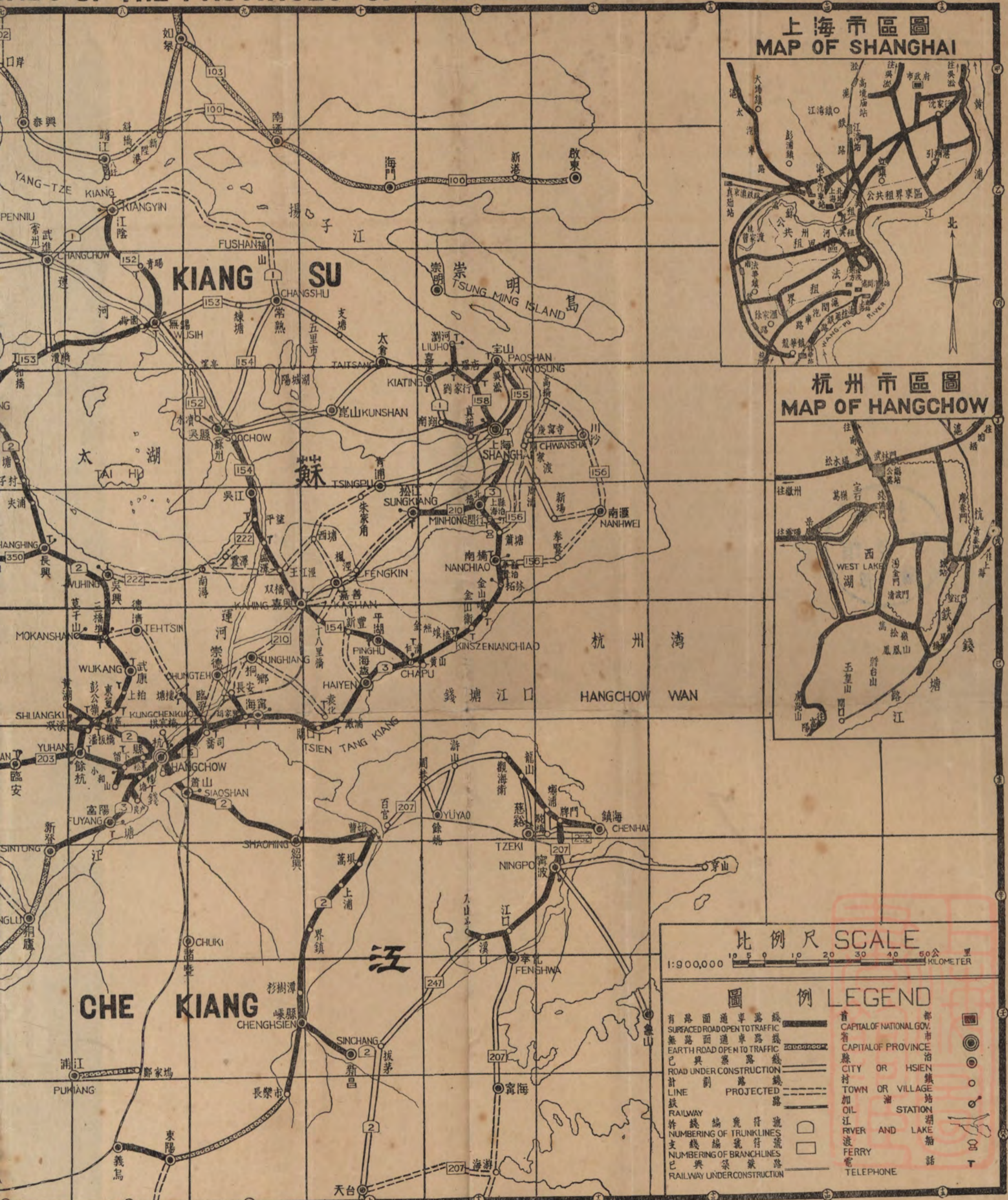
上海市區圖 MAP OF SHANGHAI