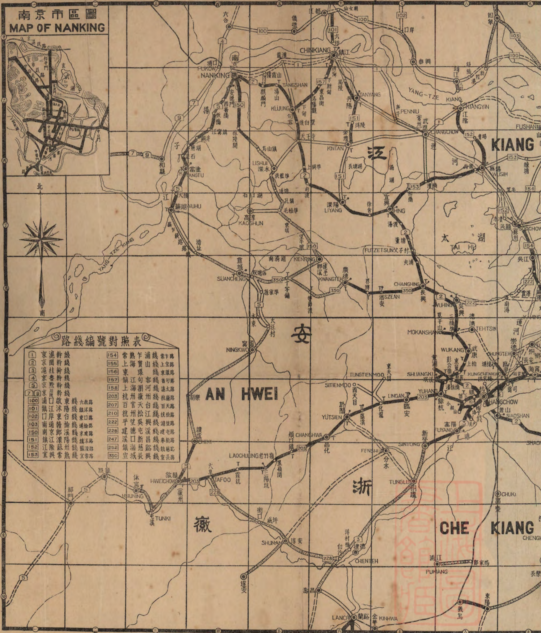
南京市區圖 MAP OF NANKING