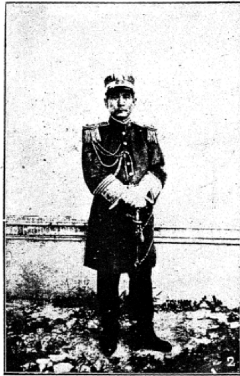
孫中山時大總統之影