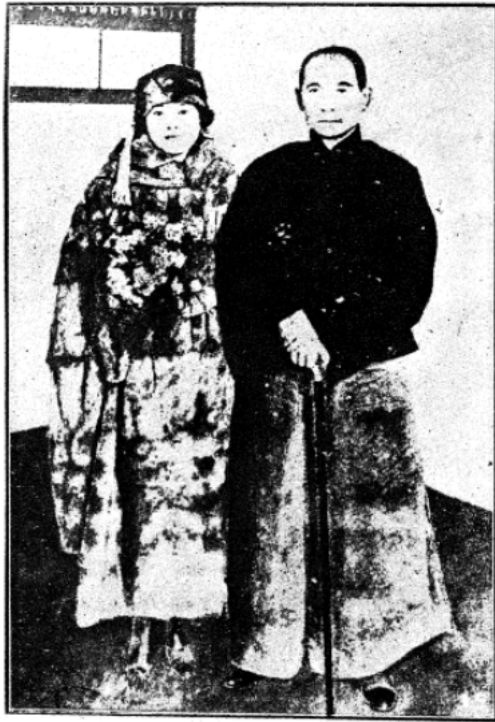
孫中山先生與夫人宋慶齡合影之像