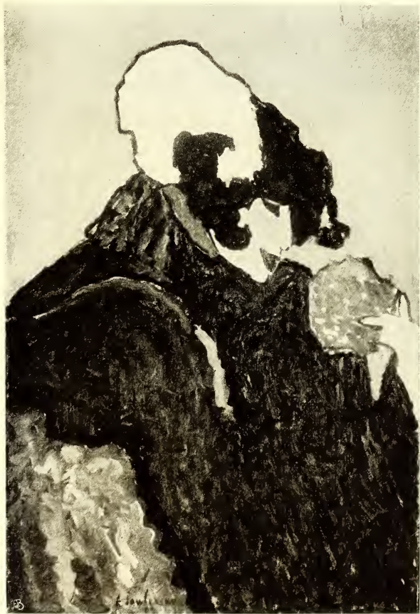
Alexej von Jawlensky