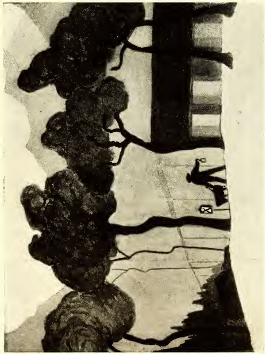
Marianna von Werefkin