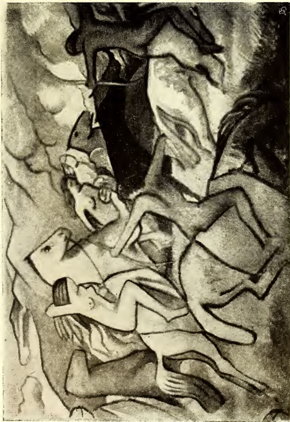
Wladimir von Bechtejeff