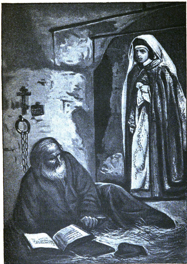
Боярыня Морозова посѣщаетъ въ заключеніи Аввакума.