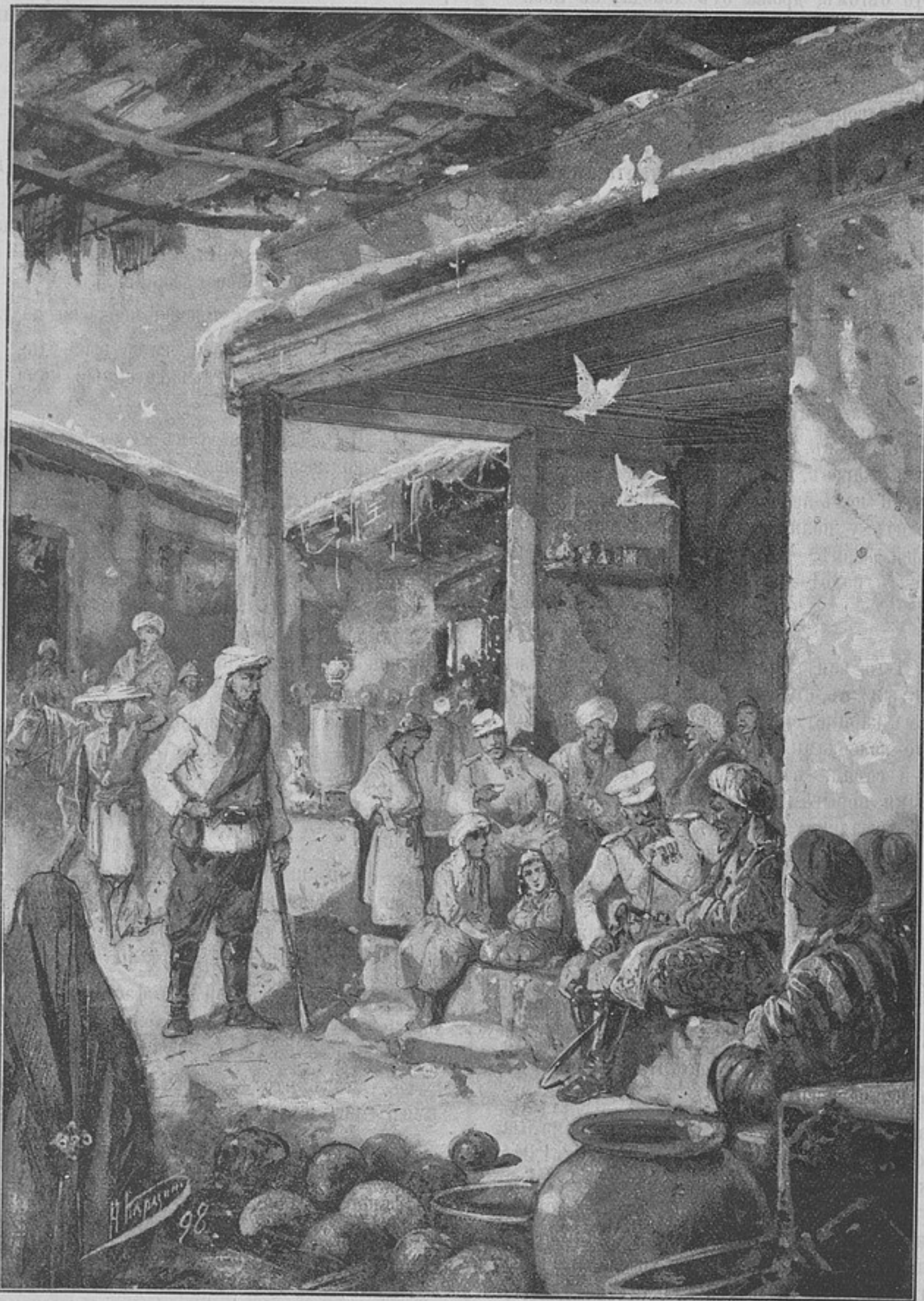
Побѣдители и побѣжденные въ Средней Азіи (къ рецензіи «Двѣ волны»).

— Да откуда ты взялъ... — началъ было оправясь отъ удивленія батюшка.