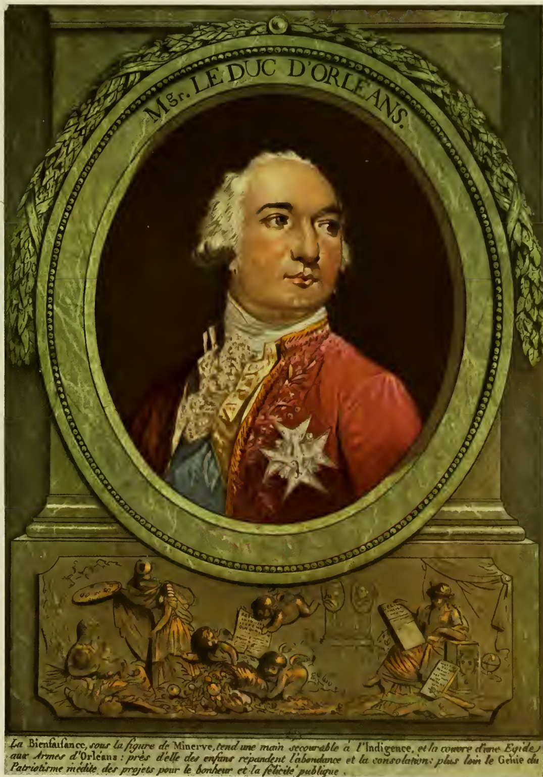
La Bienfaisance, sous la figure de Minerve, tend une main secourable à l'Indigence, et la couronne d'une Egeus aux Armes d'Orléans : près d'elle des enfans repandent l'abondance et la consolation : plus loin le Génie du Patriotisme médite des projets pour le bonheur et la félicité publique.