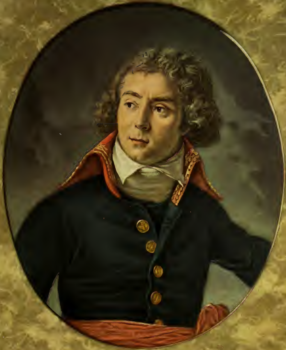
LE GENERAL BERTHIER