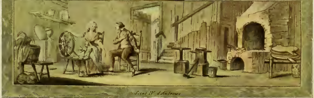
Scene IV d'Ambrasse