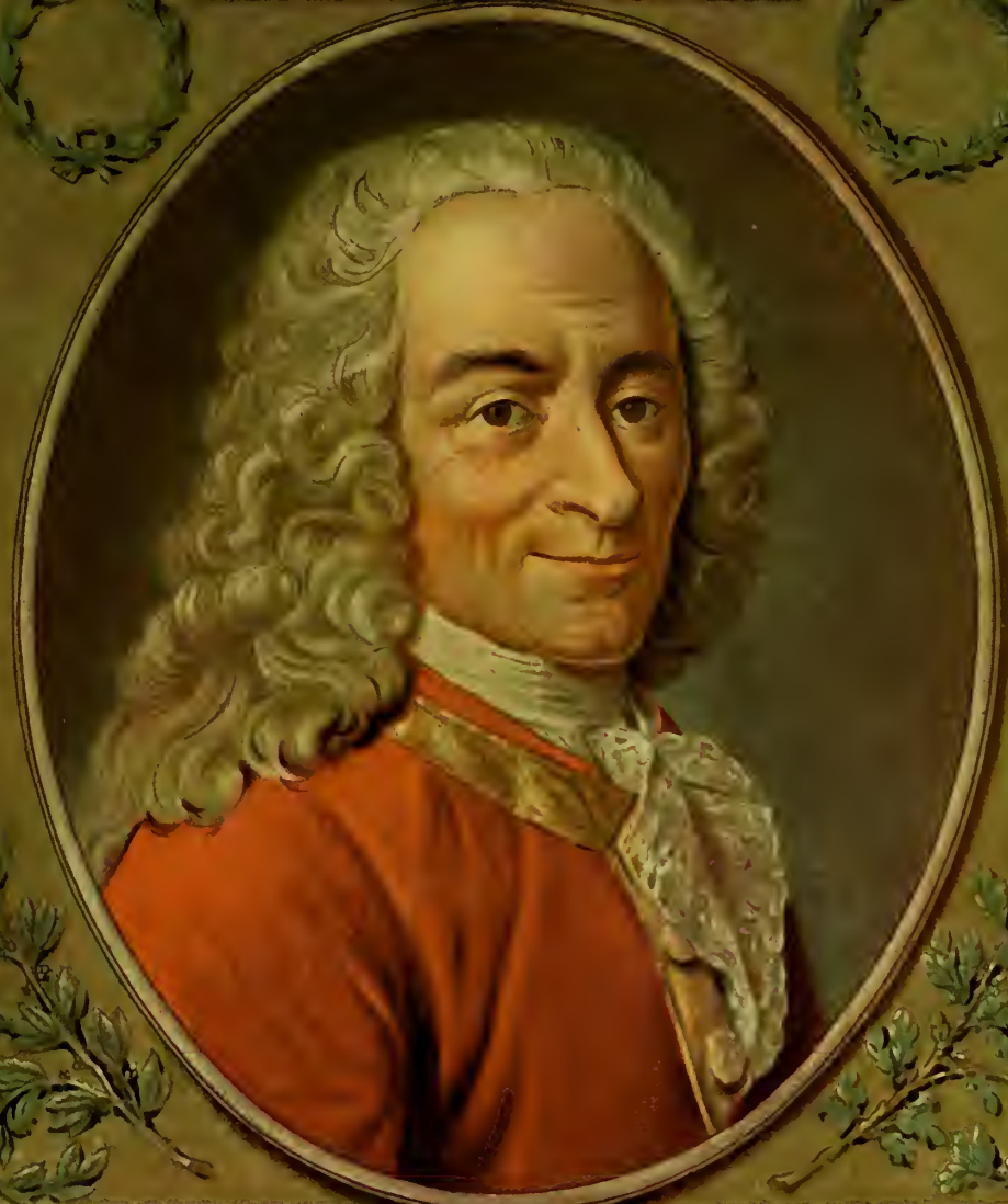
F. M. AROUET DE VOLTAIRE.