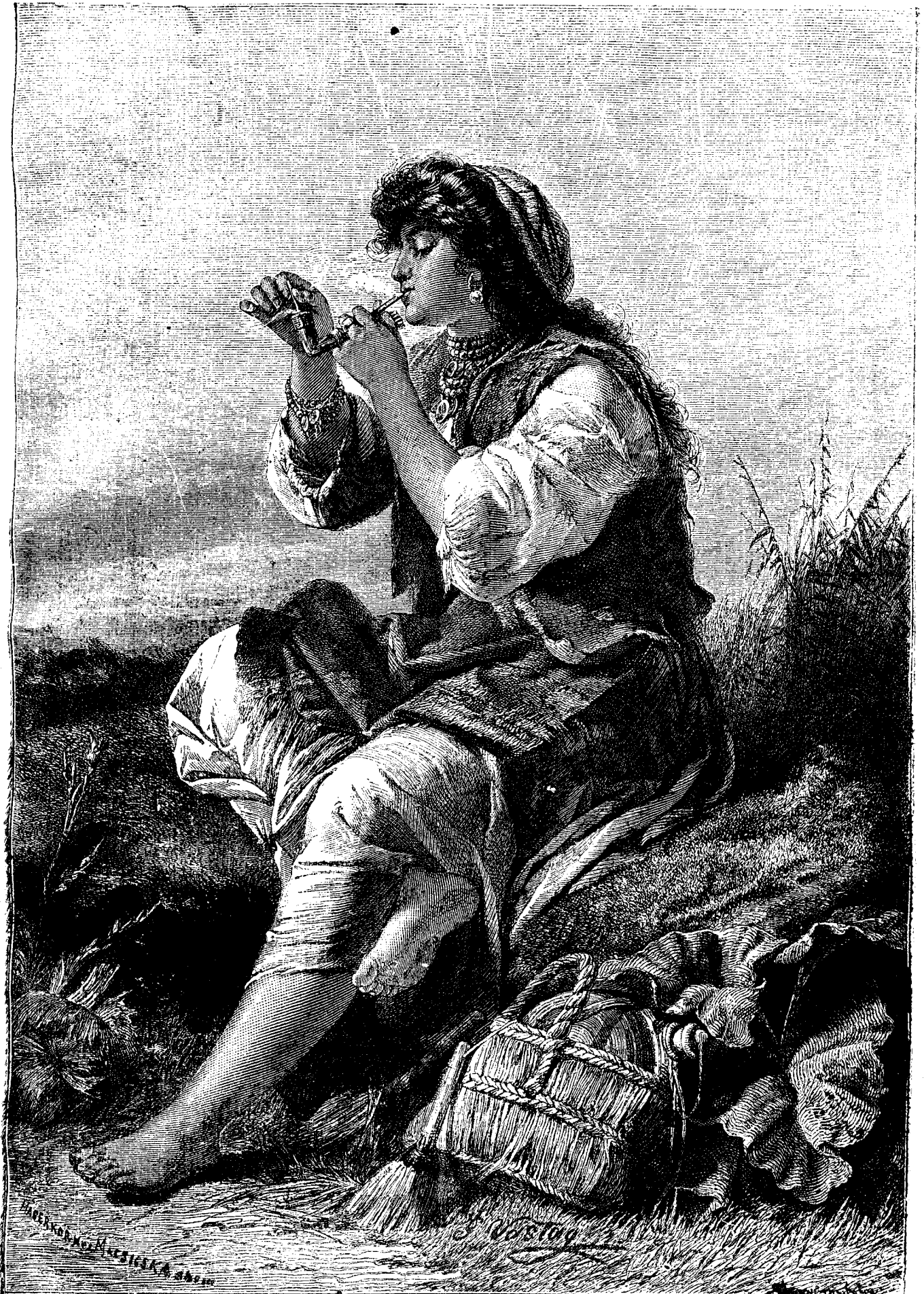
T i g a n c a .