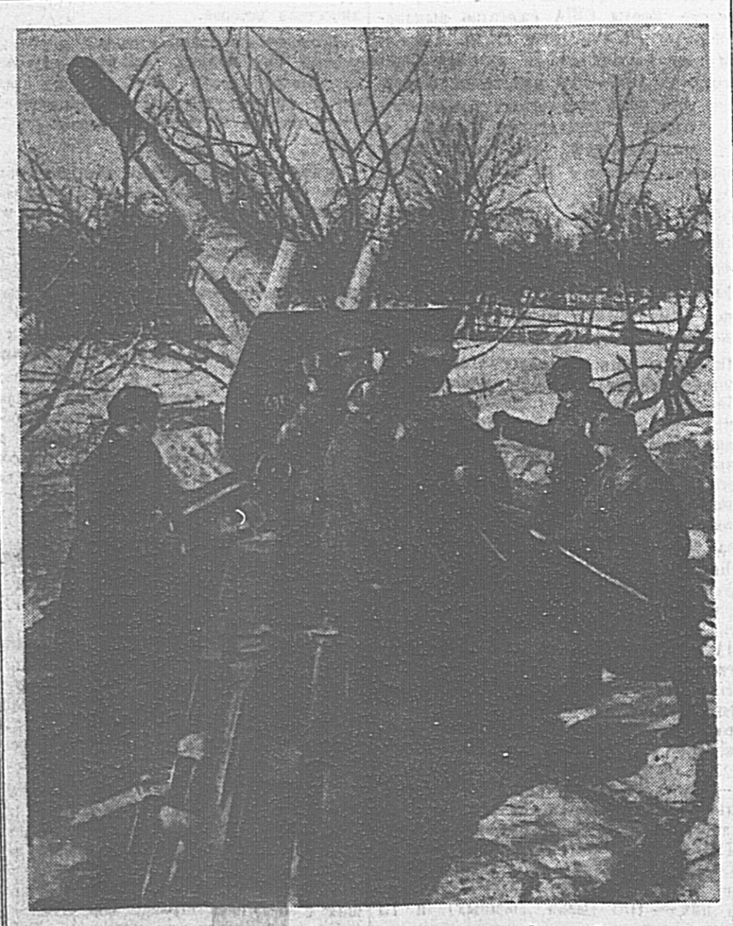
2. Только установленные новые орудия и с прежней настойчивостью ищет артиллеристы грозные «стенники» врагу. Тонны смертоносной стали обрушиваются они на головы немецких захватчиков, погнавших нашу землю.

Сказкины, откомандированные бригадой мастера Бардочина на один из промыслов в леса «Станшетьна» в Валу, дают нефти в 15 раз больше, чем давали до ремонта,