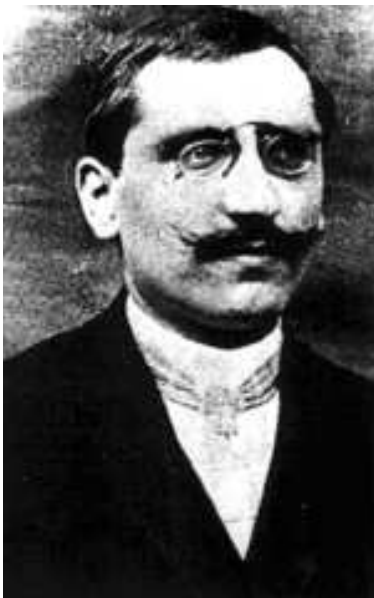
Henri Léon Lebesgue (1875-1941)

Wir haben jetzt alle Hilfsmittel zusammen, um auf den Borel-Mengen des \mathbb{R}^n ein Maß zu definieren, das für einen Quader, dessen Seiten reelle Intervalle sind, einfach das Produkt der Seitenlängen ist. Dieses Maß heißt Borel-Lebesgue-Maß . Wir beginnen mit der eindimensionalen Situation.