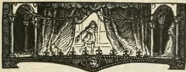
TABLE DES SCÈNES