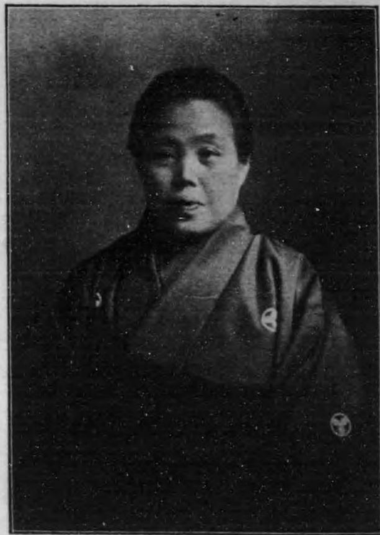
( 著 者 )