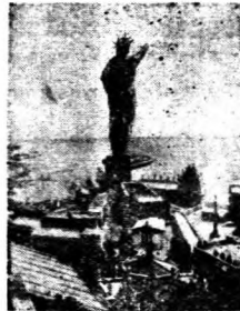
↑希臘、比沙拉比亞、布克維納之領土變更、獨軍の進駐羅馬尼亞等の種種の異變、那一件都是等於向バルカンの噴火口に再投入炸藥那樣嚴重的事件、但是戰局在表面上是德英間靜肅的繼續對戰、而バルカン在和平裏已經經過了這種異變。

開戦以來、バルカンにおいてはベツサラビア、プロヴィナの領土變更、ドルーチヤ、トランスシルヴァニアの失地回復、獨軍のルーマニア進駐等々、さまざまの異變があり、その一つでもバルカンの噴火口にさらにダイナマイトを投げ入れたほどの大事件であるが、戦局は表面靜かに獨英の對戦をつづけて、バルカンは平和裏にこの異變を経過してしまつた。