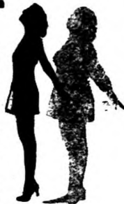
健康就像生命中怒放的花朵， 牠本身就代表一種至大無極的快樂。