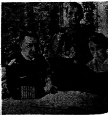
↓ 德大將與其妻及子。