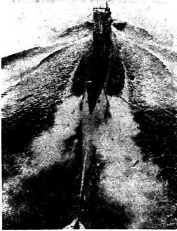
↑出沒於海面的潛艇 ↑擔任警戒的商船 ↑接近潛艇的商船 ↑圍攻之險

軍艦護送制是很有效的，原因很多：第一軍艦迫使潛水艇入海底，無從在海面上使用遠射程大砲攻擊商船。此次歐戰初起時，大多數商船都葬送在潛艇炮火之下，並非被魚雷擊中沉沒。潛水艇於海面上攻擊商船時，有被軍艦擊沉的危險。即令潛水艇施放魚雷，擊沉商船，但擔任護送的軍艦可以立即救起商船的水手，此與戰爭中的民氣頗有關係。