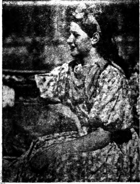
↓ 青年麗的馬加爾姑娘

那管明日無米炊之概。匈牙利的咖啡館，飯館，旅店，也和中國一樣，收小費之風很盛。所以在大飯店裏對於匈牙利的貴族，美國人，中國人，都最受歡迎，因爲這些人們花錢的時候都非常大方。匈牙利人的氣質多半都是激情的，天才的。他們的記憶力很強，學校裏的學生有許多都不抄筆記，對於語學更有天才。但是他們最大的缺點，便是太輕浮，遇事熱心得快，冷淡得也快。匈牙利人的口才都很好，就是在鄉裏的小宴會，雖然未受過多少教育的老百姓，也能說出很精彩的演詞來。