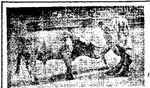
——的着慕愛烈狂女少——

馬上，馬眼覆以布罩，並攜帶着一隻類似扎槍的武器。這匹盲馬緩步前行不知死之將至。鬥牛士的態度，流露鎮靜的微笑，像毫不介意的樣子。待馬走在牛之面前，勇士突以槍刺牛之脊背，則牛將頭低下，以鋒利的兩角，猛向前衝。可憐這