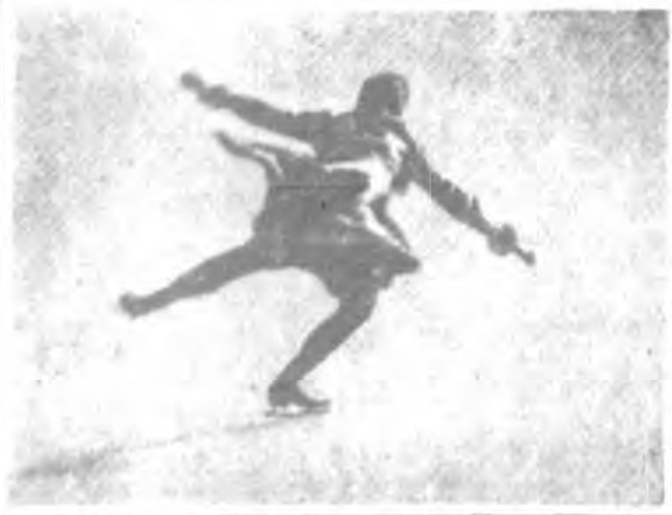
上第七圖成極美的姿勢