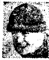
世界千五米 達速度滑冰 競賽第一名

復於午後三時舉行一萬米滑冰競走，這場比賽頗能引起觀衆之興趣，尤其這長距離的競走，日本選手認爲有了反攻的機會