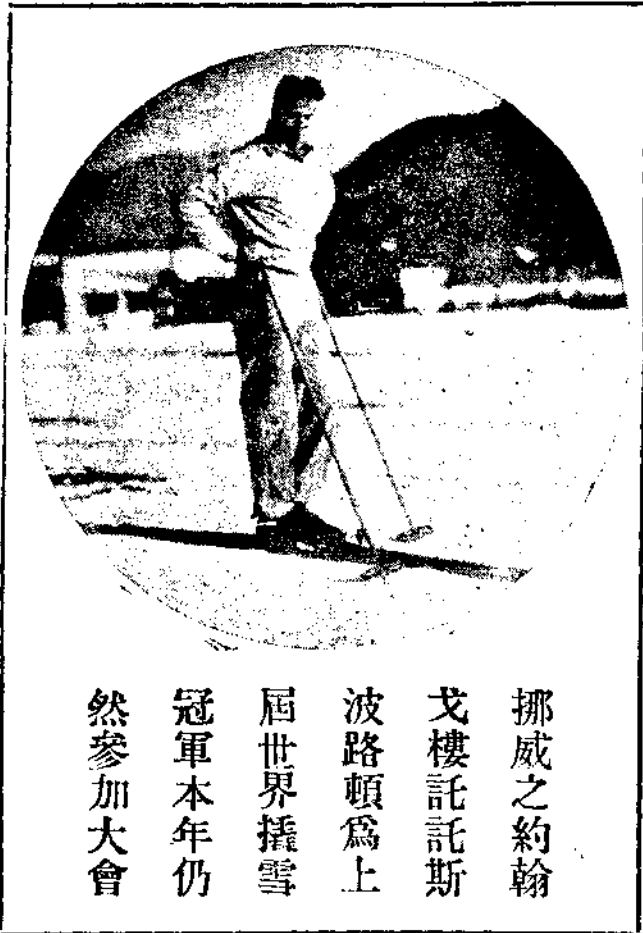
挪威之約翰 戈樓託託斯 波路頓爲上 屆世界攝雪 冠軍本年仍 然參加大會

技。各國女子選手於比賽前陸續登場，觀衆亦較前數日擁擠不堪，圍得滿場風絲不透，水洩不通，好似都爭先恐後以一睹女子競賽爲快。那些天真瀾漫女選手們，均着本國顏色的運動服，襯着富有吸引力的雪白皮膚，的確能使一般觀衆的目