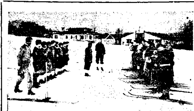
挪威及日本選手在紐約潘樓雪湖冰上練習之情形