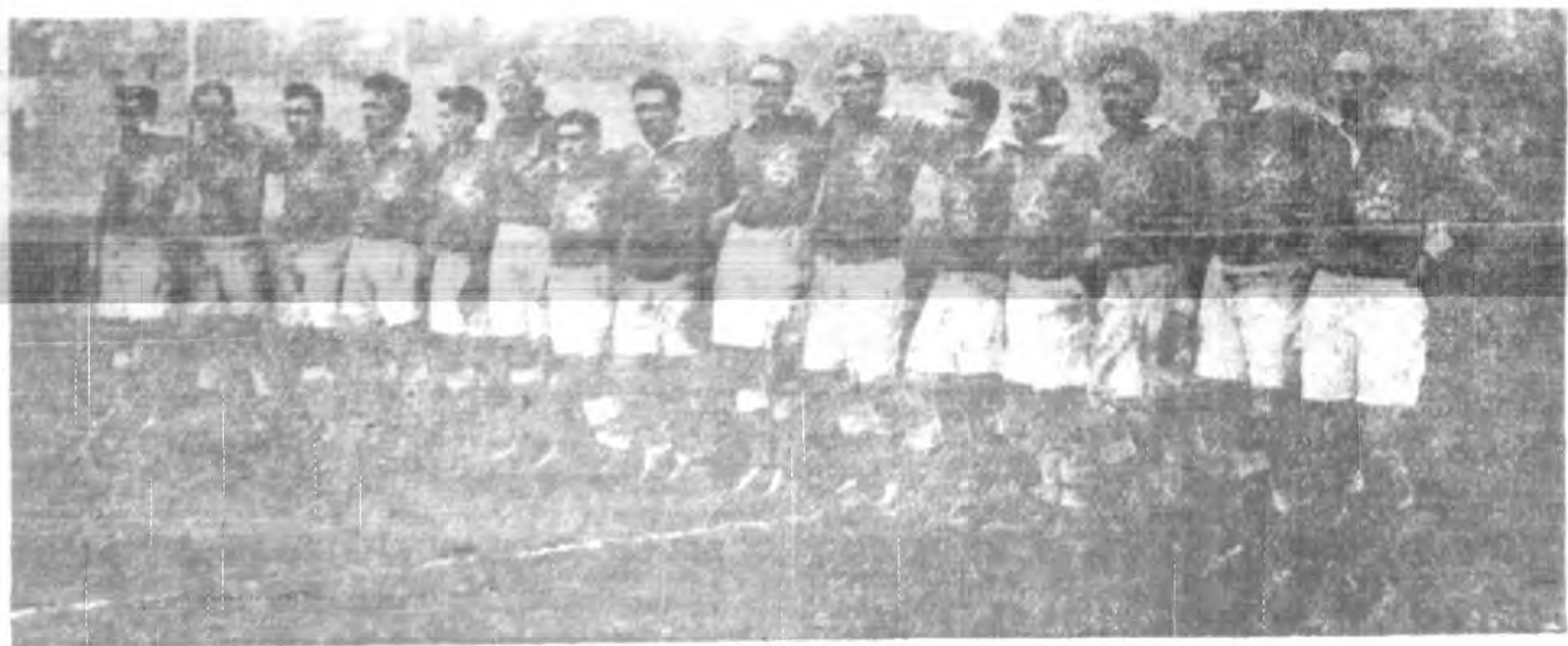
影合體全隊球足式美大拿加日征

加拿大隊 斯木 羅魯 威里 絲思 魯恩 得嘯 魯斯 庫斯 威里 絲思 魯恩 得嘯 魯斯 斯木 羅魯 威里 絲思 魯恩 得嘯 魯斯 庫斯 威里 絲思 魯恩 得嘯 魯斯 斯木 羅魯 威里 絲思 魯恩 得嘯 魯斯 庫斯 威里 絲思 魯恩 得嘯 魯斯 斯木 羅魯 威里 絲思 魯恩 得嘯 魯斯 庫斯 威里 絲思 魯恩 得嘯 魯斯