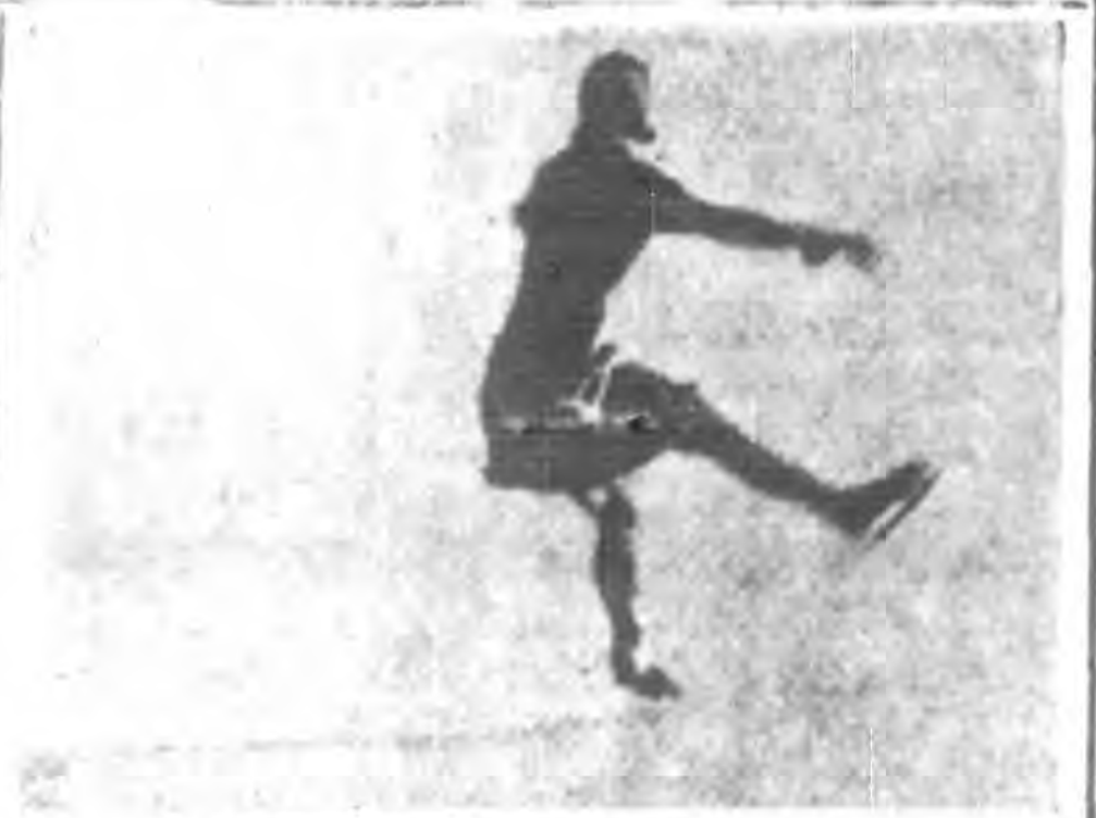
下第五圖 單足外弧形倒行