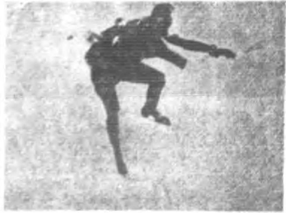
上第六圖單足外弧形滑倒轉