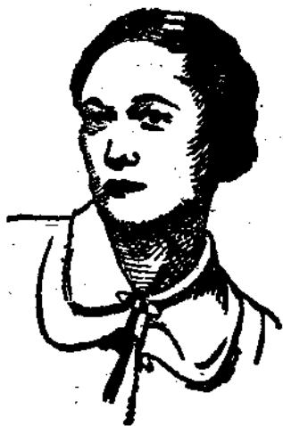
已與英王結婚之辛浦森女士(辛浦森夫人)之影

本書分兩部份敘述，前部份着眼於英吉利憲政而敘述愛德華八世與辛夫人的戀愛問題。自布蘭德主教正式警告敘起，將英王與內閣及議會互相對立的形勢，及王室內部籌商的經過，以及英王以國家前途為重毅然犧牲一己的尊榮等項，詳述無遺，而愛德華八世崇尚個人自由的信念，尤能發揮盡致，一九三六年十二月上旬，愛德華八世一身之所經歷，更竭力渲染，極波瀾雲詭之妙。後部以辛夫人的生平為主，根據威爾遜夫人著辛夫人傳譯成——將夫人自幼至今所有經過，記載詳盡，世所未知者，固盡量表暴，世所傳訛者，亦多方引證，祛疑解惑。威爾遜夫人為辛夫人密友，故所記極其確實，毫無誇張粉飾之處。