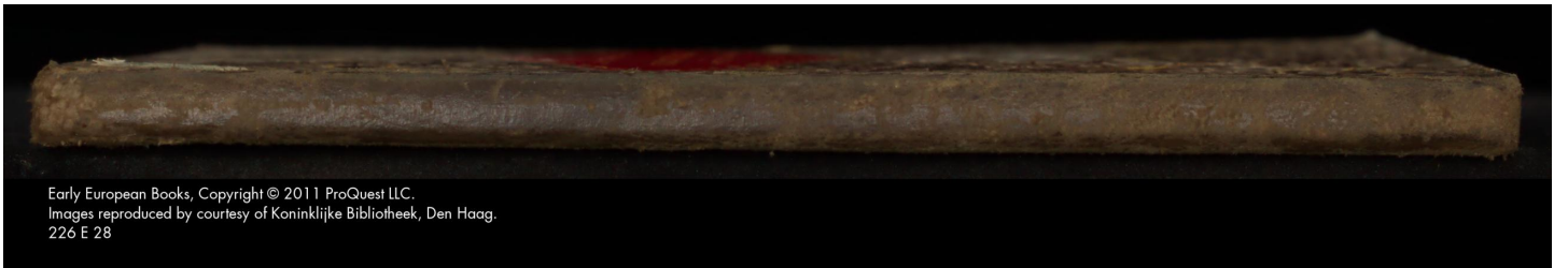
226 E 28