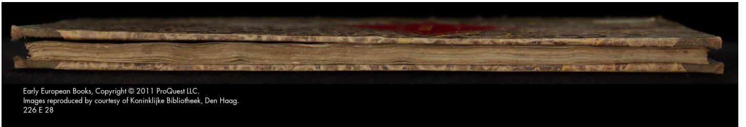
226 E 28