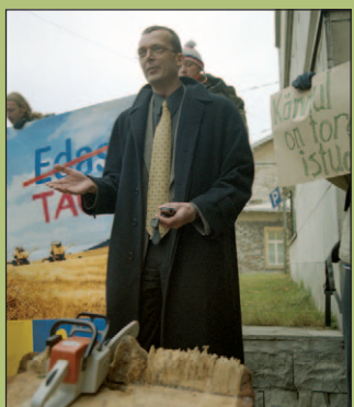
Loe lk 4-5.

Kokkuvõtlik ülevaade möödunud aastal Eesti keskkonnavalikust enim puudutanud teemadest — Lahemaa metsaröövlist kuni põuasurmahohu kormekullesteni.