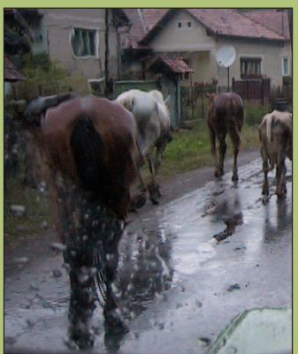
Loe lk 6.

Mullusuvised uputused ja paduvihmaad Euroopas, samuti kuumalaine ei ole enam ülalatus — kliimatoloogide kinnitusele võib pea iga järgmine aasta selline välja näha.