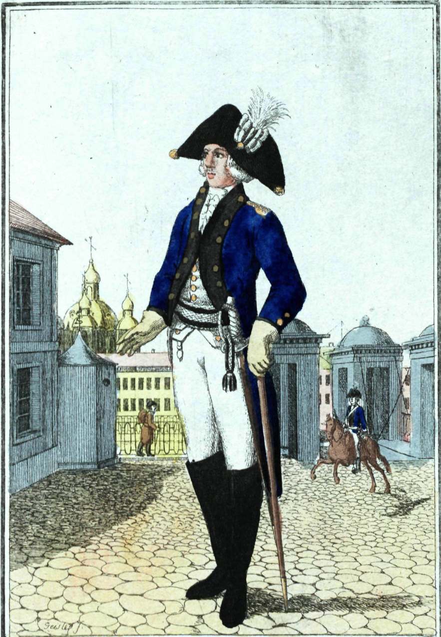
С петербургской Губернш Офицеръ