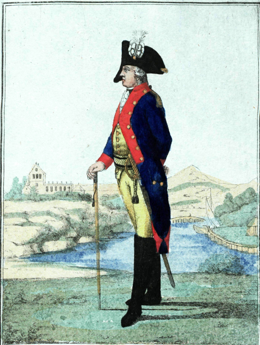
Сенатской и провіантской Офицера.