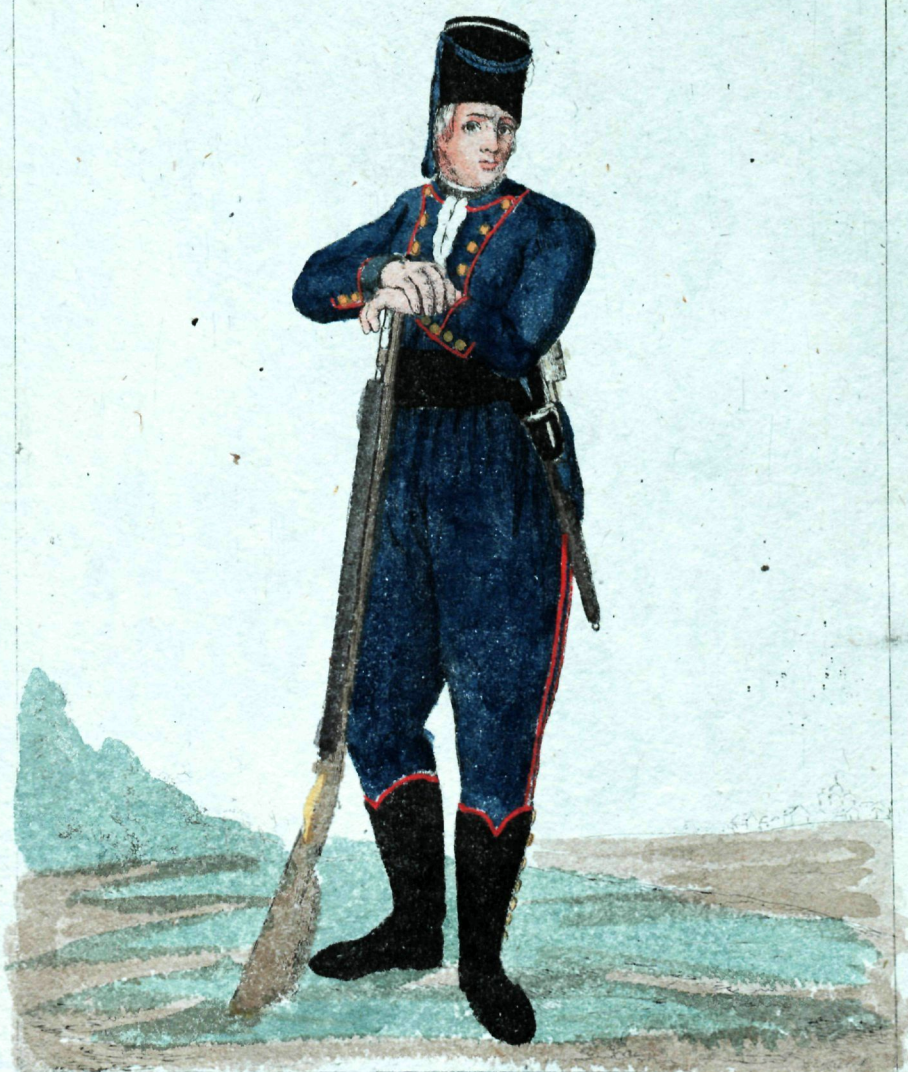
Вардин преобробленског полка Езерв.