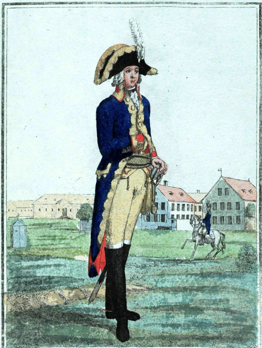
Конной Гвардiи Офицеръ.