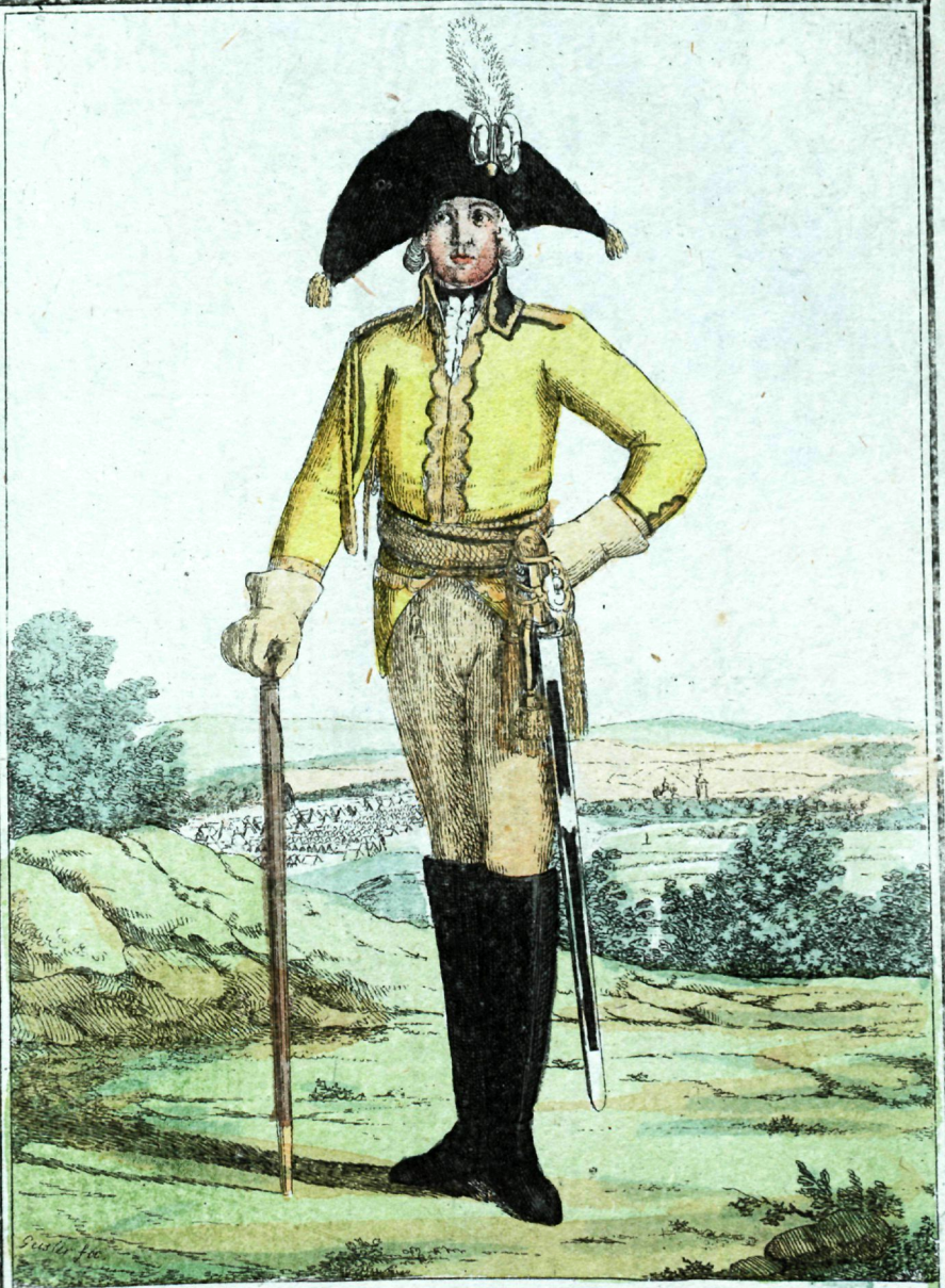
Св. Георгія Кирасирскаго полка офицеръ.