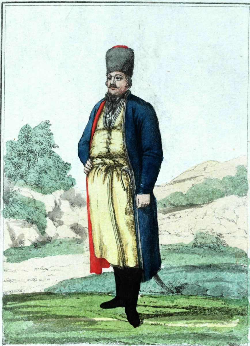
Донскаго Войска Кавалеріи офицеръ