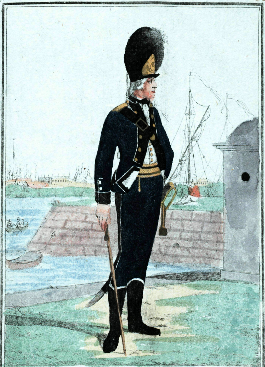
Флотской артиллерийской офицеръ.