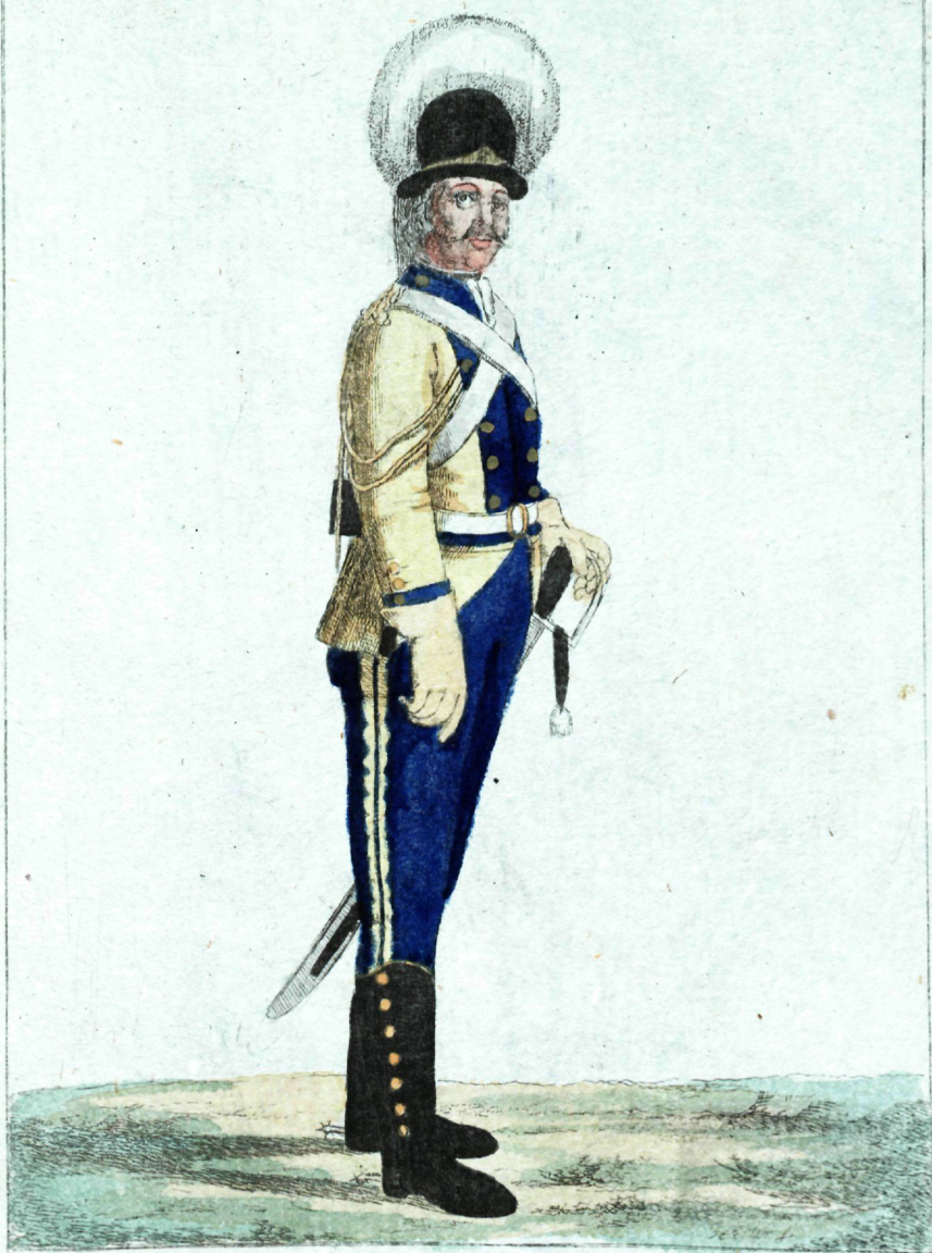
Каван полка, Кирасиръ