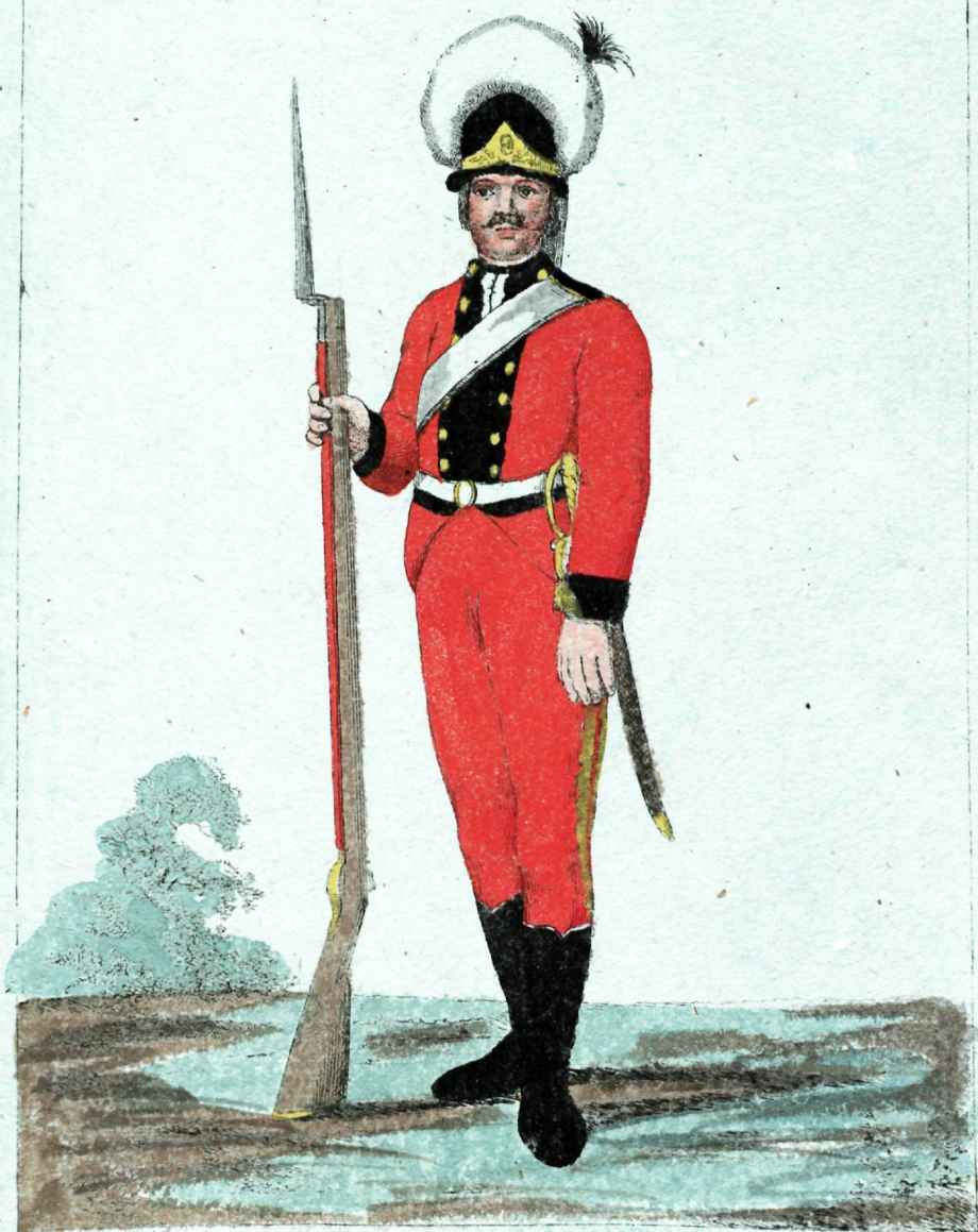
Бомбандиръ, Кононеръ и срузе- меръ