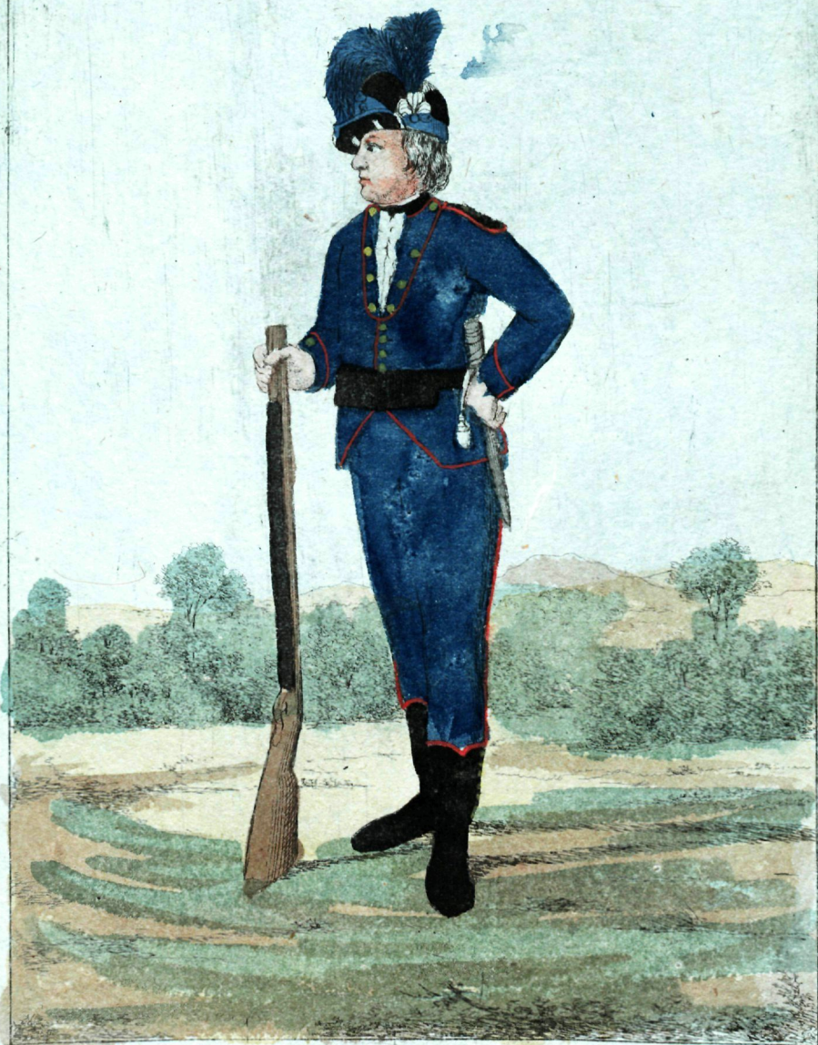
Л. Е. измайловскаго полка Егерс.