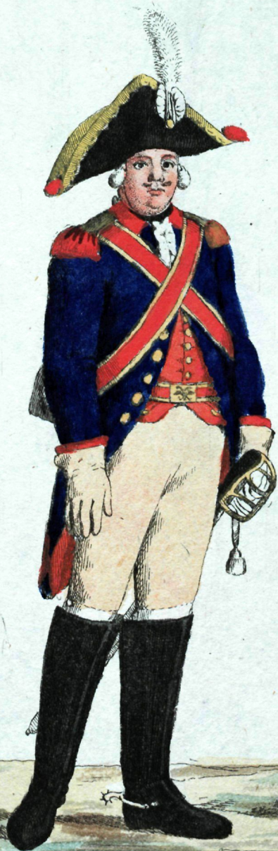
Конной Гвардии реитарь