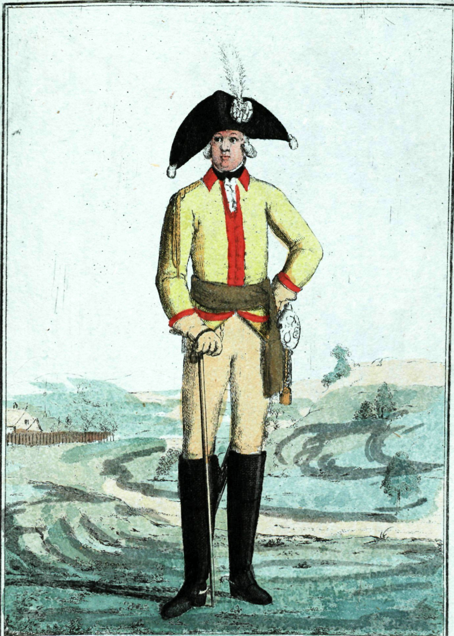
Наслѣдника Кирасирскаго полка офицеръ.