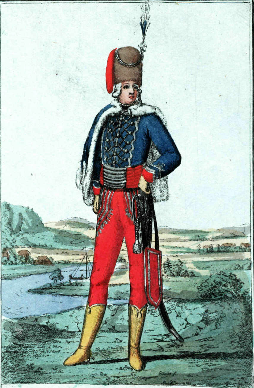
Лейбъ Бусарской Офицеръ