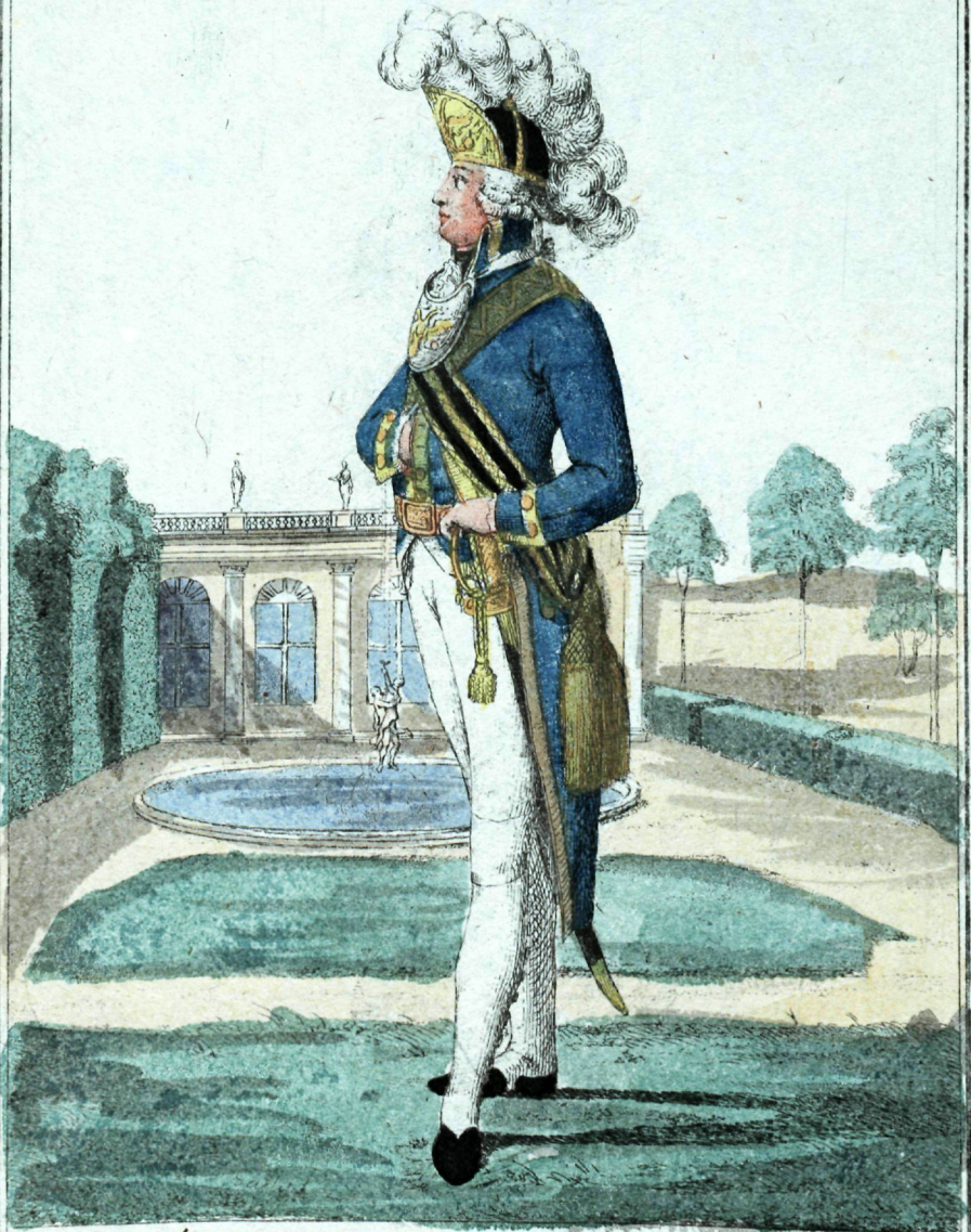
Лейбъ Эвардию Преображенскаго полку ермандерскихъ ротъ офицеръ.