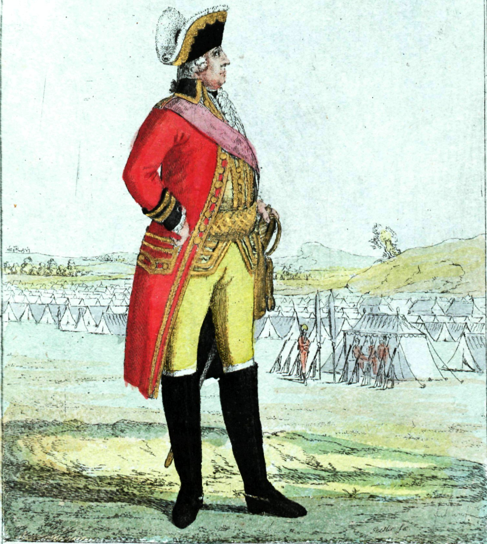
Генералъ поручикъ Артиллеріи