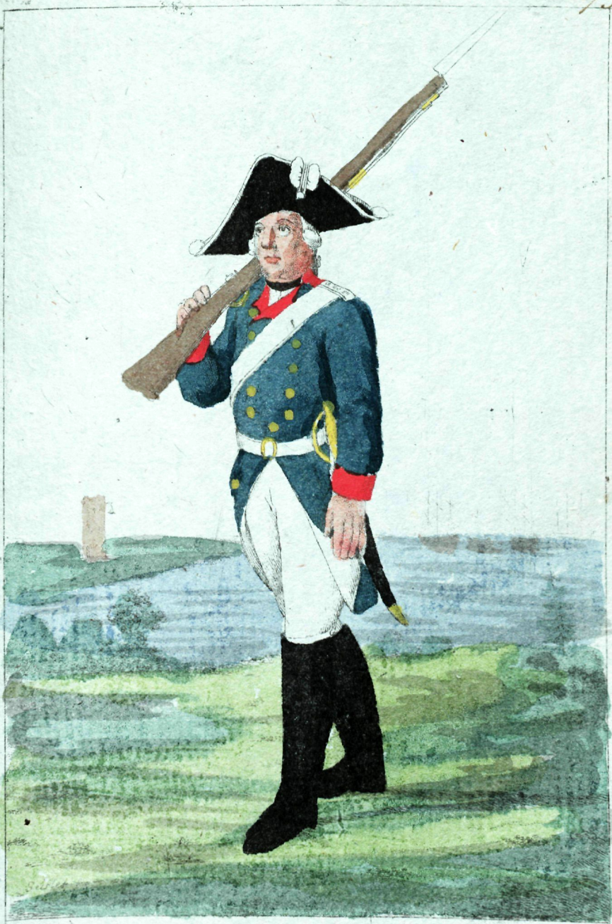
Флотский батальонъ Мушка теръ