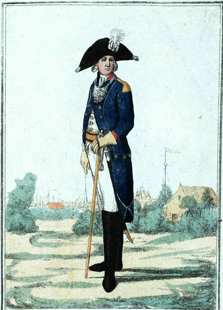
Греческаго Кадетскаго Корпуса офицеръ