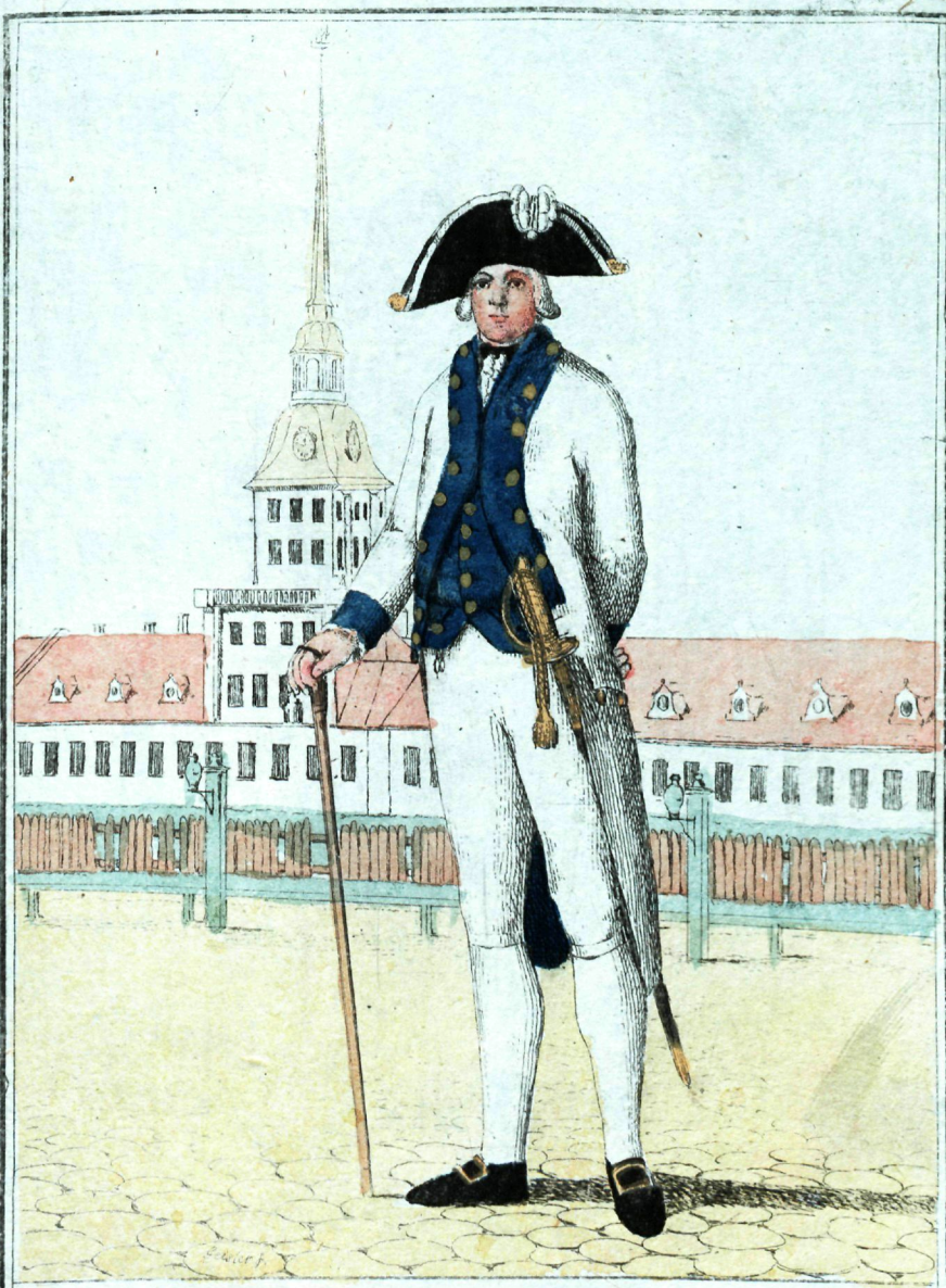
Флотской Корабельный офицеръ.