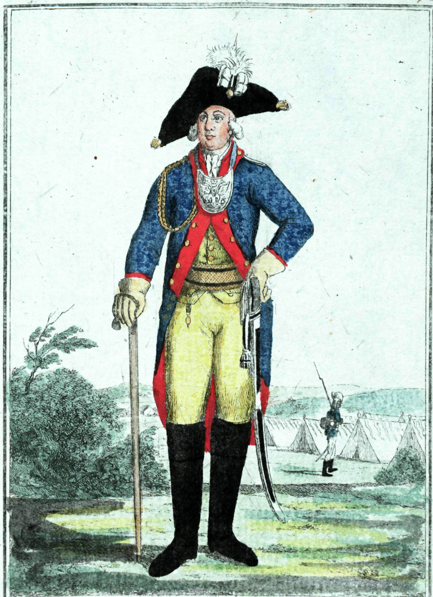
Драгунскихъ полковъ офицеръ.