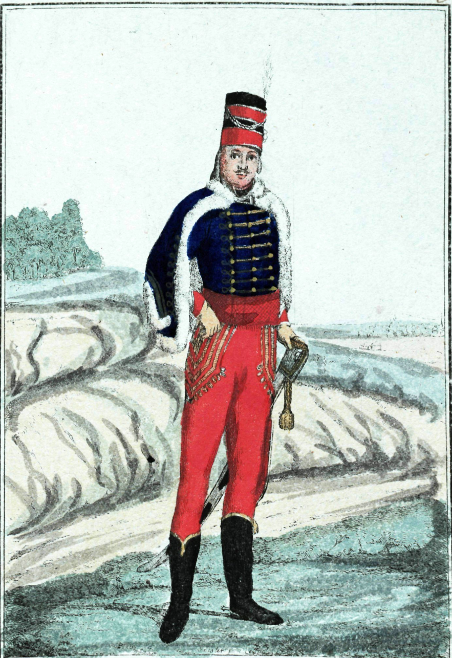
Цесарскій Офицеръ, приписанный къ псковскому Драгунскому полку