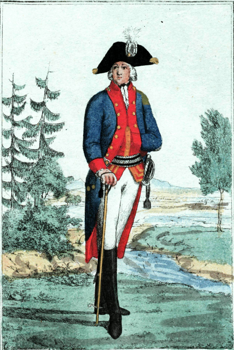
Полковникъ Карастинернѣ Полковѣ