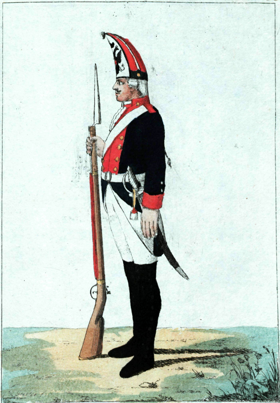
Члгого баталіона Гранодеръ