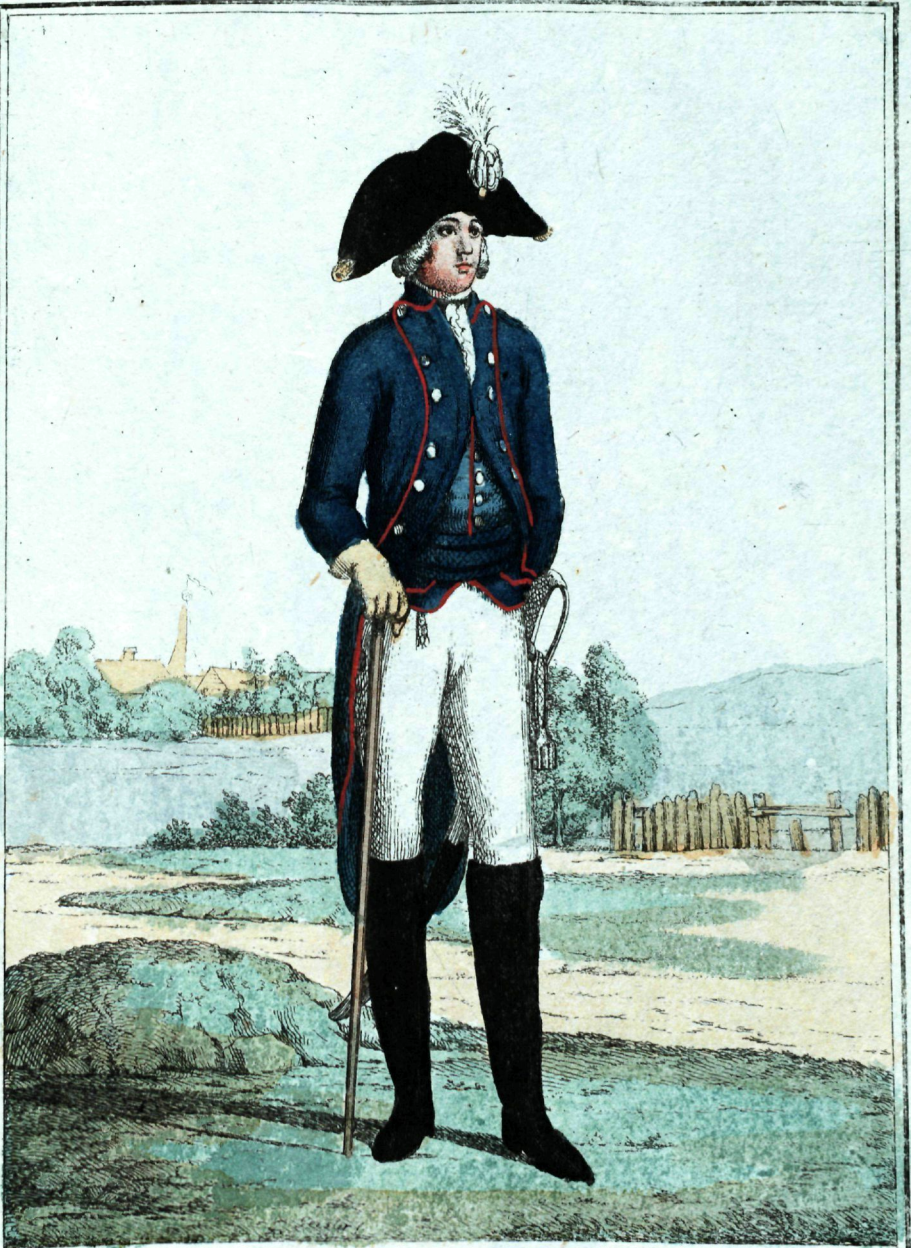
Конныхъ Егерскихъ полковъ офицеръ