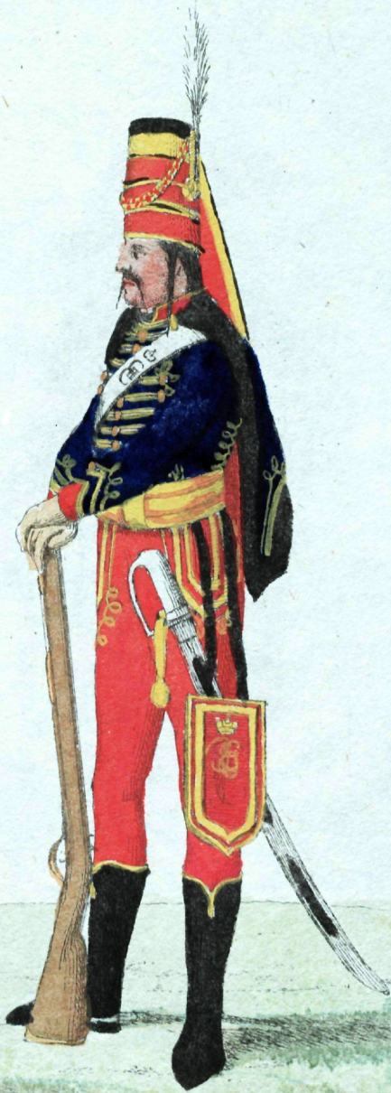
Гусаръ къ томицке полку приа