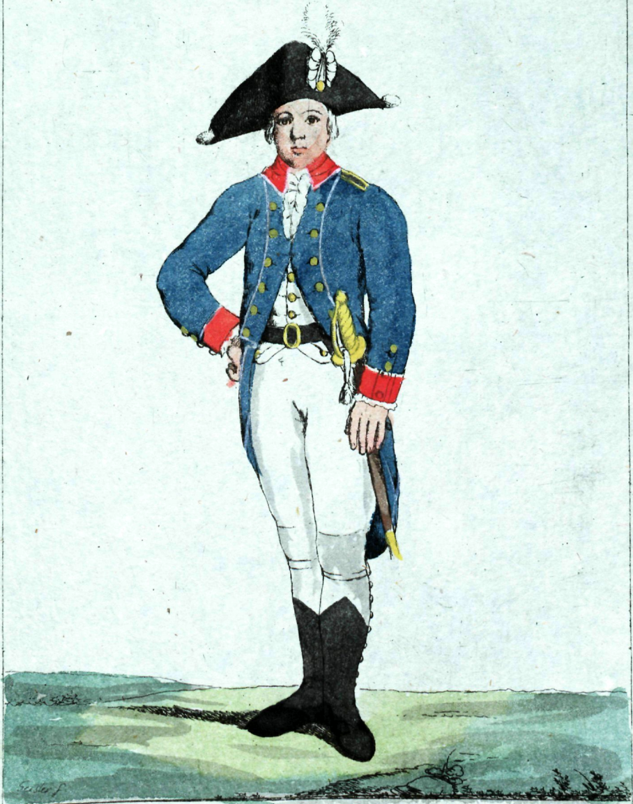
Еретицкаго Корпуса Кадетъ.