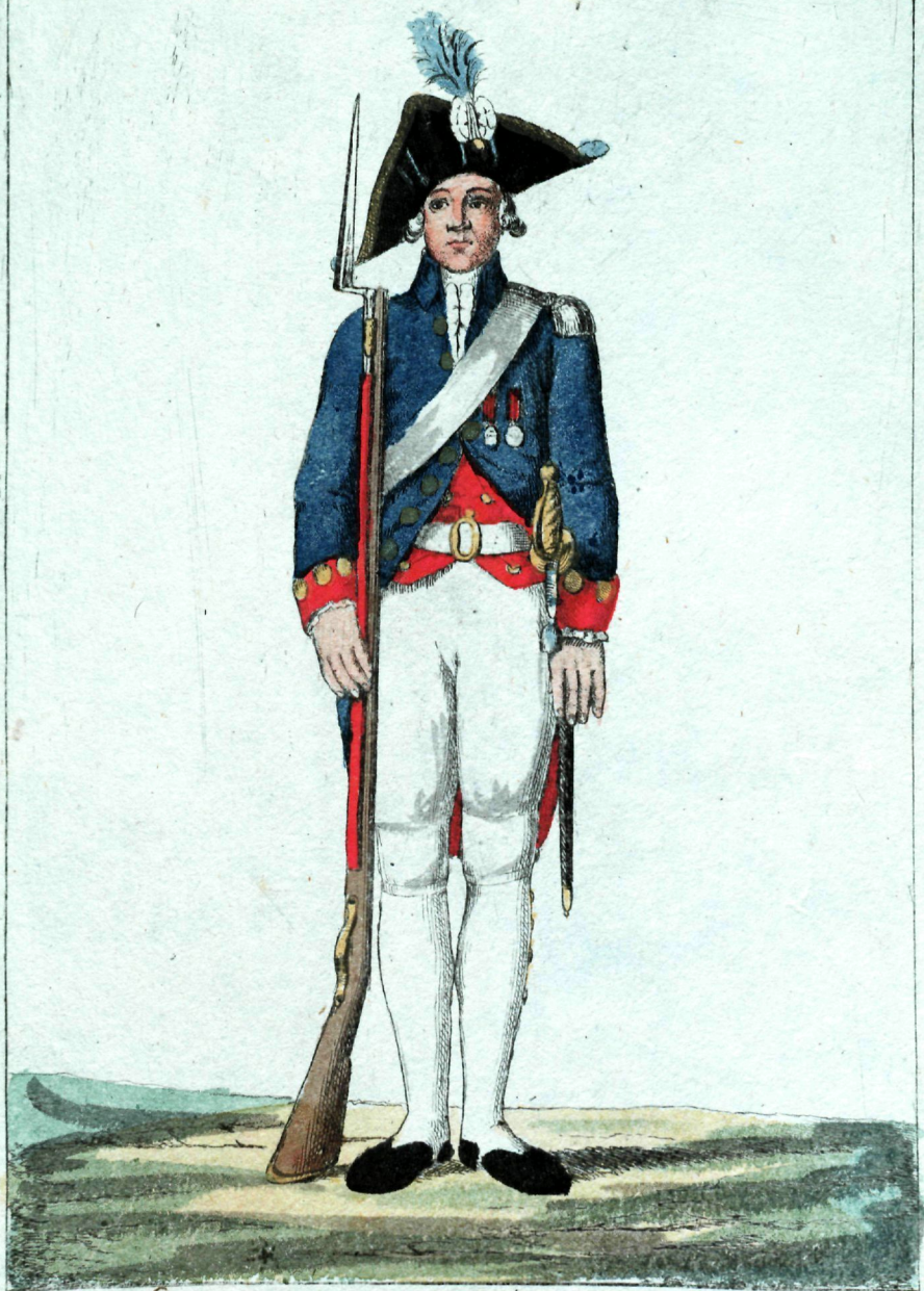
Лейбъ гвардіи Уманайовскаго полку мундиръ.