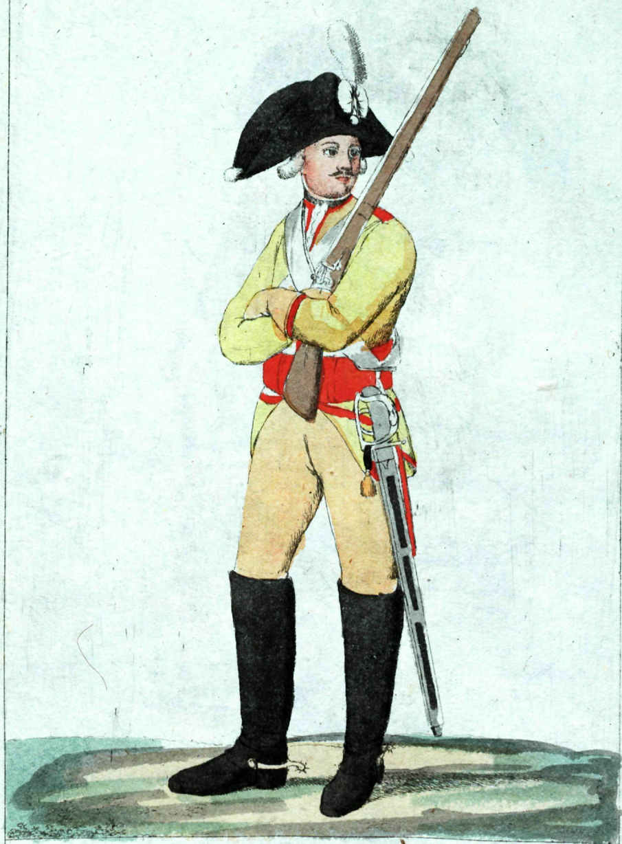
Молоде Полка Кирасиръ