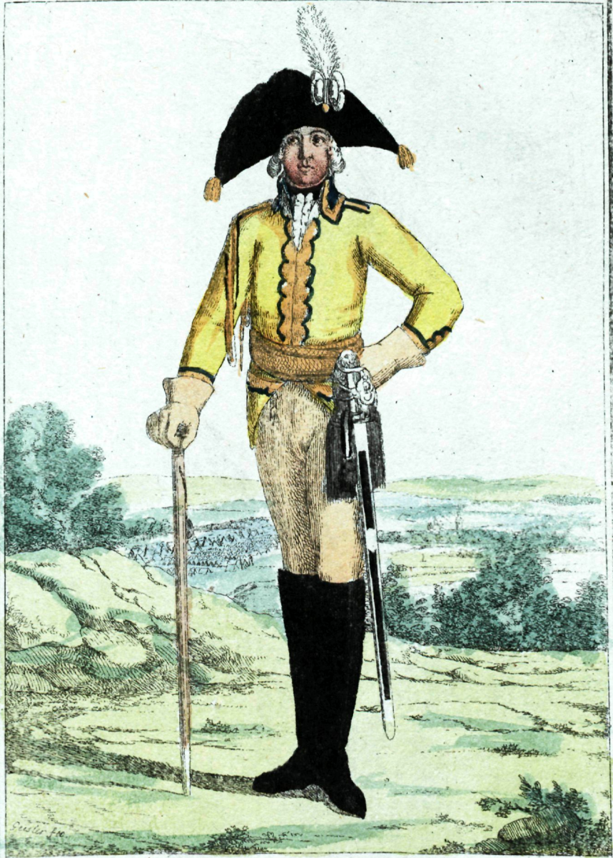
Лейбъ Кирасирскаго полка Офицеръ.