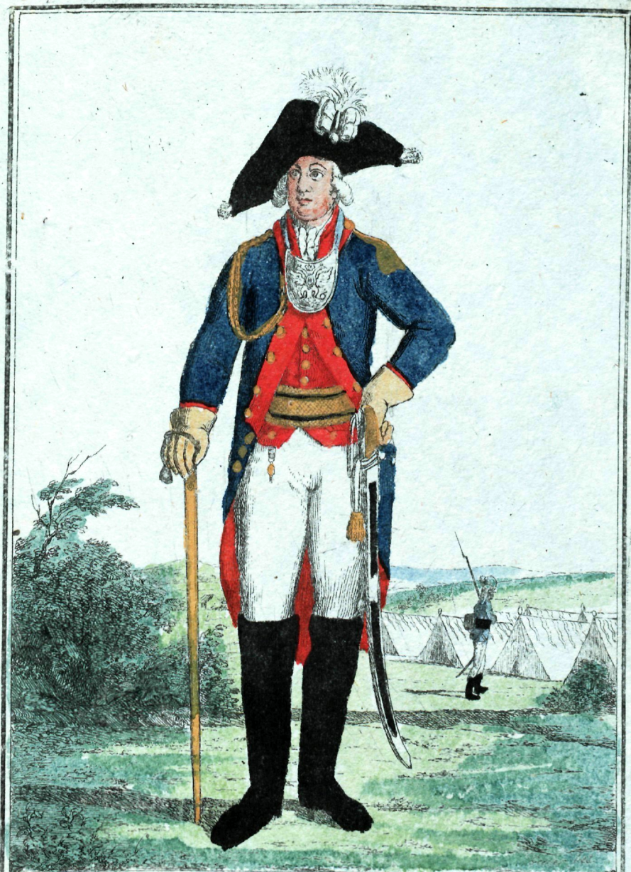
Лейбъ Гранодерскаго Полка Офи церъ