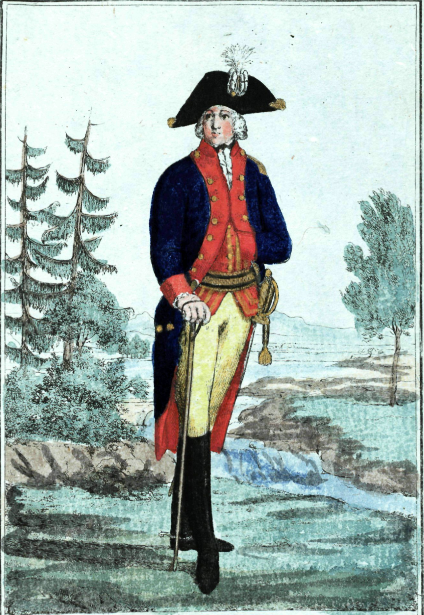
полковникъ, Прикиръ и Селу, Козь Майоръ Пехотнѣ полковъ