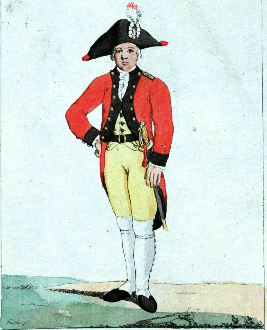
моє же Копруца Кадетъ