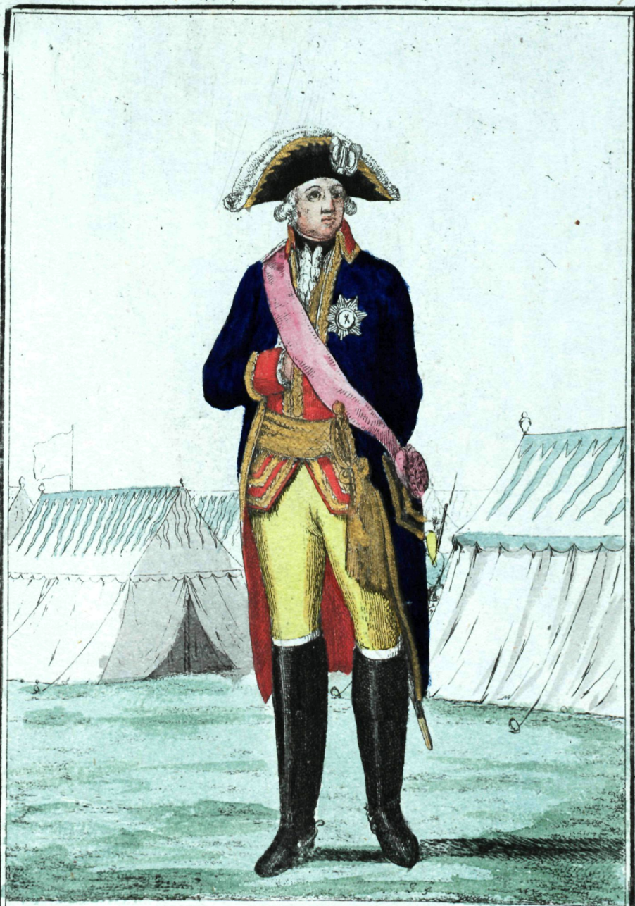
Генералъ Майоръ отъ Кавалеріи