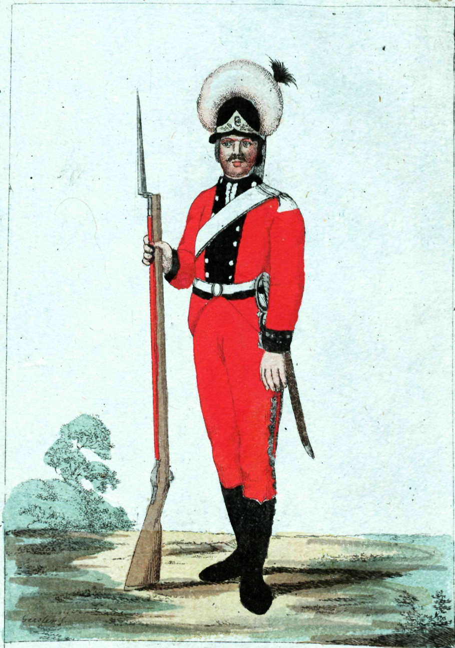
Штыкёръ Минеръ и пионеръ.