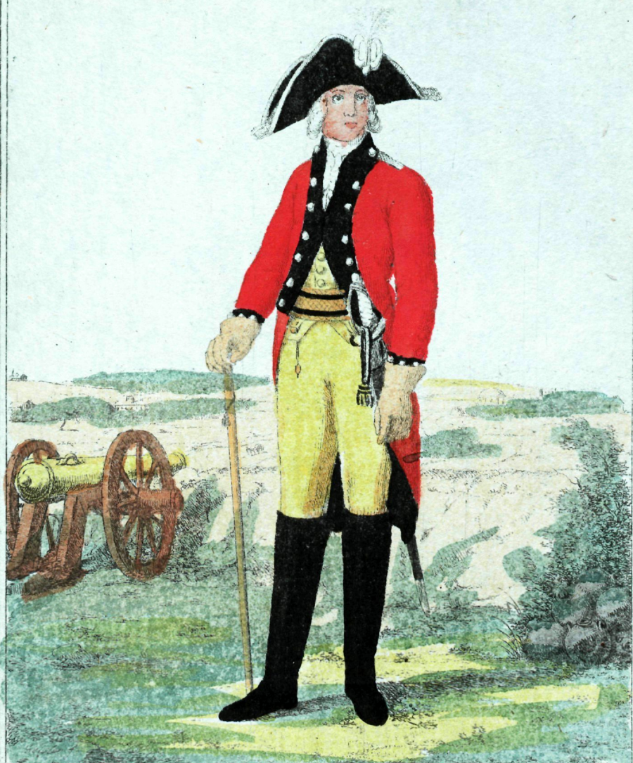
Главной Артиллерии, бомбъ и др- ской Конозерской и срузелернъи Офицеръ