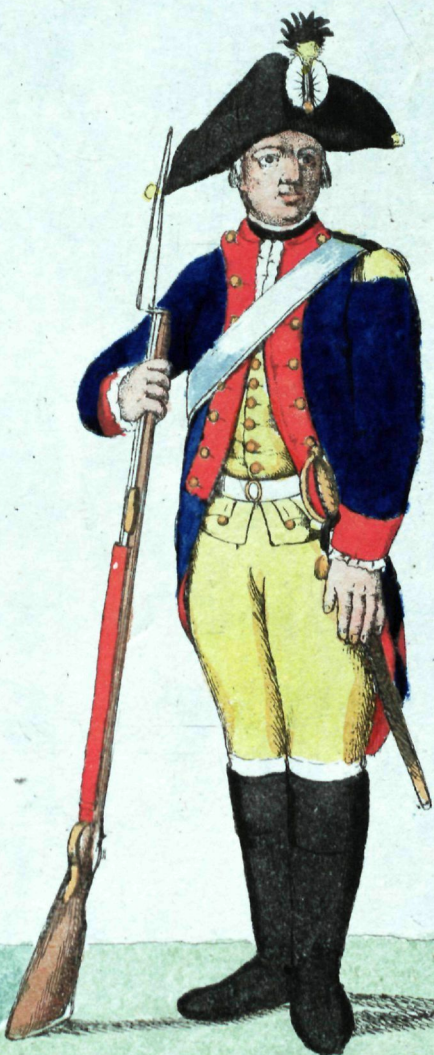
Wloem Kon Condans