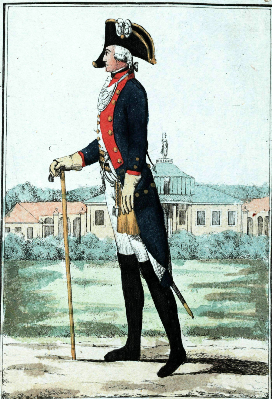
Перваго флотскаго бата ліона офицера