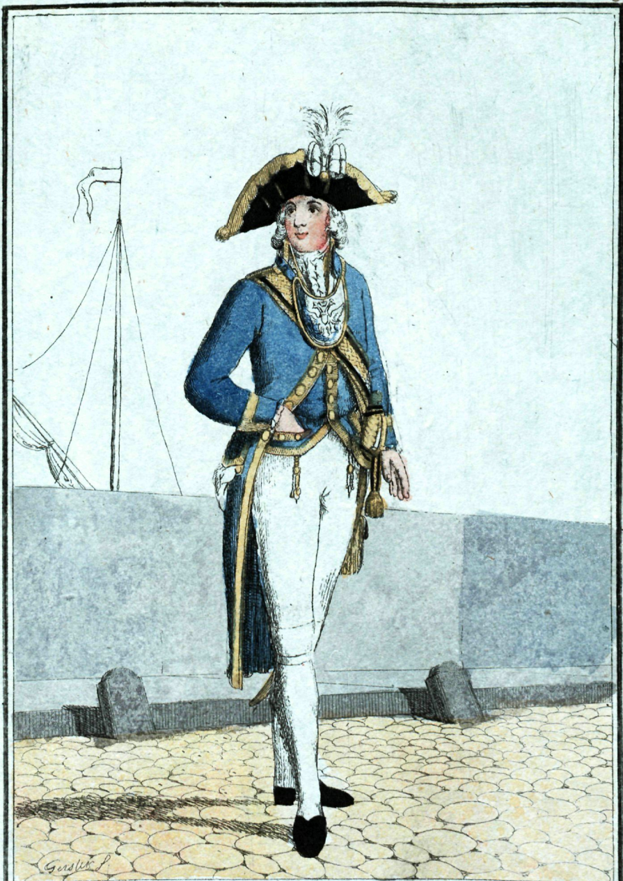
Лейб-Гвардія Семёновскаго Полка Музыкатерскій ротъ офицеръ