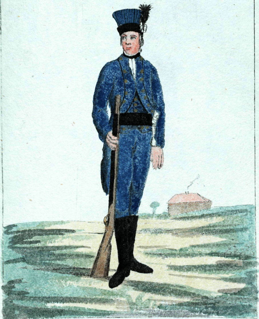
мѣсто Гвардіи сѣмковскаго Пѣхота Егеръ.