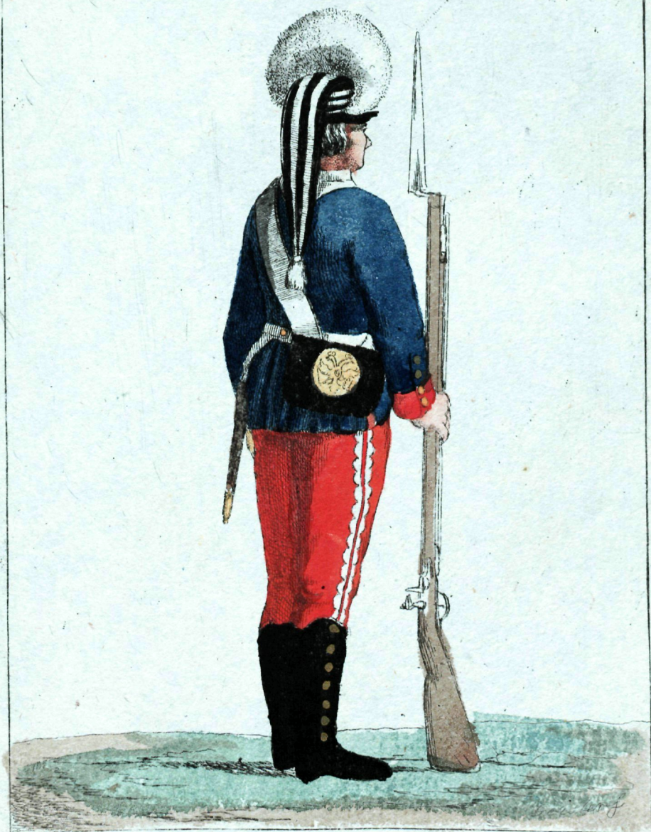
Первое Морское Полка Гранодер