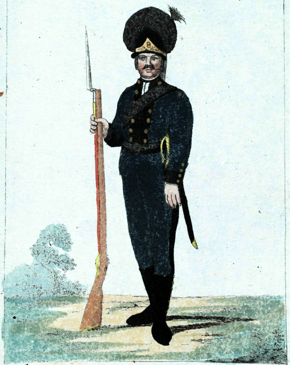
Гребной флотилии Грандьеръ