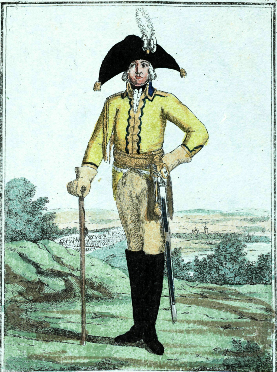
Каванскаго Кираскаго Полка Офицеръ.