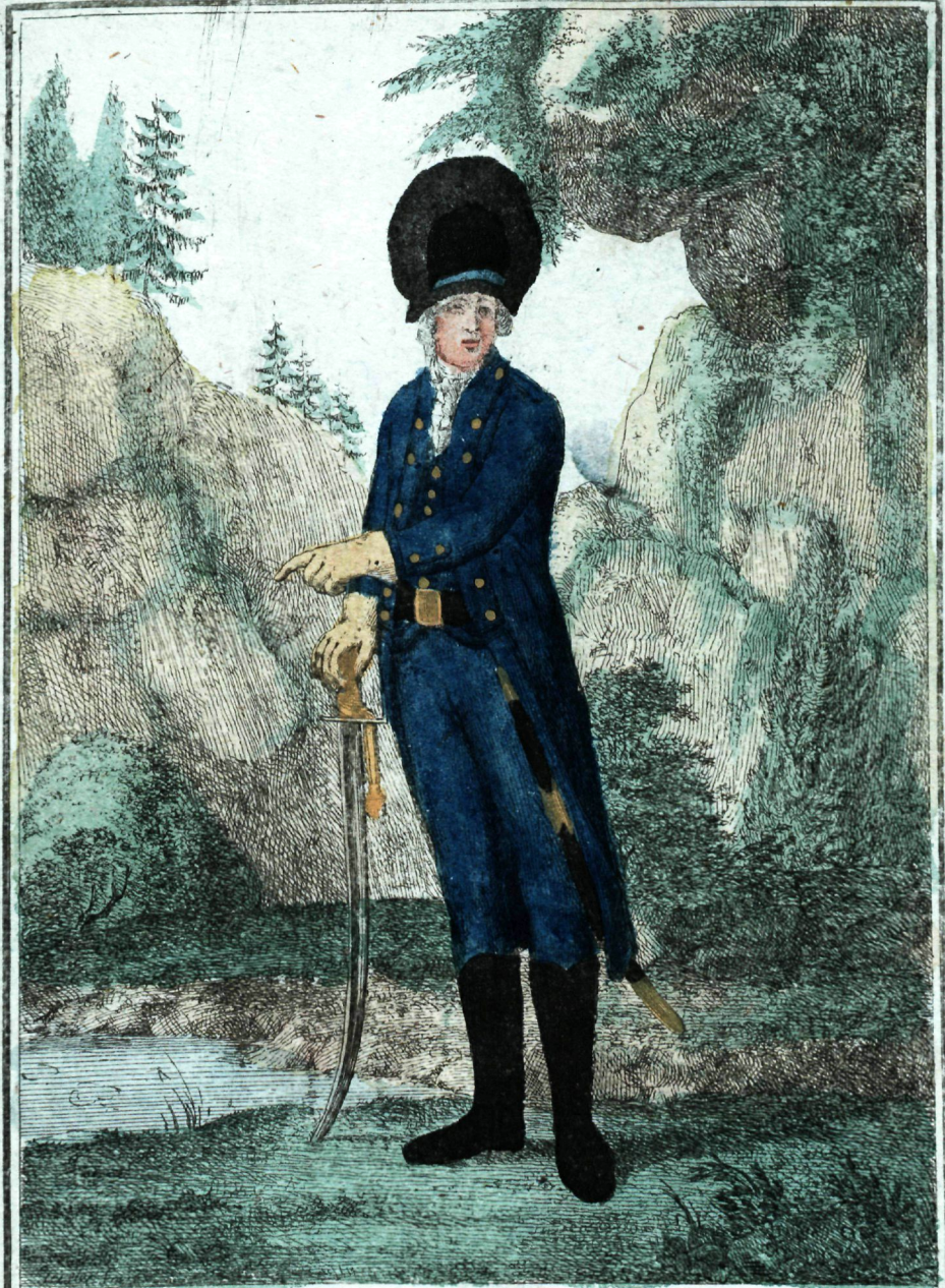
пехотный Егерский батальон Офицеръ