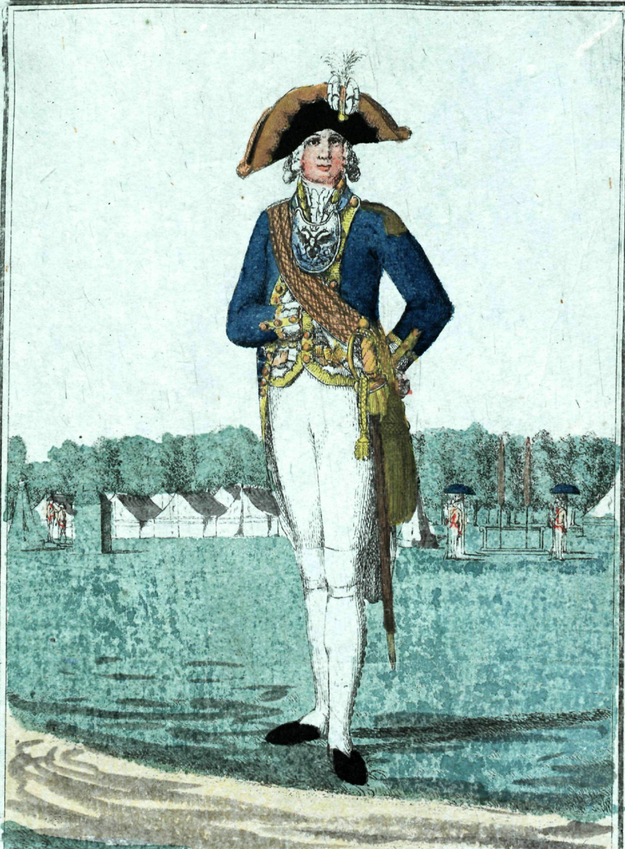
Морского, шихетнаго Кадетска го Корпуса Офицера