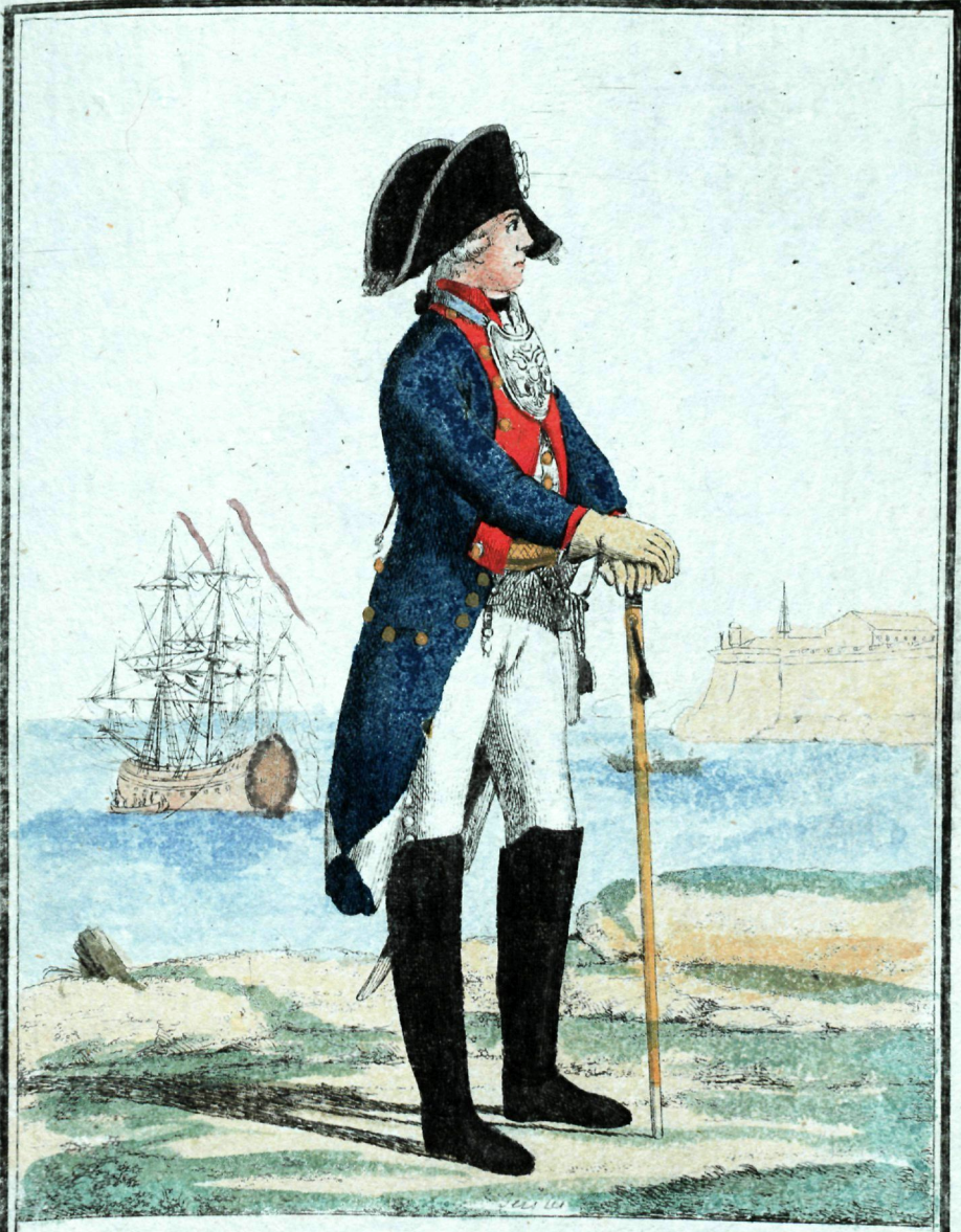
Флотскихъ Баталіоновъ Офицеръ