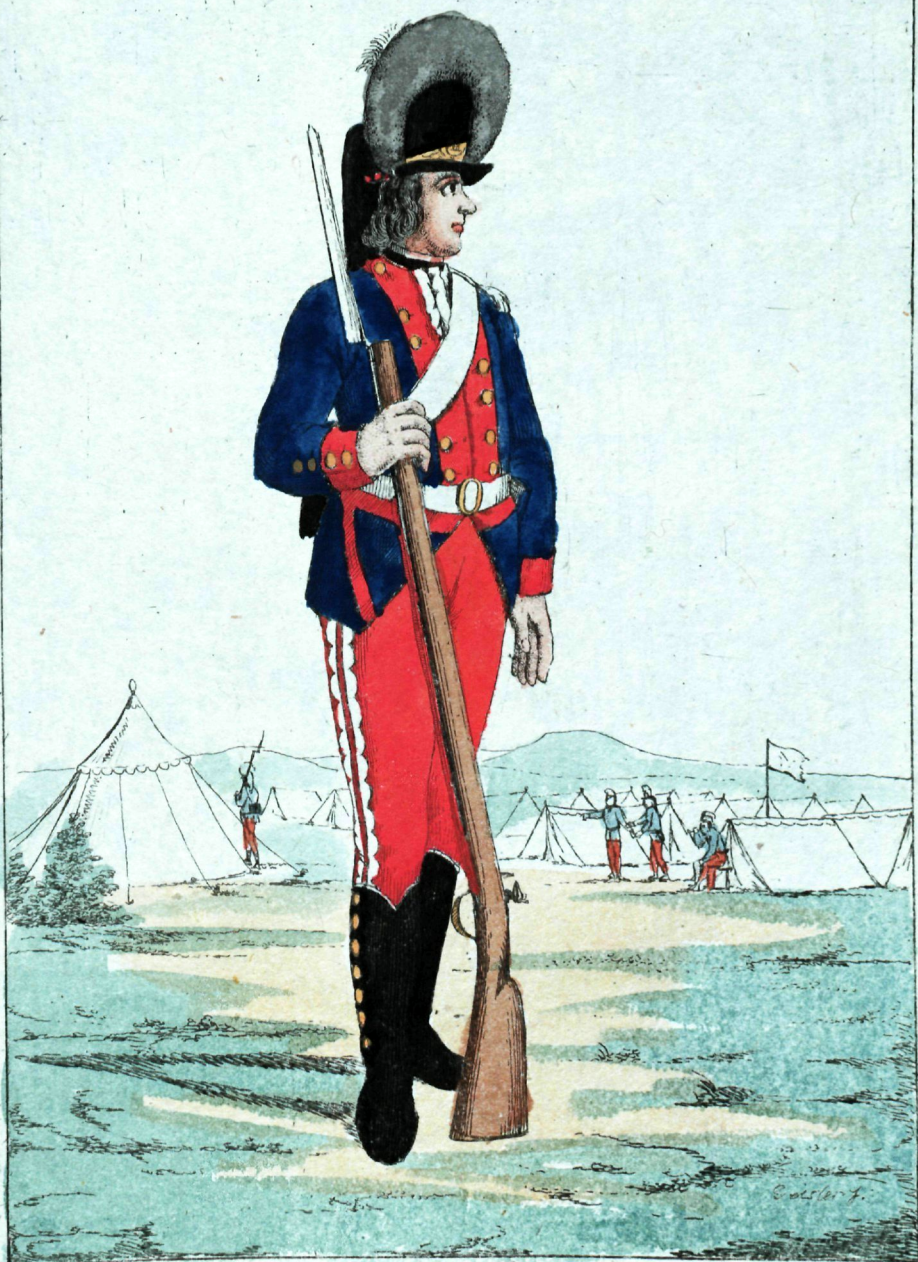
Морскихъ пехотныхъ полковъ Мушкетеръ.