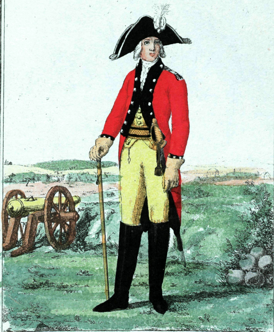
Инженерный Мундирный и пioneerный Офицеръ.