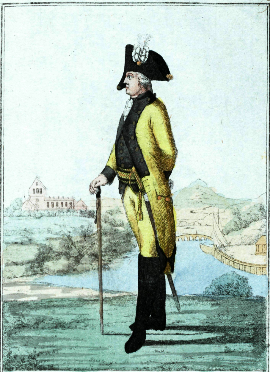
Иностранной Коллегии секретеръ