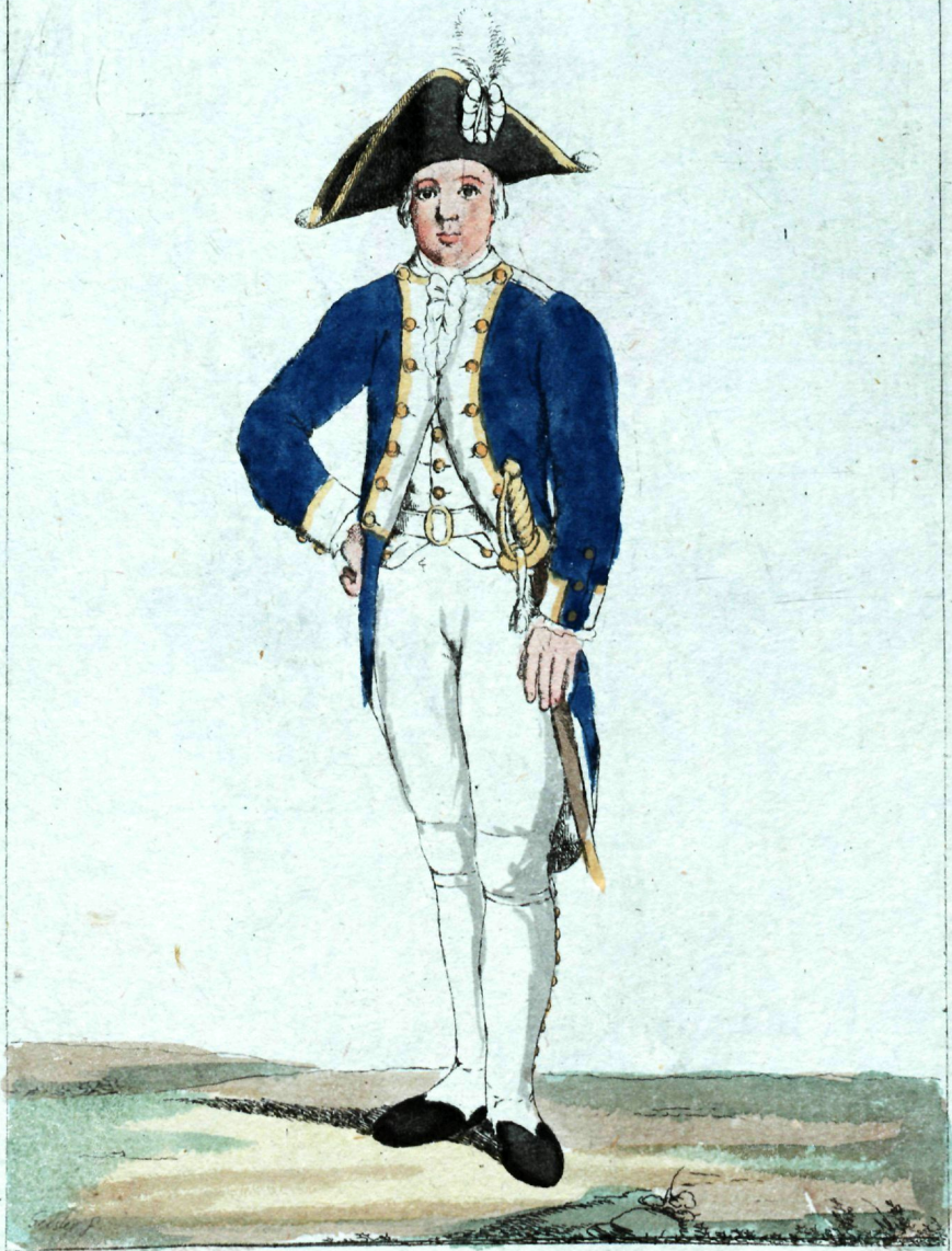
моего же Корпуса Кадетъ.