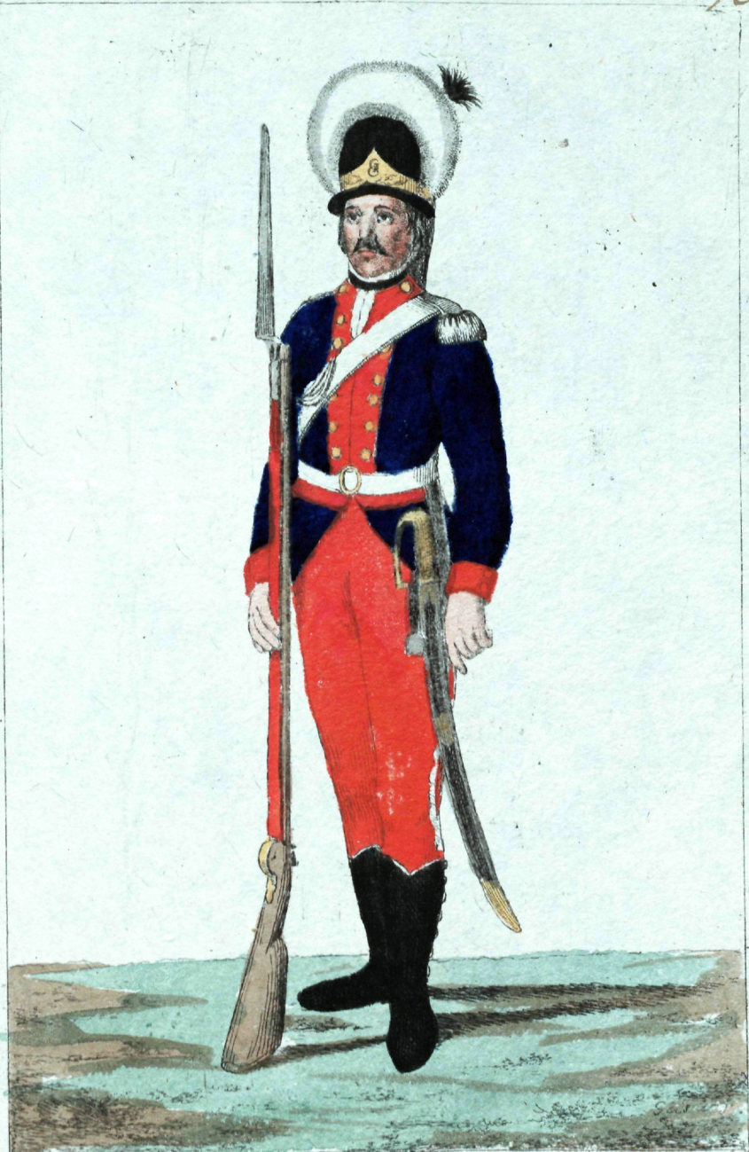
Провиантскаго штаба сол- датъ.