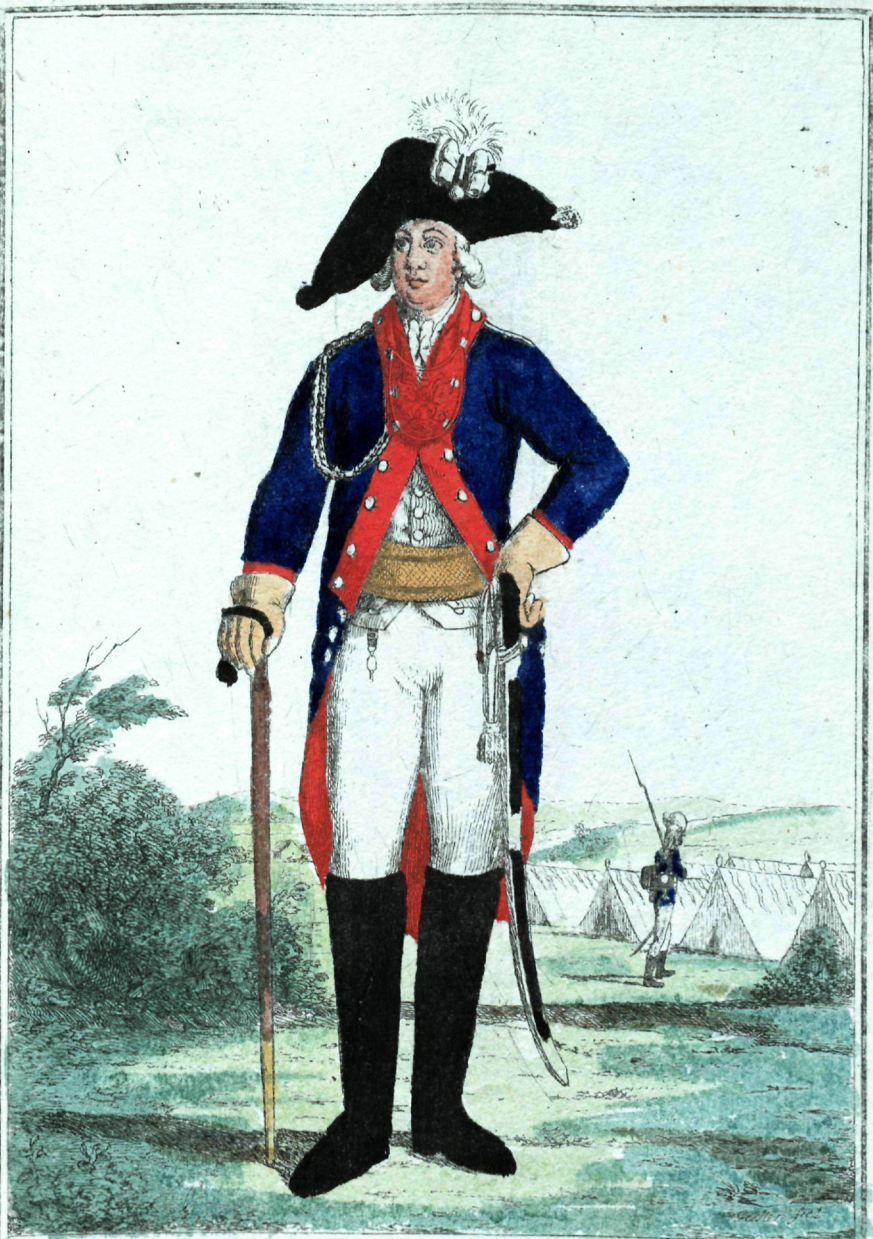
Легкоконный полковъ офицеръ.