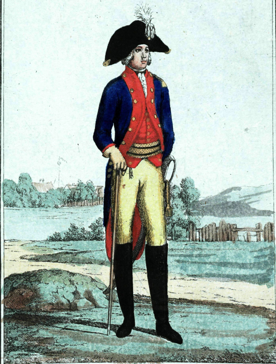
Кораблехерныхъ полковъ Офицеръ