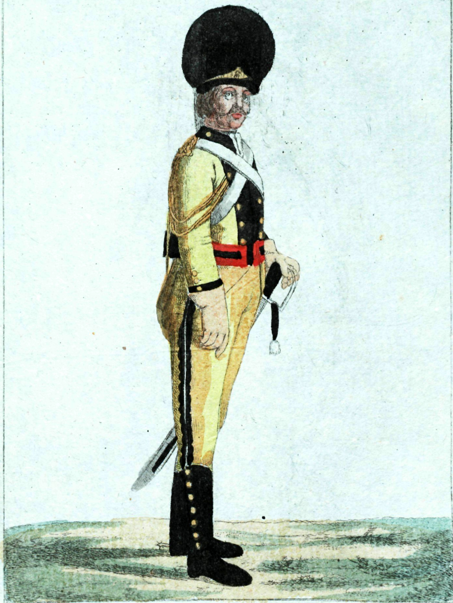
того же Полка Кирасиръ