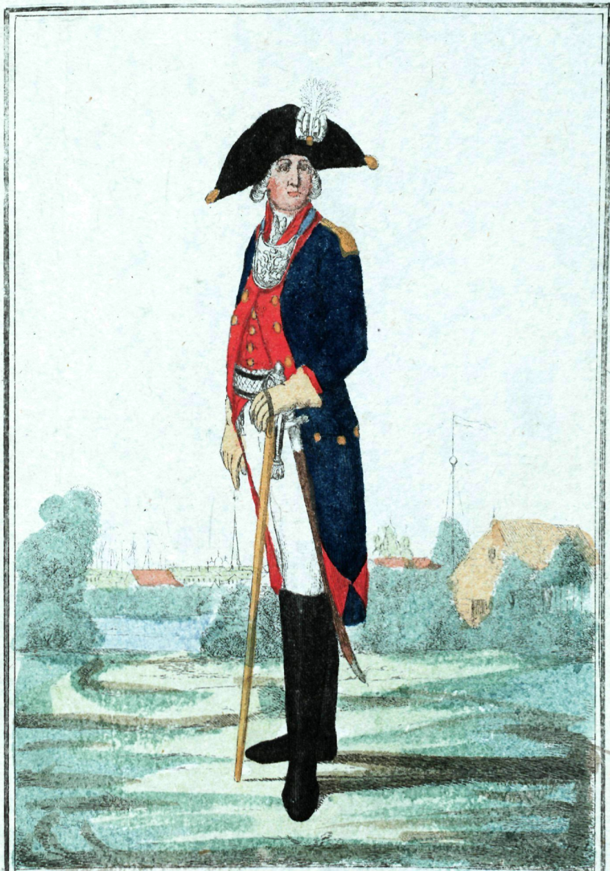
Морскихъ и пехотныхъ Полковъ офицеръ.