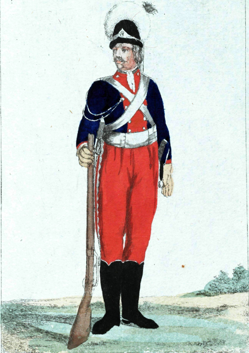
Легко Кокный рздовой.