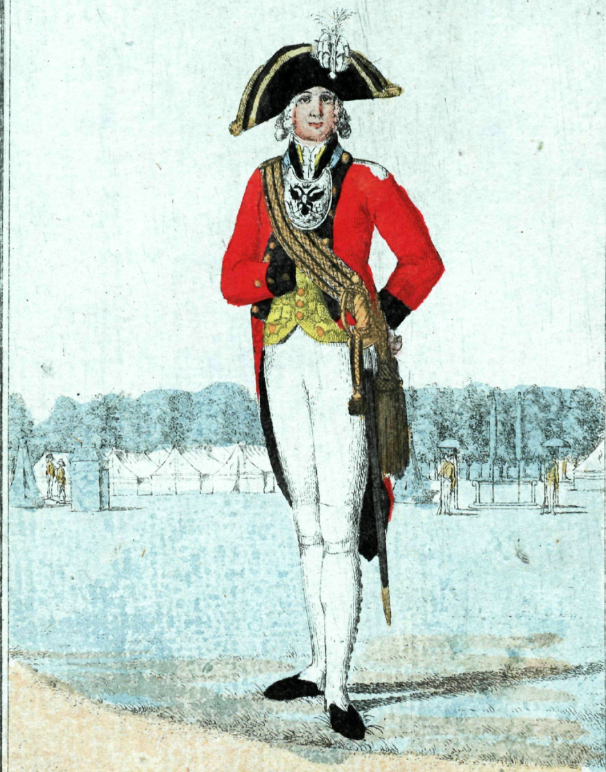
Артиллерійскаго, и икожегернаго швейцарскаго Кадетскаго Корпуса офицеръ