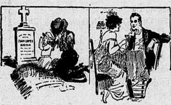
O Vigor atrahê irresi stivelmente a Belleza.