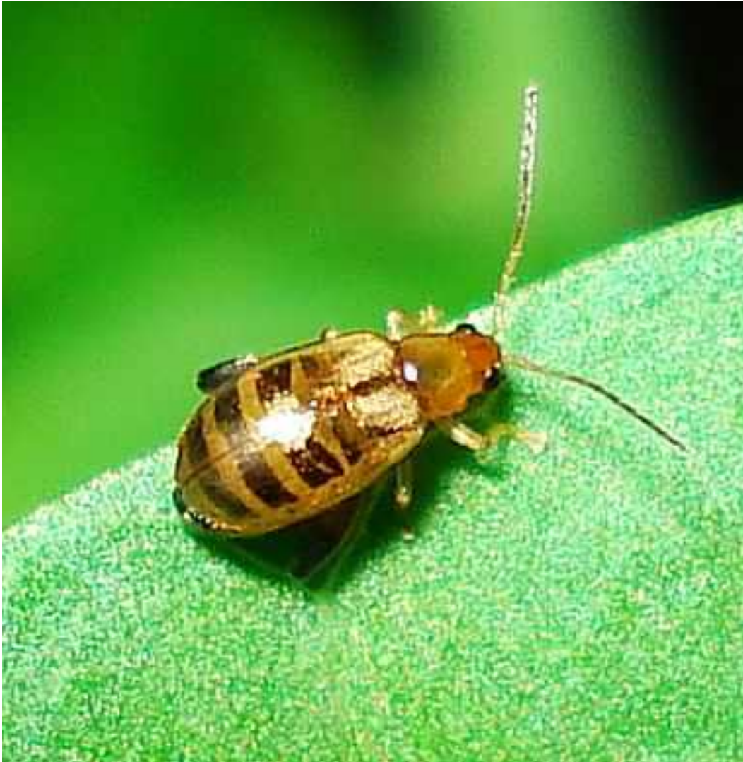
Longitarsus cf. substriatus

Longitarsus substriatus – Mide de 1,7 a 2,2 mm de longitud. Color amarillo pálido, algo más anaranjado en la cabeza y el pronoto. Se alimenta de plantas Lamiáceas.