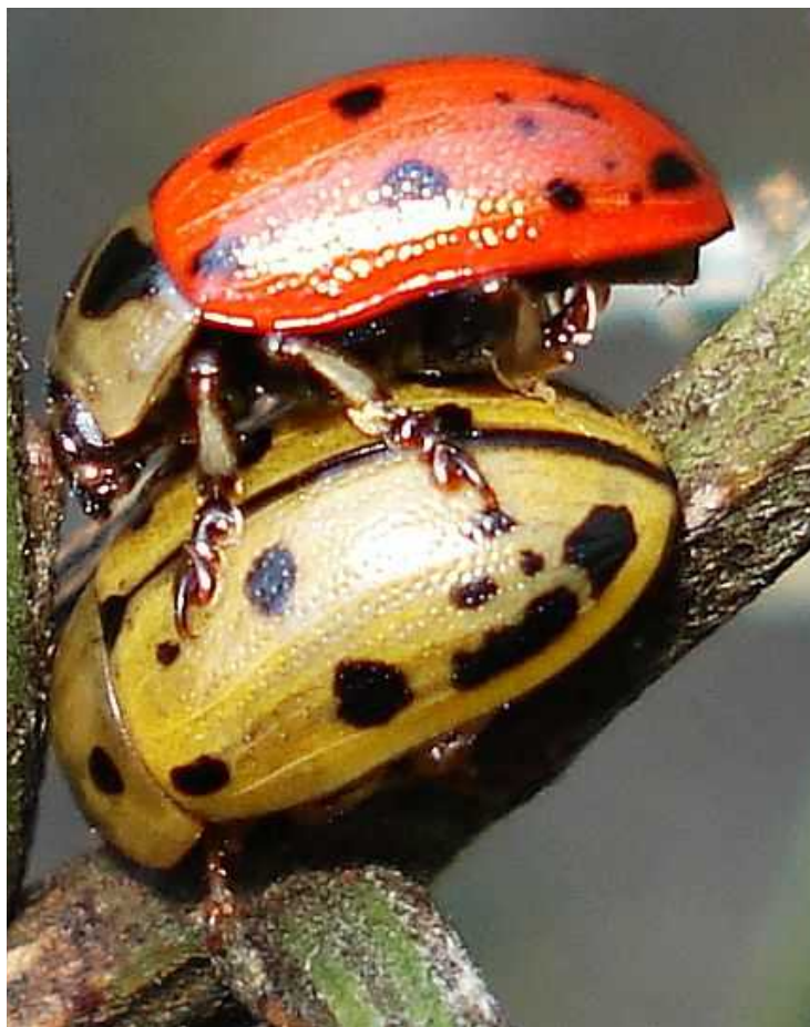
Goniocetena variabilis macho y hembra