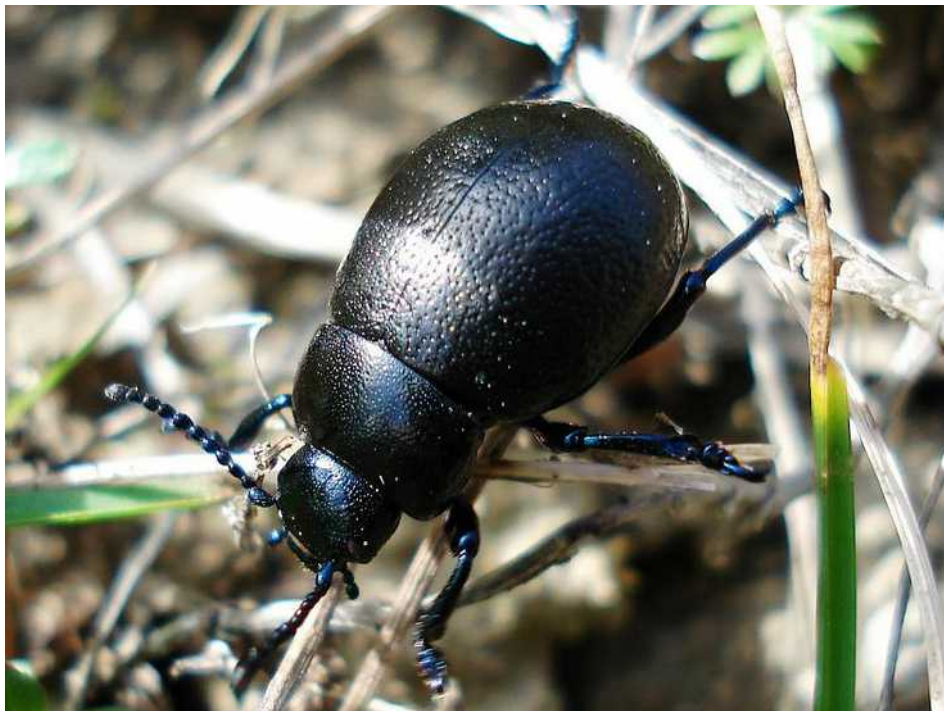
Timarcha cf. cyanescens arriba: hembra - macho abajo: hembra azul

Timarcha cyanescens – Mide de 8,5 a 12 mm de longitud. Color negro brillante, a veces con brillo metálico azul o verde. Élitros con puntos y arrugas muy aparentes. El macho es más pequeño que la hembra y posee los tarsos muy dilatados. Carece de alas, al tener los élitros soldados y camina a poca velocidad por los caminos. El último artejo de los palpos es muy grueso. Adulto y larva se alimentan de Galium . En caso de peligro segrega un líquido rojo por la boca, desagradable para los depredadores. La larva es de color oscuro y brillo metálico.