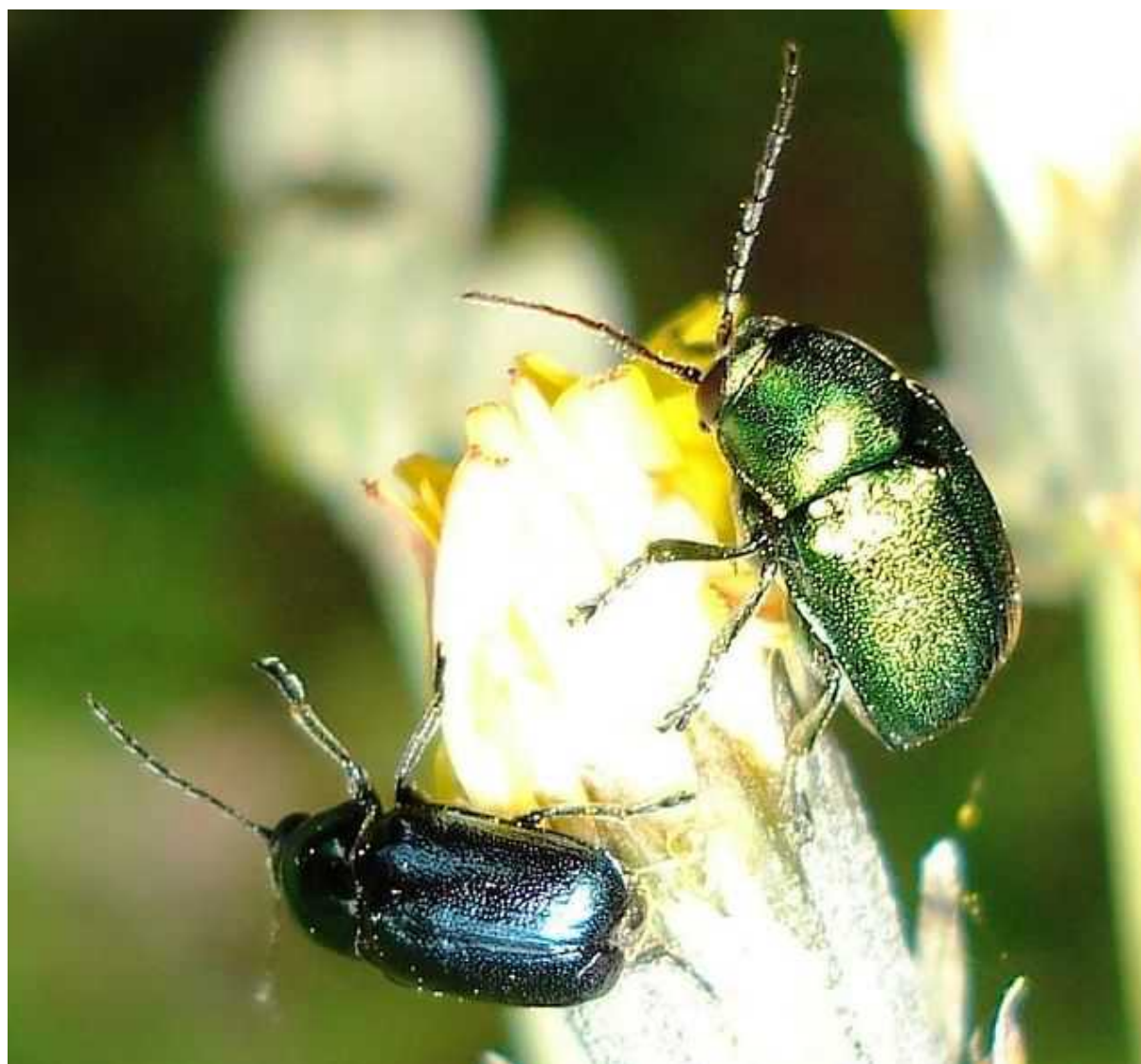
Cryptocephalus cf. hypochaeridis dos variantes

Cryptocephalus hypochaeridis – Mide de 4,5 a 5,7 mm de longitud. Color del cuerpo verde o azul violeta con reflejos metálicos. Pronoto con punteado fino, y escutelo ligeramente puntiagudo. El adulto se alimenta de polen de diversas flores, especialmente amarillas. Se diferencia de Cryptocephalus aureolus y C. violaceus en su menor tamaño y en la presencia de puntos elitrales finos y bien alineados.