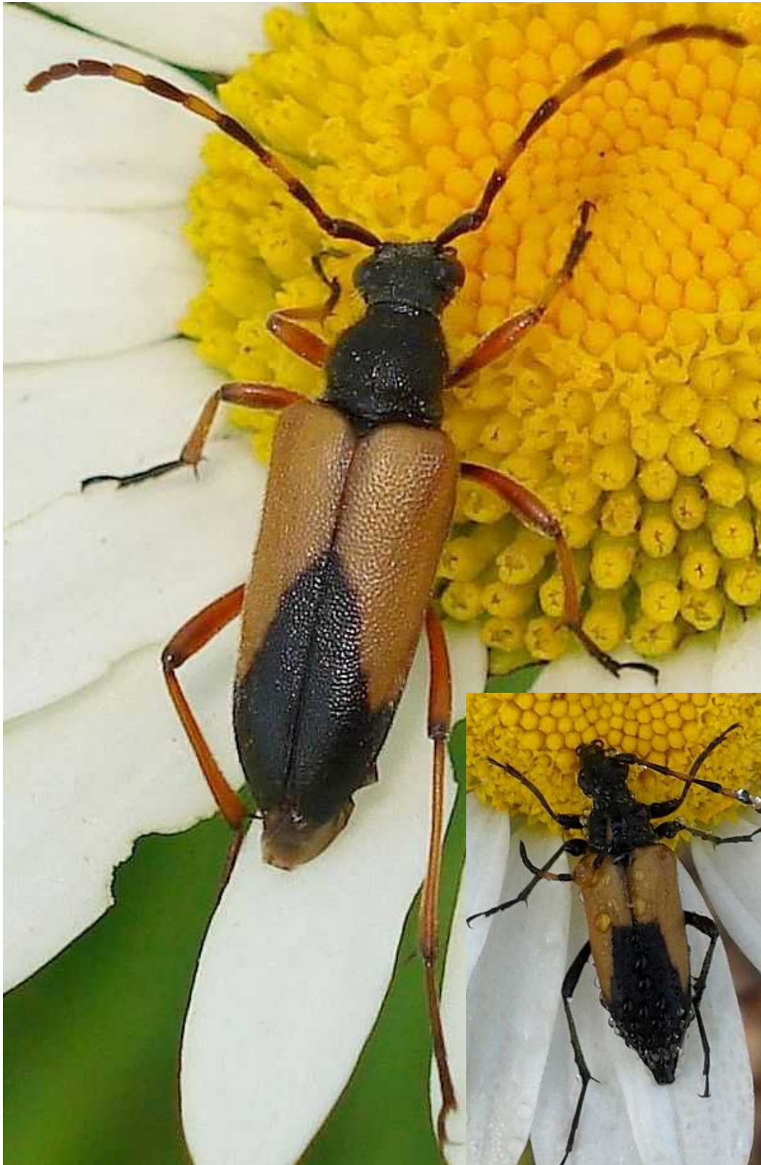
Paracorymbia = Stictoleptura stragulata dos variantes

Paracorymbia = Stictoleptura = Corymbia stragulata – Mide unos 15 mm de longitud. Los élitros son de color crema pálido u ocre, con una mancha negra rectangular en la mitad posterior, muy variable en su longitud y forma, llegando a ser tan extensa en algunos ejemplares que los élitros son casi totalmente negros excepto la zona delantera central. Los artejos de las antenas son claros y oscuros intercalados. El adulto es florícola, alimentándose de néctar y polen. La larva se desarrolla en la madera muerta de pinos.