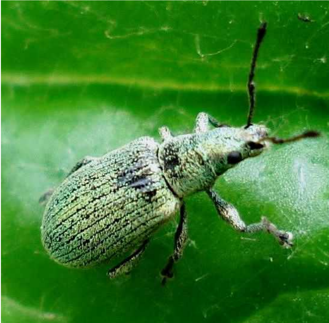
Phyllobius cf. roboretanus