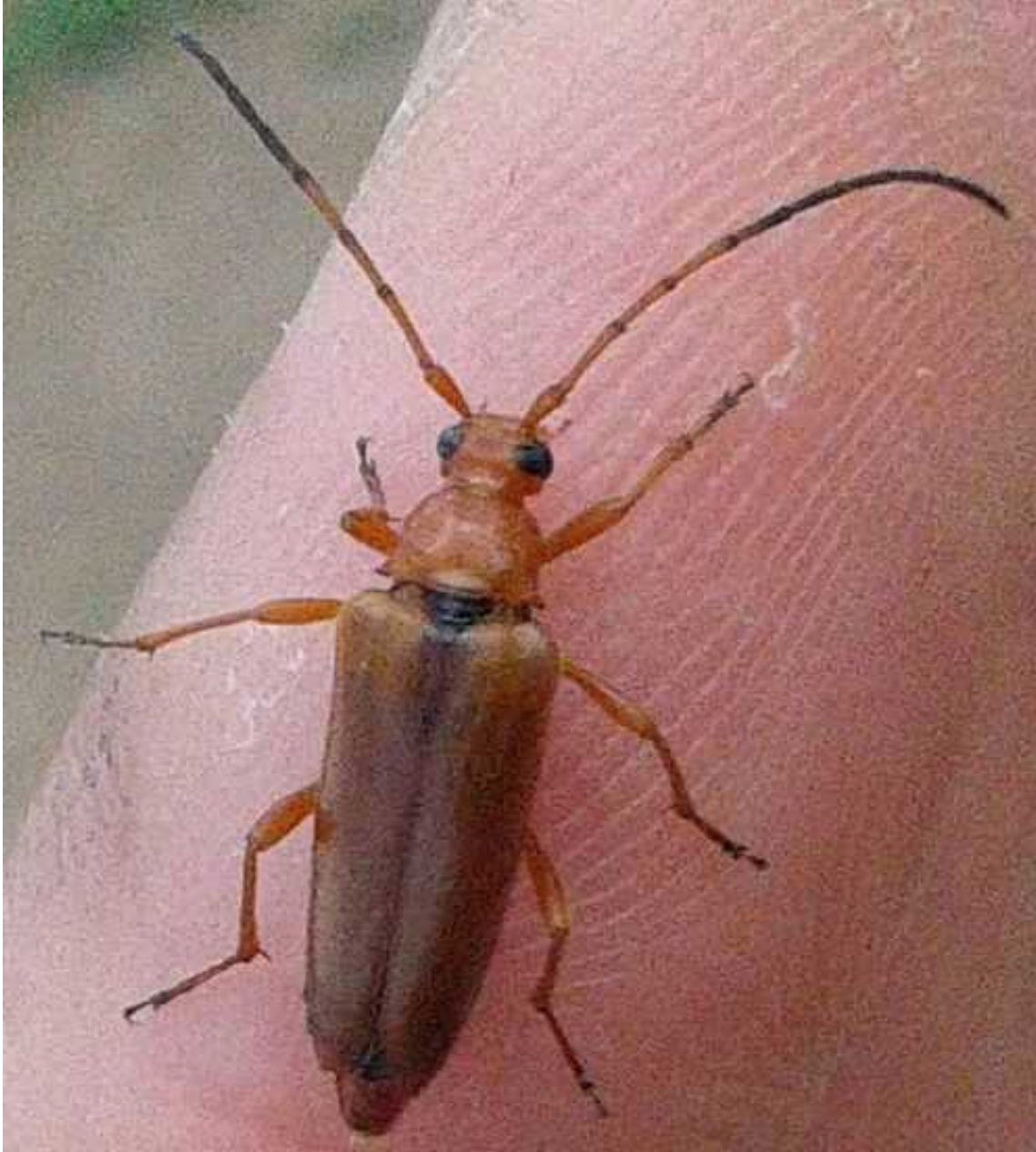
Pedostrangalia revestita hembra

Pedostrangalia revestita – Mide de 8 a 15 mm de longitud. El color general del cuerpo de la hembra es naranja pálido, mientras que los élitros del macho son casi negros. La larva, cuyo desarrollo dura 2 ó 3 años, se alimenta de madera muerta de árboles de hoja caduca, como robles, hayas, etc.