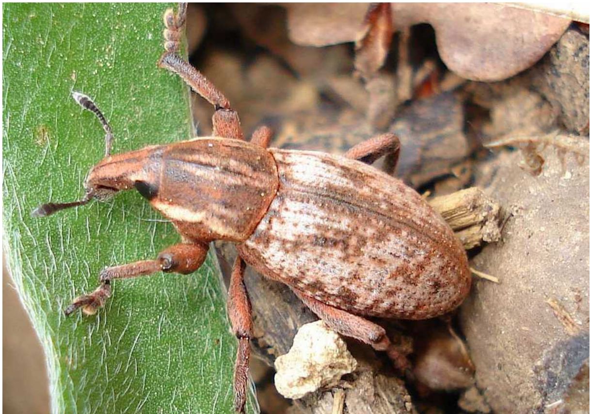
Arriba: Cleonis piger = pigra Abajo: Lixiinae no identificado

Cleonis piger = pigra – Mide de 11 a 16 mm de longitud. Color del cuerpo pardo oscuro, cubierto de vellosidad clara, cuya ausencia forma manchas de color pardo. Éstas manchas forman dos o tres grandes V oblicuas en los élitros. La larva se desarrolla en las raíces de diferentes plantas asteráceas, principalmente el cardo Cirsium arvense . El adulto hiberna y se puede encontrar durante todo el año.