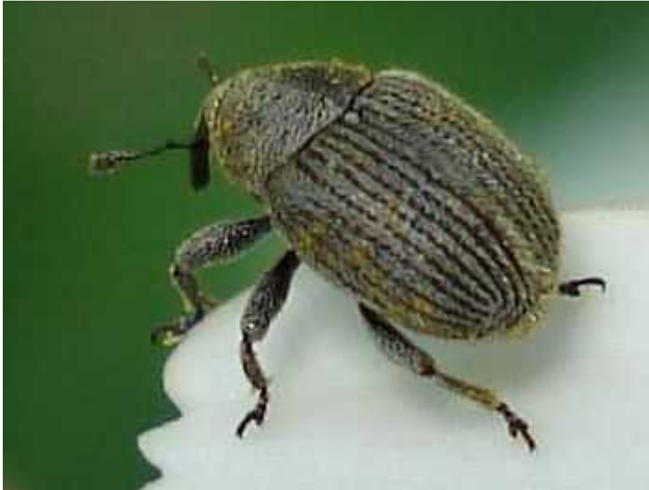
Miarus cf. campanulae

Miarus campanulae - Mide de 2,3 a 3,6 mm de longitud. Color general gris, con escamas amarillas entre las estrías de los élitros repartidas irregularmente. Vive en las flores de Campanula, Lychnis, Cerastium, Phyteuma, Asyneuma , etc.