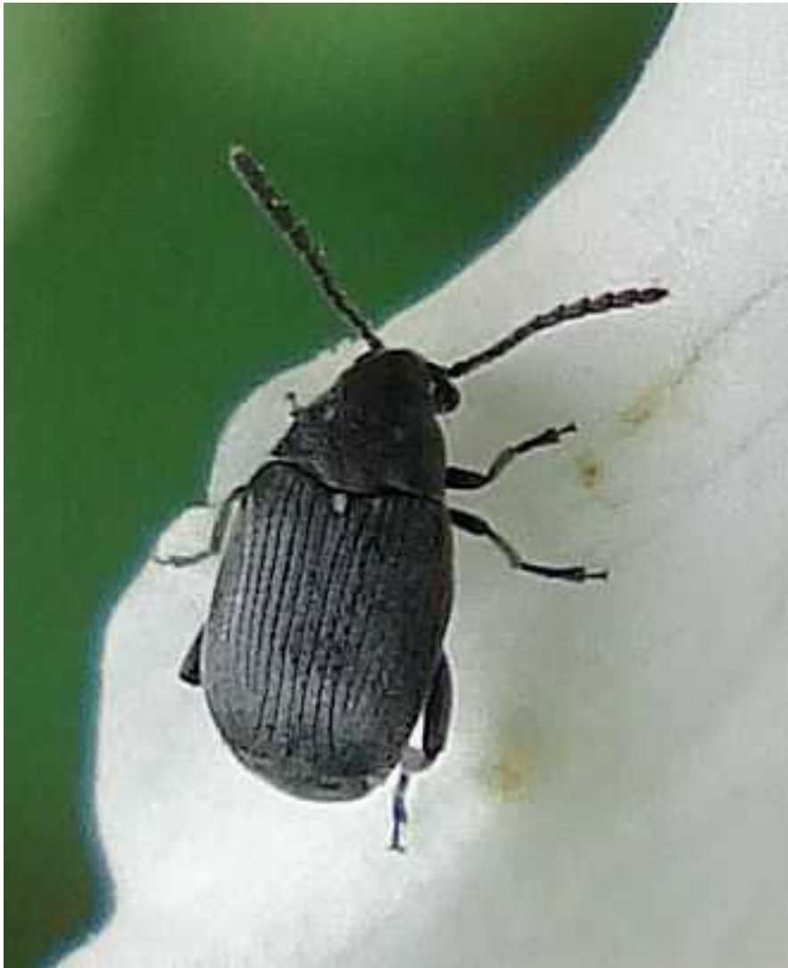
Bruchidius cf. villosus

Bruchidius villosus - Mide de 1,7 a 3,5 mm de longitud. Color gris oscuro uniforme, con líneas elitrales muy marcadas y regulares. Pronoto más triangular que Bruchus . Antenas del color del cuerpo, engrosando progresivamente hacia la punta. Las patas son del color del cuerpo. El adulto se alimenta de polen de las flores, mientras la larva roe semillas de plantas Fabaceae .