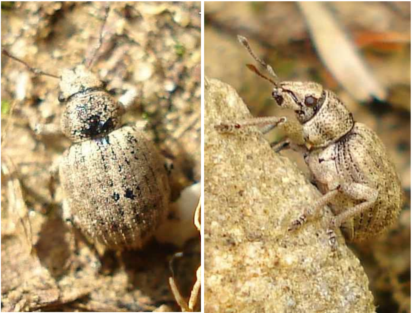
Strophosoma cf. melanogrammum hembra

Strophosoma melanogrammum - Mide de 4 a 6 mm de longitud. Color general entre beige y pardo claro, con franjas pardas longitudinales algo más oscuras en el tórax y los élitros. El cuerpo de la hembra es algo más ancho que el del macho, especialmente a la altura de los élitros. Las escamas que recubren el cuerpo suelen perderse con la edad, especialmente el el dorso, al comienzo de los élitros, por lo que muchos ejemplares presentan una ancha línea negra que ocupa la primera mitad del dorso elitral. Rostro ancho y corto, característico del género, con los ojos que sobresalen de la cabeza hacia los lados. Se alimenta de gran variedad de plantas, desde árboles como Corylus y Prunus , arbustos como Cytissus y herbáceas como Carex , Agrostis , Festuca , Geranium , Erodium , etc.