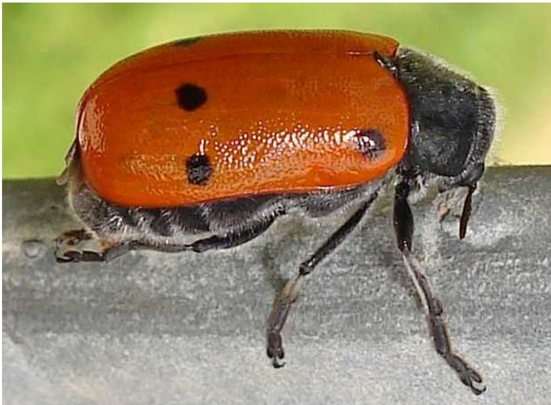
Lachnaia cf. pubescens dos ejemplares

Lachnaia pubescens – Mide de 8 a 13 mm de longitud. El tercer artejo de las patas anteriores tiene forma triangular. Cabeza y tórax negros, cubiertos de pilosidad blanca. Los élitros, de color naranja o rojizo, presentan tres puntos negros, uno en la región humeral y dos, de tamaño similar, en la mitad posterior. Los tarsos de las patas delanteras del macho son mucho más anchos y largos que los de la hembra. Existe una especie muy similar: Lachnaia paradoxa , con el aserrado de los artejos antenales que comienza en el quinto artejo, en vez del cuarto. El adulto es políforo, alimentándose de brotes y hojas de todo tipo de árboles y plantas herbáceas. La larva, forrada con un estuche protector, vive en los hormigueros alimentándose de larvas de hormiga y desechos.