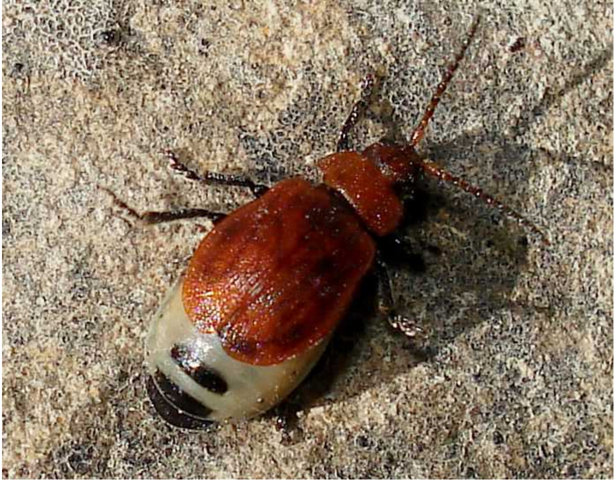
Galeruca = Emarhopa rufa hembra

Galeruca = Emarhopa rufa – Mide de 4,5 a 6 mm de longitud. Color del cuerpo naranja rojizo. Se alimenta de diversas plantas, entre ellas Convolvulus arvensis y C. sepium .