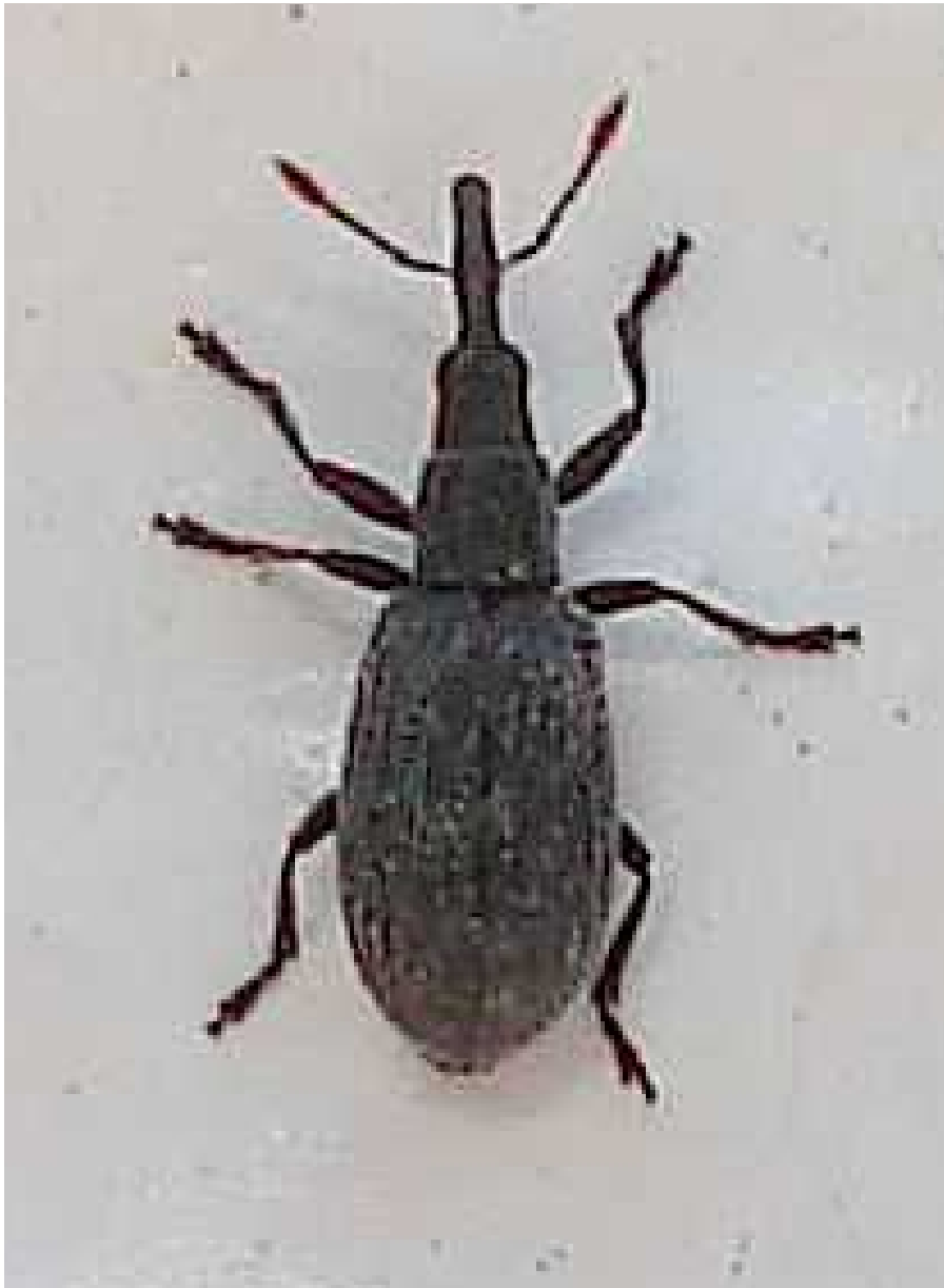
Stenopterapion cf. tenue

Stenopterapion tenue – Mide de 1,6 a 2,3 mm de longitud. Color general gris oscuro. Cabeza alargada en la zona de las mejillas. Vive sobre diversas leguminosas.