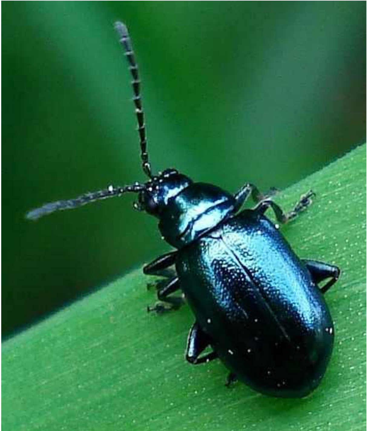
Altica = Haltica cf. oleracea

Altica = Haltica oleracea – Mide de 2 a 4,7 mm de longitud. El cuerpo es aplanado y alargado, de color azul o verde metálicos. Los machos son algo más alargados y azulados que las hembras. Las antenas son negras y alargadas, con 11 artejos, y están cubiertas de pubescencia blanquecina, al igual que las patas. Tanto la larva como el adulto se alimentan de hojas de Rumex , Polygonum , Epilobium , Oenothera , Erica , Calluna , Quercus , Oenothera , Rubus , etc. Los adultos, además, pueden alimentarse de Fragaria , Potentilla , Sanguisorba , Gratiola o Godetia . Existen varias generaciones al año.