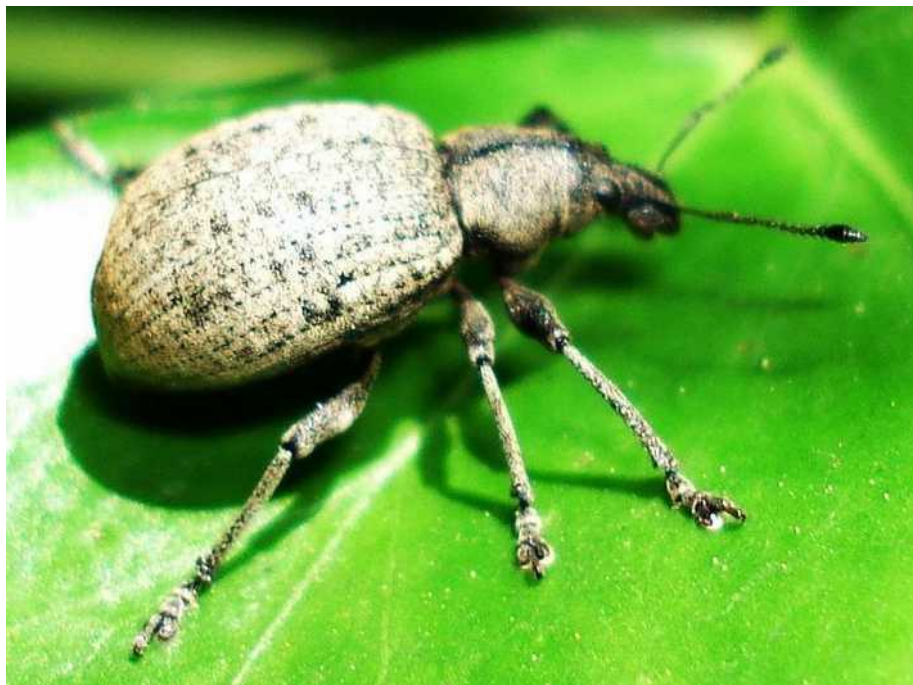
Liophloeus tessulatus dos ejemplares

Liophloeus tessulatus – Mide de 8 a 15 mm de longitud. Color general pardo grisáceo claro, con dibujos en damero formados por escamas de color claro y oscuro en los élitros. La larva vive bajo tierra y se alimenta de las raíces de diversas plantas silvestres y cultivadas, como la berza, apiáceas, etc. El adulto se alimenta de la hiedra Hedera helix . En ciertas condiciones las hembras son capaces de reproducirse por partenogénesis, sin intervención de los machos.