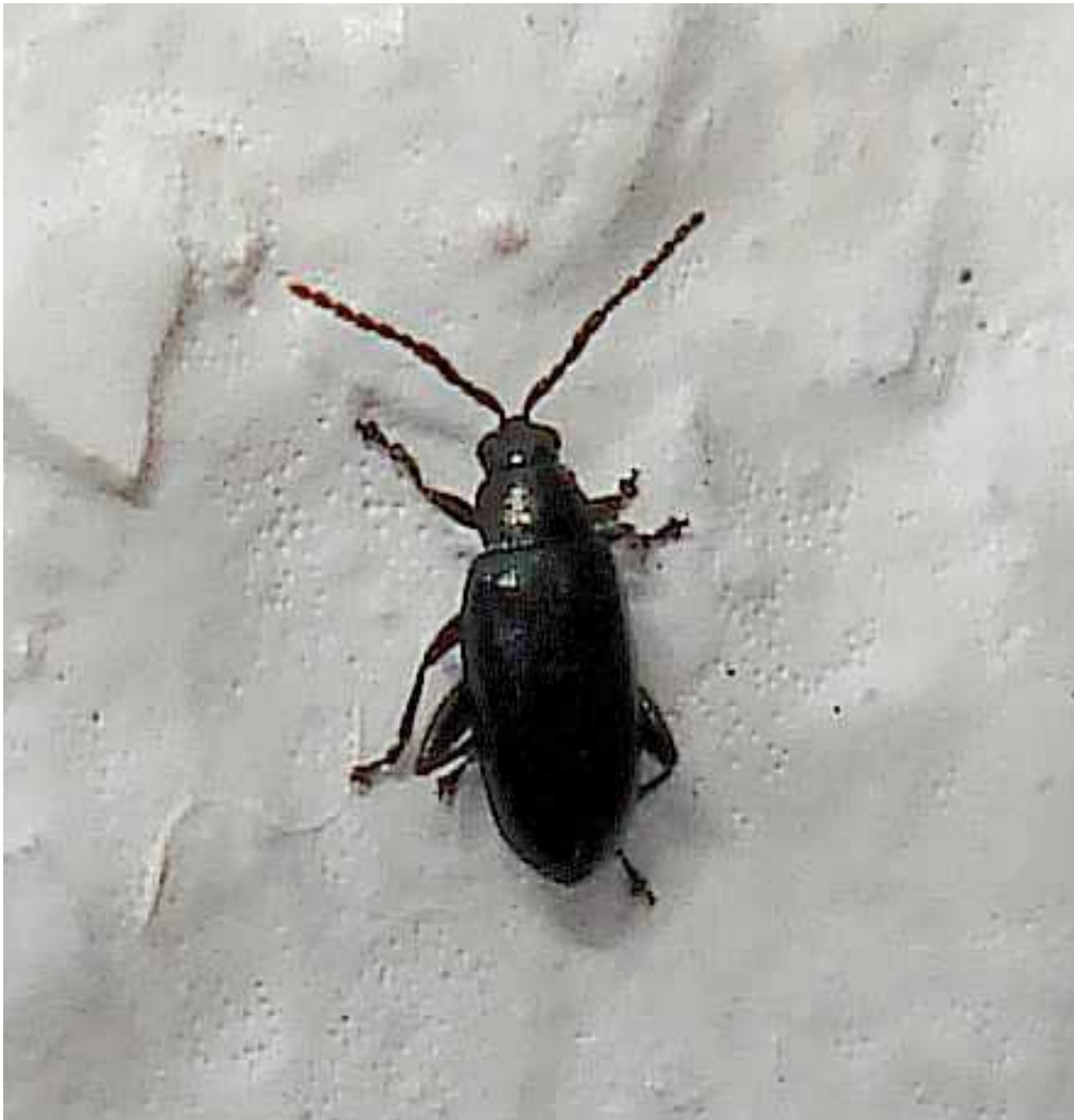
Phyllotreta cf. atra

Phyllotreta atra – Mide de 1,7 a 2,5 mm de longitud. Color totalmente negro, excepto el segundo y tercer artejos antenales que son amarillentos. El pronoto se estrecha bastante en la zona de unión con los élitros, lo que le diferencia de Phyllotreta cruciferae , que lo tiene más ancho en la parte posterior. Se alimenta de diversas Brasicáceas o Crucíferas, de las hojas el adulto y de las raíces la larva. El adulto hiberna escondido en el suelo.