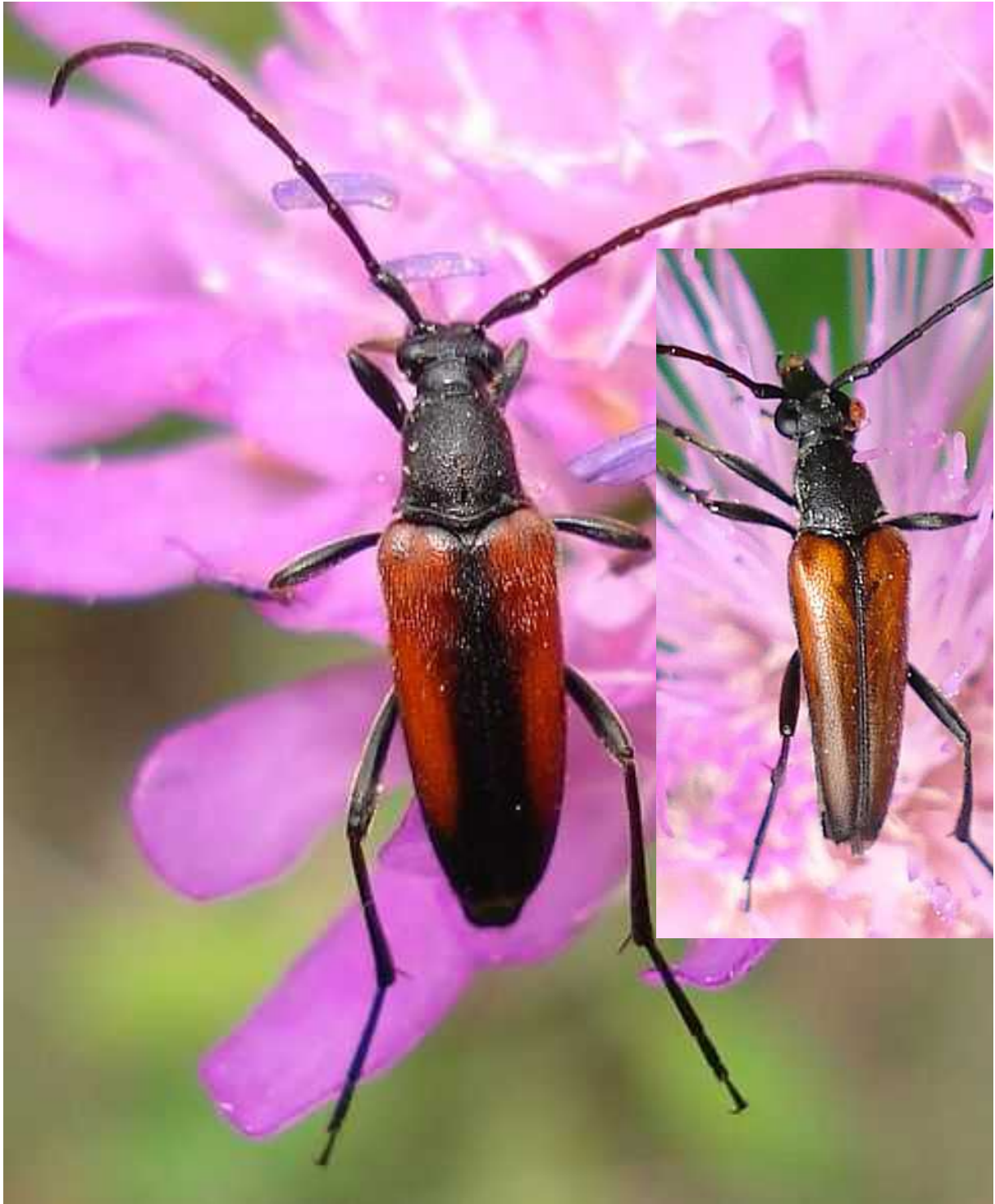
Stenurella = Leptura = Strangalia melanura izda: hembra; dcha: macho

Stenurella = Leptura = Strangalia melanura – Mide de 6 a 10 mm de longitud. Cuerpo alargado, con antenas aproximadamente de la longitud del cuerpo. La cabeza, pronoto y patas son negro mate. Los élitros son de color castaño amarillento en el macho. En cambio, en la hembra, son más rojizos y tienen las suturas elitrales y la parte posterior negra. El adulto es florícola, alimentándose de polen y néctar. La larva se alimenta de madera muerta tanto de coníferas como caducifolios, especialmente castaños.