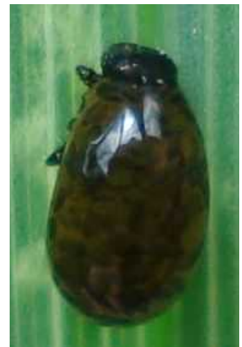
Oulema = Lema cf. melanopus adulto y larva

Oulema melanopus – Mide de 4 a 5 mm de longitud, siendo la hembra algo más grande que el macho. La cabeza es negra azulada metálica, con una profunda escotadura transversal entre los ojos. Las antenas son negras y filiformes. Pronoto naranja metálico, sin bordes laterales, y con los rebordes anterior y posterior negros. Patas de color amarillo anaranjado, con los tarsos negruzcos. Élitros de color azul/ verde metálico oscuro, con diez líneas longitudinales de puntos. El adulto y la larva, de aspecto de pequeña babosa amarillenta, se alimentan de hojas de cereales, principalmente trigo, cebada y avena, aunque también atacan otras especies de gramíneas salvajes. Una generación anual: el adulto nace en otoño e hiberna, reproduciéndose la siguiente primavera. Existen varias especies del grupo Oulema melanopus muy similares: Oulema duftchsmidi , O. rufocyanea , O. mauroi , O. verae , etc.