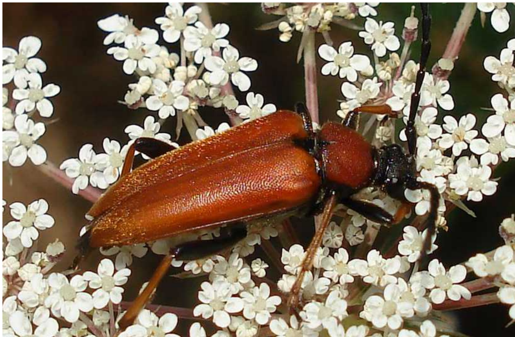
Stictoleptura rubra arriba: macho ; abajo: hembra

Stictoleptura = Corymbia rubra – Mide de 10 a 20 mm de longitud. La hembra posee el pronoto y los élitros rojo naranjas, mientras el macho tiene el pronoto negro y los élitros de color ocre pálido. Los fémures de ambos sexos son negros, mientras el resto de las patas son amarillentas en el macho y naranjas en la hembra. El adulto es florícola, alimentándose de néctar y polen. La larva se desarrolla en la madera muerta de coníferas diversas.