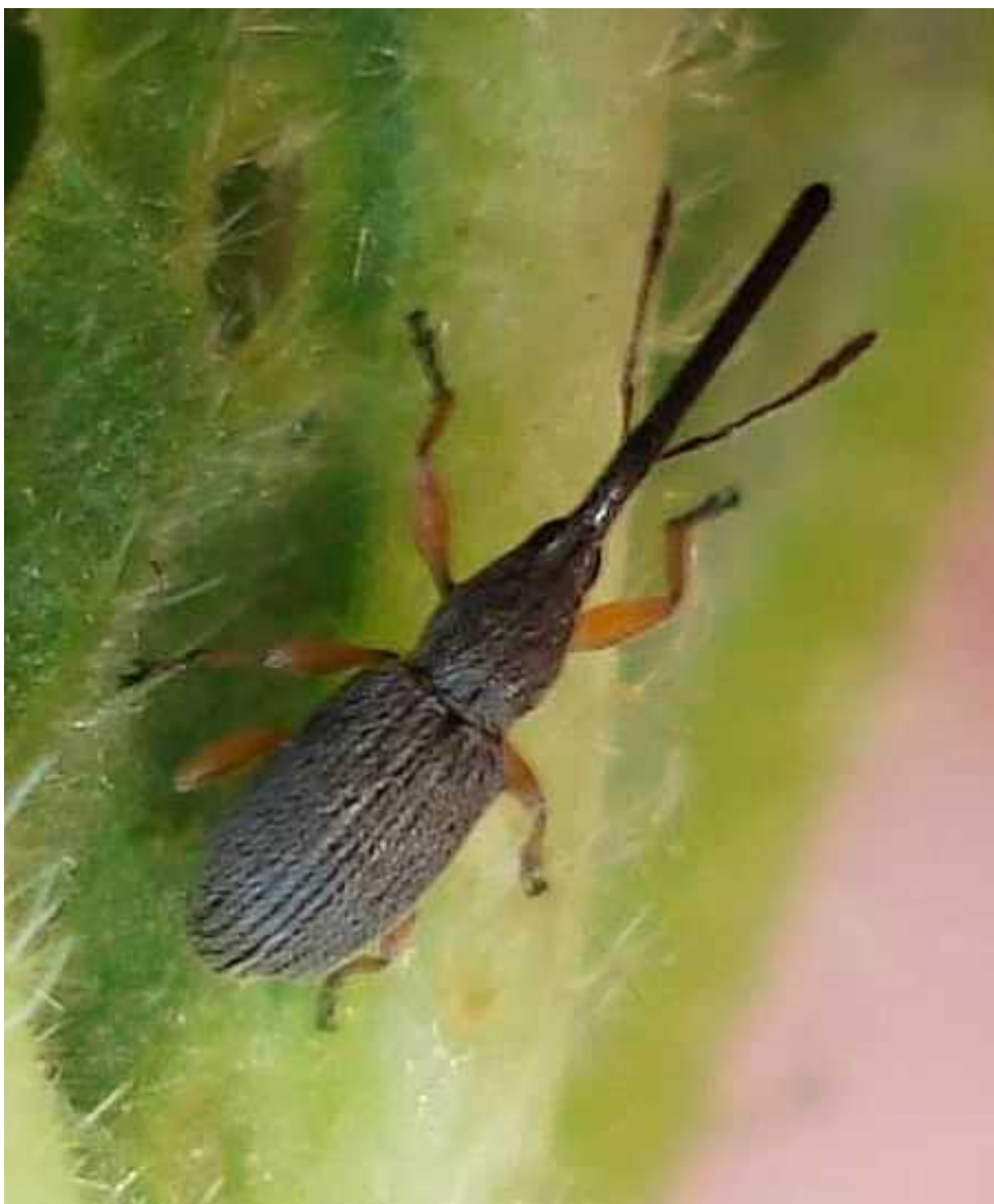
Rhopalapion longirostre hembra

Rhopalapion longirostre – Mide de 2 a 4 mm sin el rostro, que es muy largo, especialmente en la hembra. Cuerpo recubierto de denso pelo de color gris claro. Patas de color pardo amarillento. El adulto se alimenta de las hojas y la larva de la semilla de la malva ( Alcea rosea ).