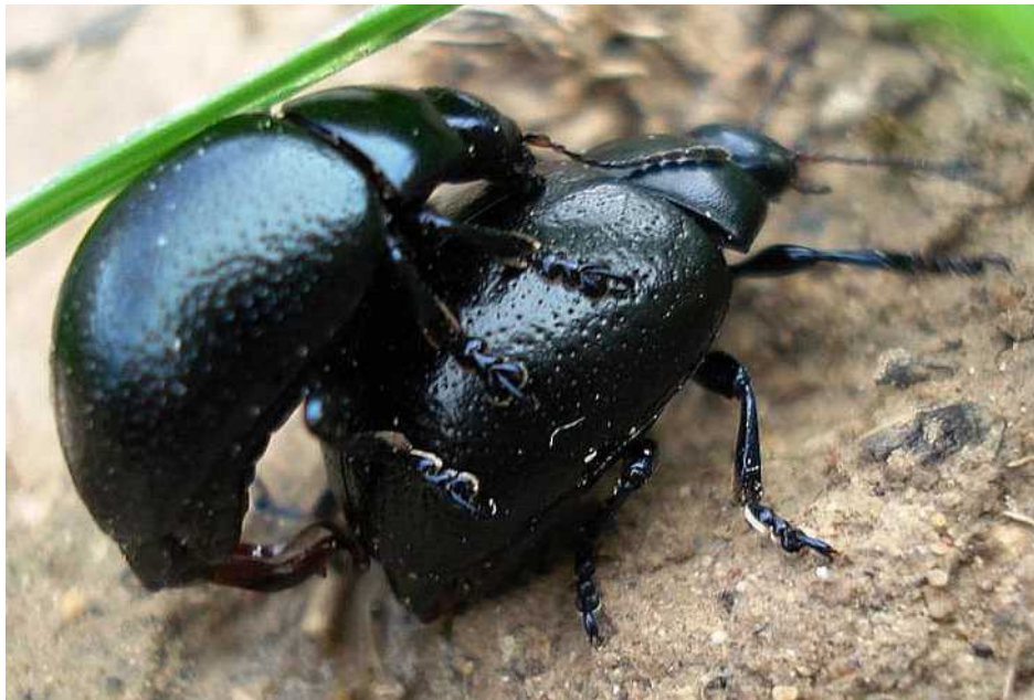
Chrysolina cf. haemoptera varios ejemplares

Chrysolina haemoptera = Chrysochroa tristis – Mide de 9 a 12 mm de longitud. Cuerpo alargado y ligeramente globuloso, de color azul oscuro con reflejos metálicos. Los élitros presentan una puntuación densa y muy irregular. Alimentación polífaga, principalmente Compuestas como Adenostyles , Senecio y Centaurea .