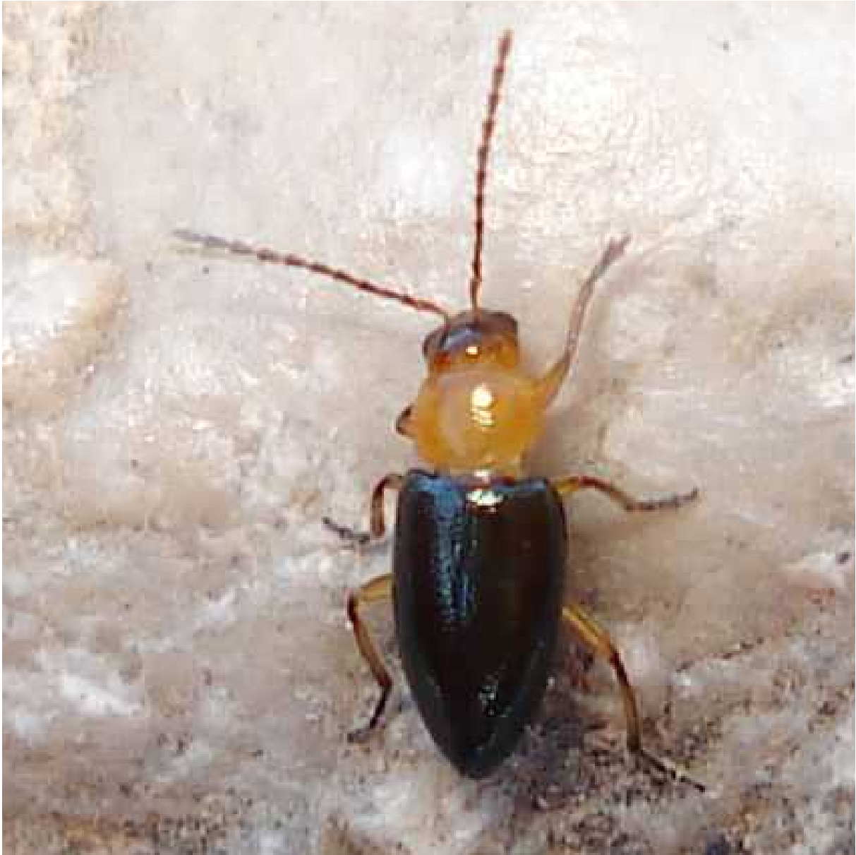
Leptomona cf. erythrocephala

Leptomona erythrocephala - Mide de 2,8 a 3,6 mm de longitud. La cabeza y el tórax son de color amarillo o naranja, generalmente con una zona más oscura detrás de la cabeza. Las antenas son largas y finas, con un primer artejo largo y curvado hacia afuera. Los élitros están claramente punteados y tienen color verde oscuro metálico. Las patas son del color del tórax, es decir, amarillas o naranjas. Vive en bosques caducifolios, setos y matorrales. El adulto y la larva se alimentan de los márgenes de las hojas y de los pétalos de Potentilla reptans , Fragaria , Polygonum , Rumex y Lotus corniculatus .