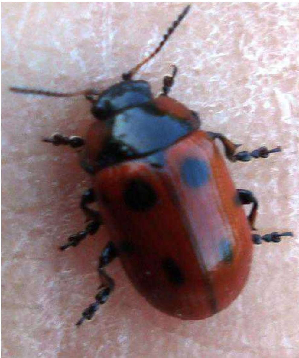
Gonioctena = Phytodecta viminalis

Gonioctena = Phytodecta viminalis - Mide de 5 a 8 mm de longitud. Color de fondo amarillento o naranja, con un patrón extremadamente variable de manchas negras en el tórax y los élitros (de 2 a 5 en éstos últimos). Algunos ejemplares pueden ser totalmente amarillos o totalmente negros. Cabeza negra brillante, con la mitad anterior de los artejos rojiza y la mitad posterior negra. Patas negruzcas, a veces con algo de rojo en las tibias. La larva y el adulto se alimentan de hojas de diversos sauces ( Salix ) y Populus .