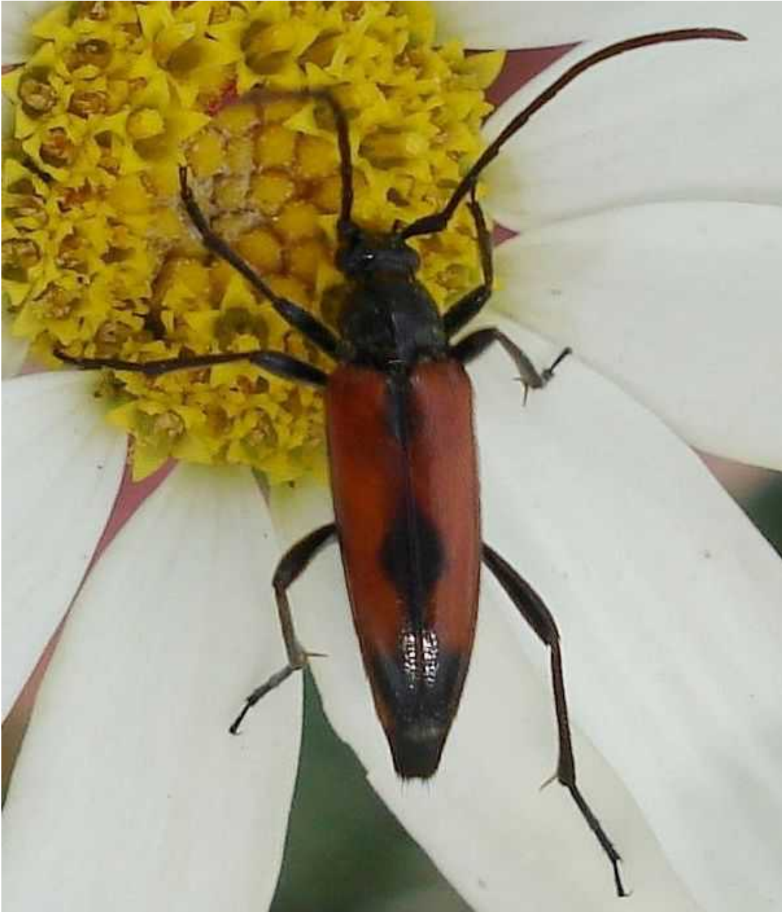
Stenurella bifasciata hembra

Stenurella bifasciata - Mide de 6 a 10 mm de longitud. La cabeza y el tórax son de color negro. Las antenas, también negras, son algo más largas en el macho. Los élitros son de color pardo amarillento en el macho y pardo rojizo en la hembra, y los de ésta última presentan la parte terminal negra, además de una mancha negra en la parte central en forma de rombo, que a veces se ensancha hacia los laterales. El abdomen es de color rojo. El adulto visita las flores de umbelíferas y compuestas, en terrenos cálidos y floridos cercanos a los bosques. La larva es muy polífaga y se desarrolla en la madera de árboles caducifolios y coníferas, e incluso en herbáceas.