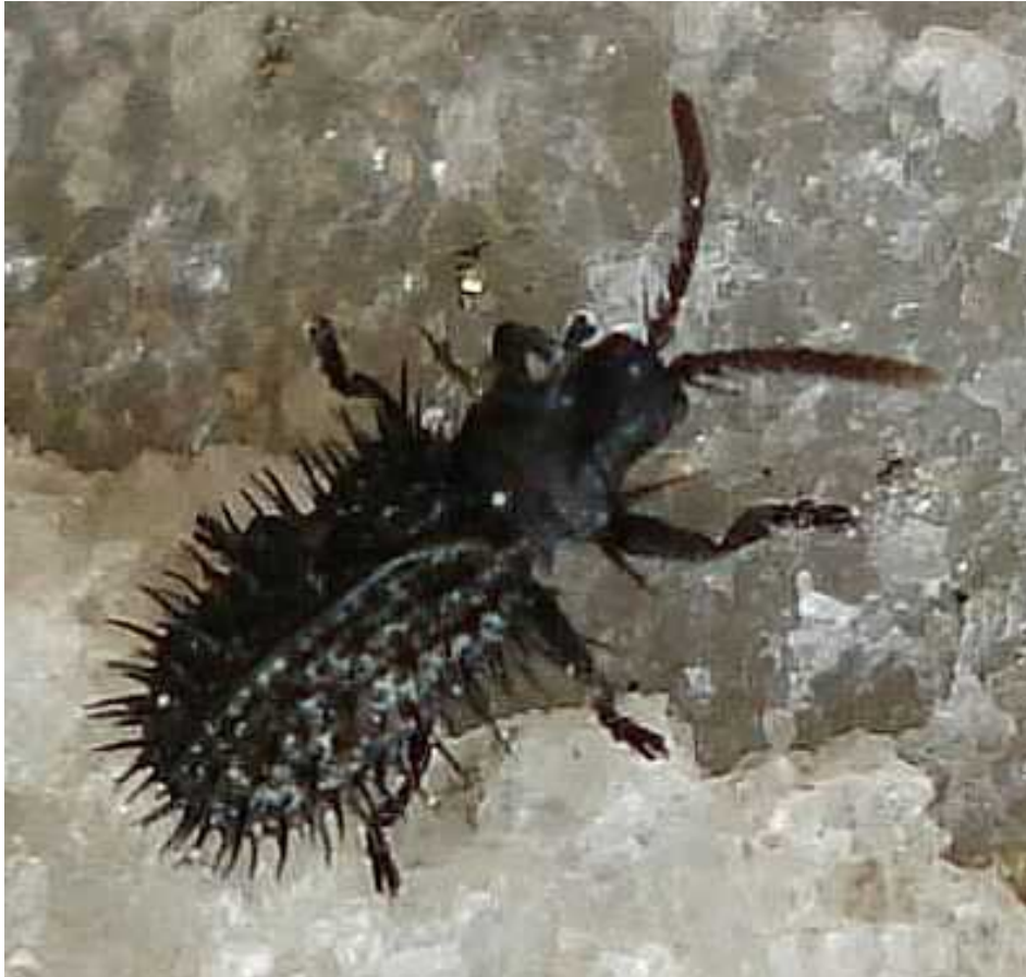
Hispa = Hispella atra