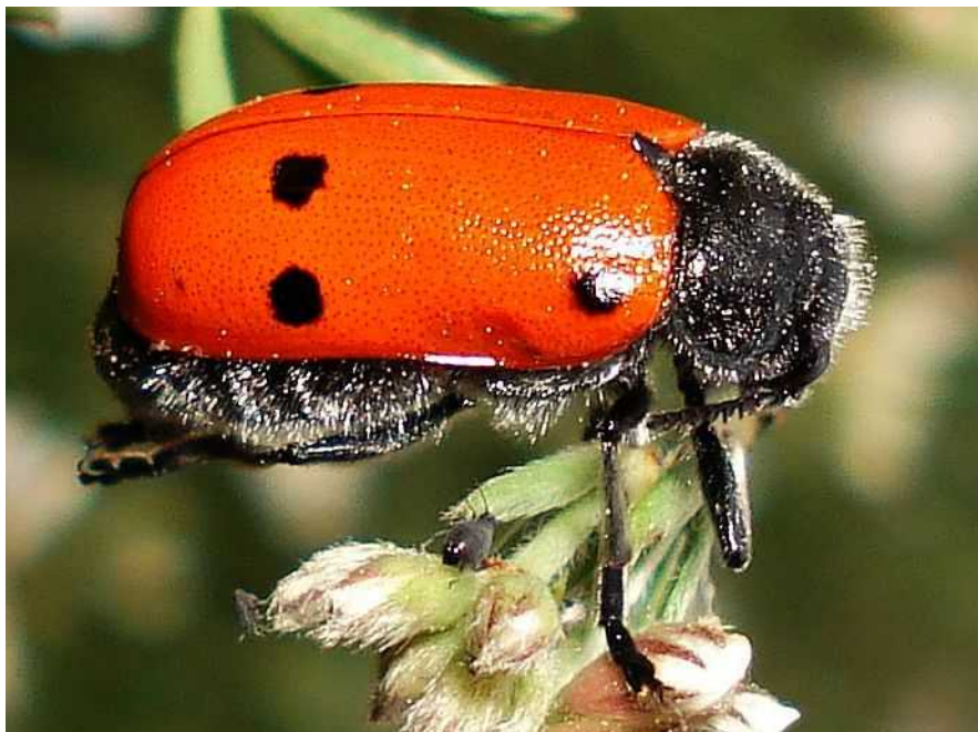
Lachnaia cf. paradoxa = vicina

Lachnaia paradoxa = vicina – Mide de 6 a 12 mm de longitud. Es muy similar en su aspecto a L. pubescens . Tercer artejo de las patas anteriores en forma de corazón, lo que le distingue de L. pubescens , que lo tiene más o menos triangular. Además en L. paradoxa el aserrado de los artejos antenales empieza en el 5° artejo, y en L. pubescens comienza en el cuarto. El adulto es polífago, alimentándose de brotes y hojas de todo tipo de árboles y plantas herbáceas. La larva, forrada con un estuche protector, vive en los hormigueros alimentándose de larvas de hormiga y desechos.