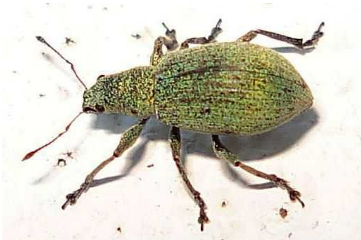
Polydrusus cf. planifrons = prasinus

Polydrusus planifrons = prasinus – Mide de 4 a 7 mm de longitud. Color del cuerpo verde claro más o menos vivo, debido a las escamas que lo recubren. Donde se pierden las escamas el color que queda es gris oscuro. Las hendiduras antenales del rostro están dirigidas hacia abajo, hasta la parte inferior del ojo. Las patas son del color del cuerpo, ya que están recubiertas de las mismas escamas verdes, aunque se van perdiendo con la edad.. El adulto se alimenta de hojas y brotes de robles, hayas, alisos y sauces, y la larva de sus raíces, por lo que se le considera una plaga.