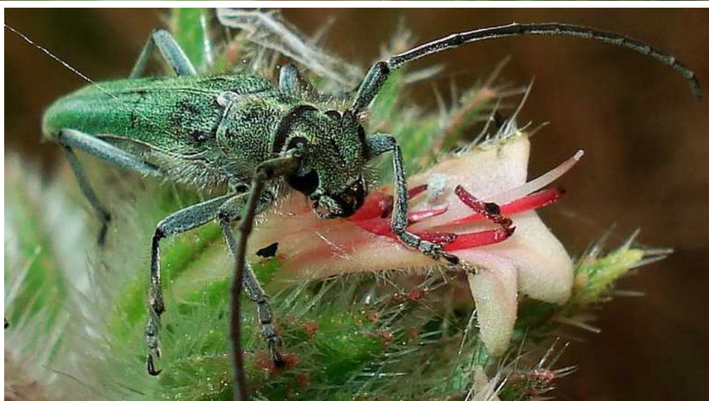
Opsilia = Phytoecia coerulescens

Opsilia = Phytoecia coerulescens – Mide de 6 a 13 mm de longitud. Color del cuerpo verde grisáceo, con anchas bandas longitudinales más oscuras en el pronoto. La larva se alimenta de las raíces de gran variedad de plantas, principalmente de Echium .