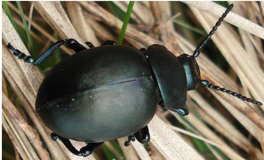
Timarcha tenebricosa arriba: hembra - macho; abajo: hembra

Timarcha tenebricosa – Mide de 11 a 18 mm de longitud. Color negro con reflejos metálicos azulados o verdosos. El punteado del tórax y los élitros es muy fino. La parte anterior del tórax es muy ancha, especialmente en el macho. Éste tiene un tamaño menor que la hembra y posee los tarsos dilatados. Carece de alas, al tener los élitros soldados, y camina a poca velocidad por los caminos. Adulto y larva se alimentan de Galium , Cynara y Plantago . En caso de peligro segrega un líquido rojo por la boca, desagradable para los depredadores. La larva es de color oscuro y brillo metálico.