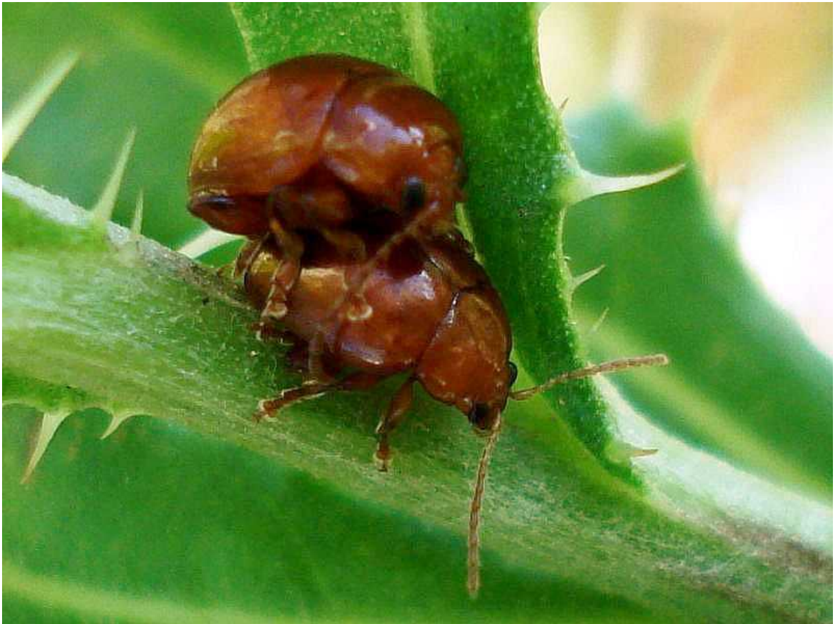
Sphaeroderma cf. rubidum / testaceum varios ejemplares

Sphaeroderma rubidum – Mide de 3 a 4 mm de longitud. Cuerpo muy oval y convexo, de color naranja rojizo brillante. Es muy similar a Sphaeroderma testaceum , pero éste último tiene punteaduras en el pronoto de las que carece S. rubidum . Se alimenta de diversas plantas compuestas, como Cirsium , Centaurea , etc, así como de la planta de alcachofa: el adulto muerde la hoja y la larva roe el parénquima.