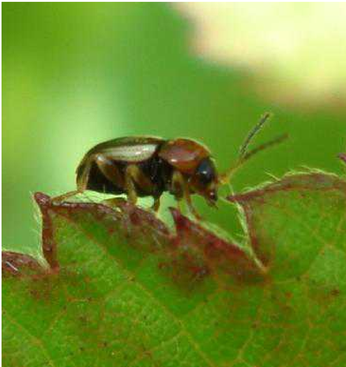
Cryptocephalus blandulus = pulchellus

Cryptocephalus blandulus = pulchellus – Mide de 2 a 2,5 mm de longitud. El tórax es de color naranja o rojizo. Los élitros son negros, con dos anchas franjas dorsales de color beige, además de los márgenes laterales y trasero en dicho color. Se alimenta de Dorycnium y fabáceas de zonas húmedas..