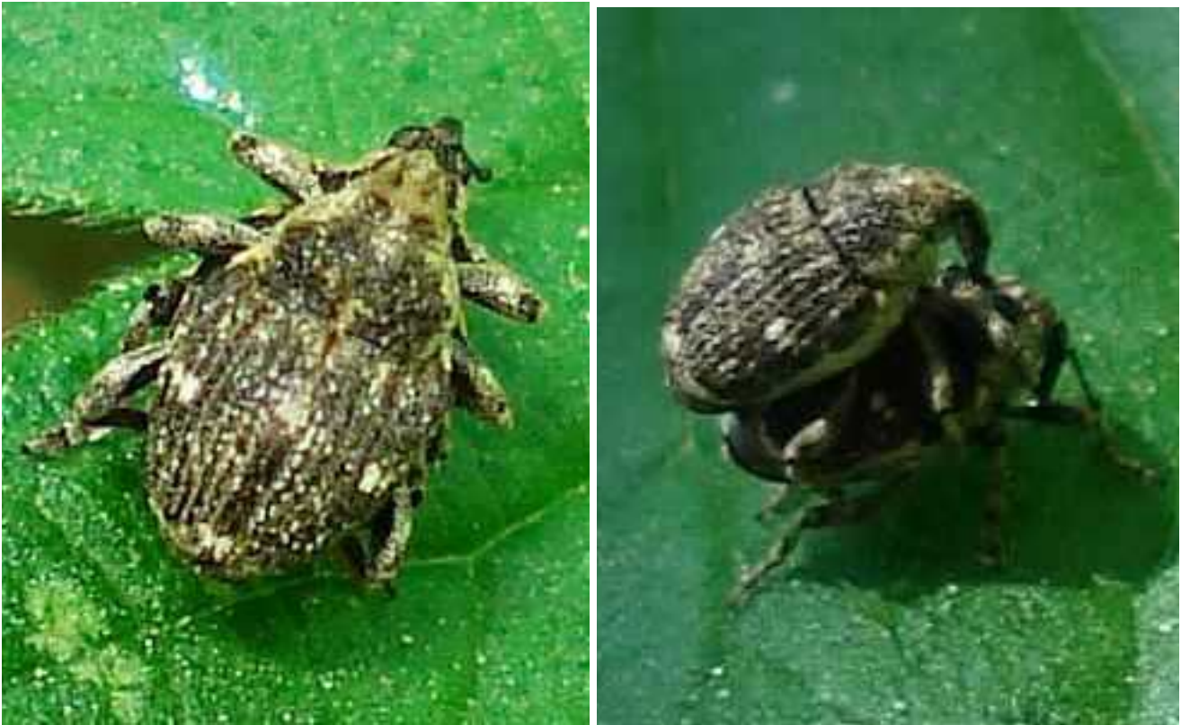
Nedyus quadrimaculatus macho y hembra

Nedyus quadrimaculatus - Mide de 2,9 a 3,2 mm de longitud. El color del cuerpo es grisáceo o gris amarillento, con los laterales de tórax algo más claros, de color crema. Los élitros son más anchos en su parte anterior y se van estrechando progresivamente hacia atrás, y presentan cuatro manchas escamosas blancas en cruz no siempre visibles: dos en la parte central, una a cada lado de los élitros, otra en el centro, y otra en la parte posterior de los mismos, además de una zona oscura sin escamas entre las dos manchas centrales. Rostro es largo y estrecho, curvado hacia abajo y las antenas nacen en su punto medio. El adulto se alimenta de hojas de ortigas ( Urtica sp.) mientras que la larva roe las raíces y rizomas de la ortiga.