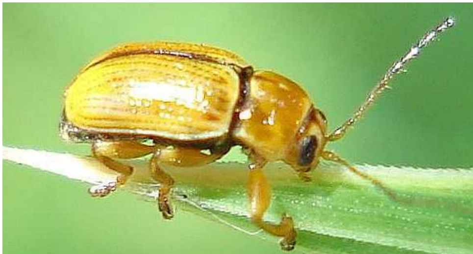
Cryptocephalus cf. fulvus macho - detalle de las líneas convergentes de éste ejemplar

Cryptocephalus fulvus - Mide de 2 a 2,8 mm de longitud. Color general ocre amarillento, con zonas más anaranjadas en el tórax. Los élitros presentan líneas de puntos muy definidos. En éste ejemplar la segunda y tercera línea (contadas desde el margen de unión de los élitros hacia el exterior), convergen hacia adelante. El cuerpo de la hembra es algo más rechoncho. Antenas amarillas hasta el sexto artejo, y se después se oscurecen en gris. Se alimenta de hojas de Achillea , Hypericum , Rumex , Trifolium , Corylus , Salix , etc, adaptándose también a otras plantas en las zonas costeras. Especies similares: C. luridicollis , C. politus , etc.