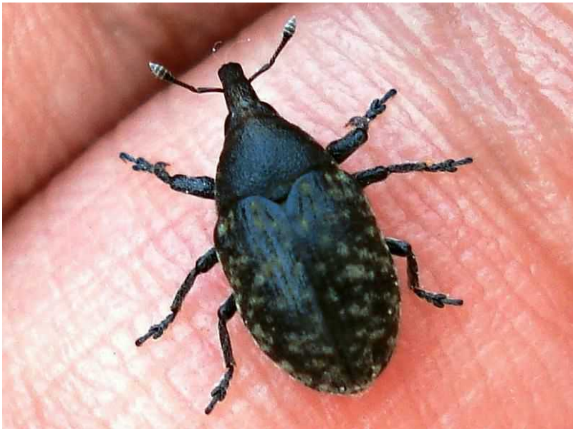
Larinus turbinatus dos ejemplares

Larinus turbinatus – Mide de 4 a 9 mm de longitud. Cuerpo de color gris oscuro salpicado de grupos de escamas amarillas, especialmente en los élitros. La hembra coloca los huevos en los brotes de cardos, de los que se alimentan las larvas.