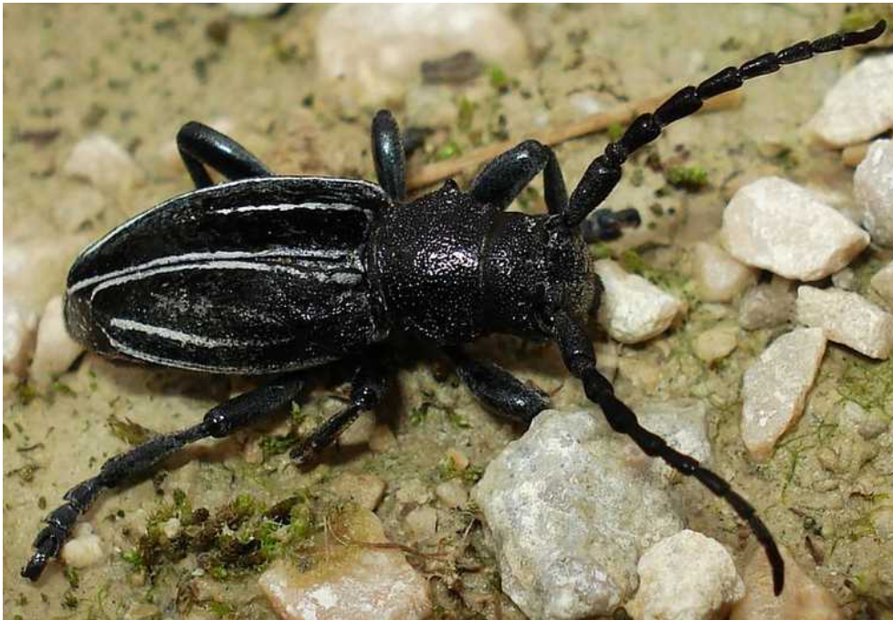
Iberodorcadion fuliginator arriba: hembra ; abajo: macho, otra variante

Iberodorcadion = Dorcadion fuliginator – Mide de 10 a 17 mm de longitud. Cuerpo fuerte y oblongo. Color general negro, con líneas longitudinales de pubescencia blanca en los élitros, que pueden tener longitud variable según los ejemplares y subespecies. El macho tiene las antenas algo más largas. Carece de alas y es corriente encontrarlo en el suelo, caminando en los senderos de montaña. La larva se alimenta de raíces de Poa y Festuca .