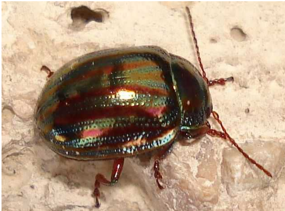
Chrysolina = Chrysomela americana

Chrysolina = Chrysomela americana – Mide de 5 a 8 mm de longitud. Cuerpo convexo, con un brillo metálico y cubierto de unas 8 líneas longitudinales de color púrpura o cobrizo sobre fondo verde azulado. Las alas son cortas, lo que impide el vuelo. Tanto el adulto como la larva se alimentan de hojas de plantas Lamiáceas aromáticas, como Rosmarinus, Thymus, Lavandula , etc. La larva es blancuzca, con 5 líneas longitudinales oscuras, y alcanza hasta 8 mm de longitud. Hiberna bajo las hojas de la planta huésped, y en primavera, al alcanzar su máximo desarrollo, se deja caer al suelo y se entierra para pupar, durante tres semanas. Es una especie nativa de Europa, a pesar de su nombre “ americana ”.