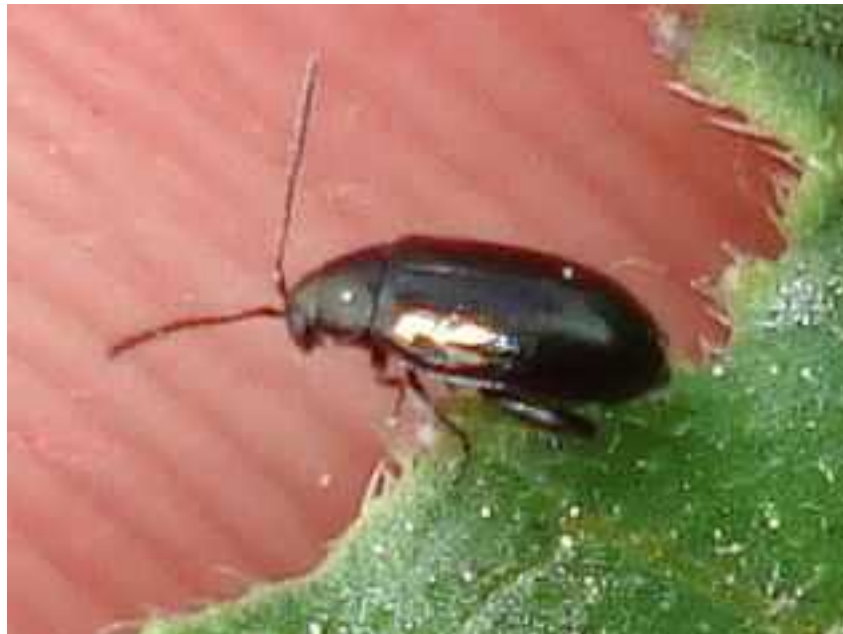
Phyllotreta cf. cruciferae

Phyllotreta cruciferae – Mide de 2 a 3 mm de longitud. Color totalmente verde o azul metálico muy oscuro, casi negro, excepto el segundo y tercer artejos antenales que son amarillentos. El pronoto se ensancha en la zona de unión con los élitros, lo que le diferencia de Phyllotreta atra , que tiene lo tiene más estrecho en la parte posterior. Los espacios entre los puntos del pronoto están claramente arrugados. Los élitros están fuertemente perforados. Se alimenta de diversas Brassicáceas o Crucíferas, de las hojas el adulto y de las raíces la larva, por lo que, en gran número, se considera una plaga de algunos cultivos. El adulto hiberna escondido en el suelo.