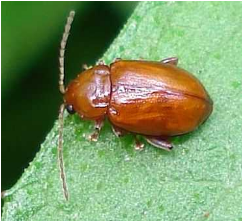
Neocrepidodera cf. transversa

Neocrepidodera = Asioresta transversa – Mide de 4 a 5 mm de longitud. Color de castaño pálido a naranja rojizo brillante. En éste último caso recuerda a Sphaeroderma , pero es más alargado y no tan ovalado. A veces es de color más oscuro, con el pronoto y zona de los élitros alrededor del escutelo negros. Se alimenta de cardos y diversas plantas Compuestas, tanto de polen como de las hojas.