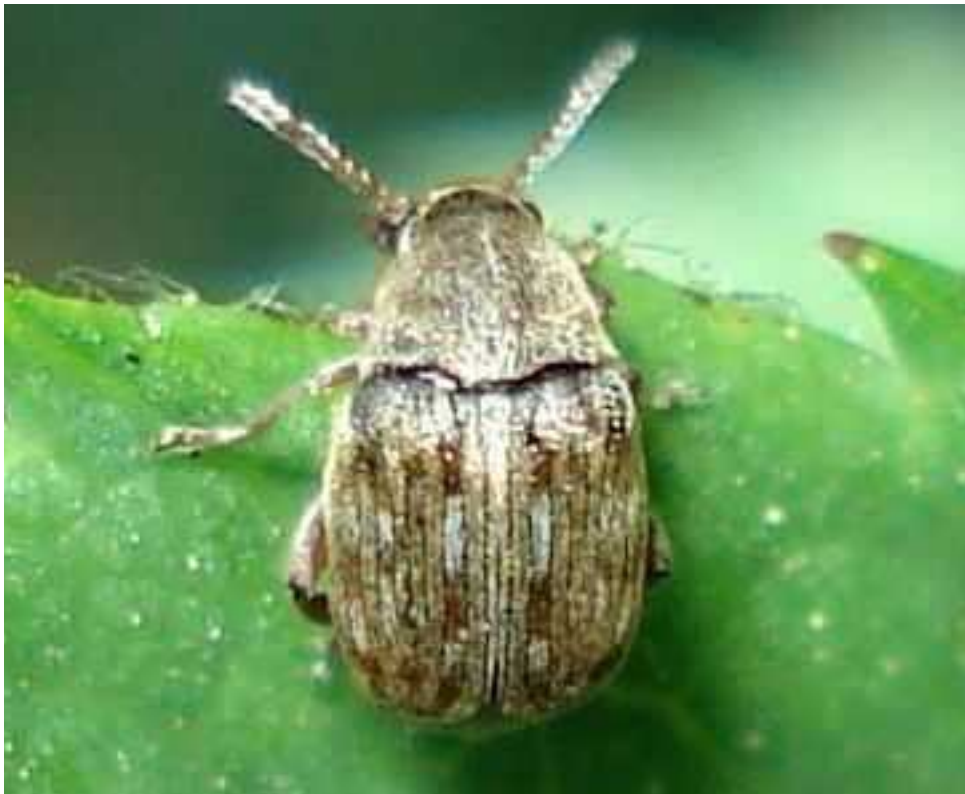
Bruchidius cf. imbricornis

Bruchidius imbricornis - Mide de 2 a 3 mm de longitud. El color general es pardo dorado claro. En las interestrías de los élitros se forman algunas franjas alternativamente de color pardo y blanquecino. Los élitros no cubren todo el abdomen, dejando a la vista la parte final abombada. Las antenas y patas son de color rojizo. Las larvas se desarrollan dentro de las semillas de diversas Fabaceae .