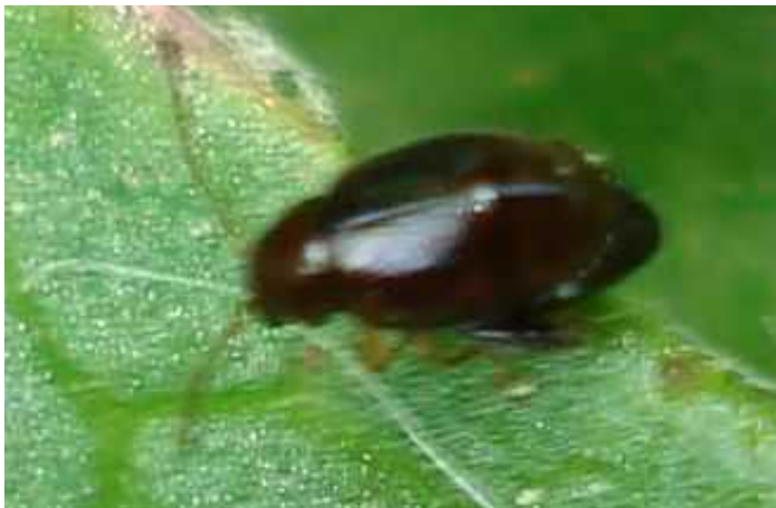
Longitarsus cf. luridus hembra

Longitarsus luridus - Mide de 1,5 a 2,2 mm de longitud. El color general del cuerpo varia desde el ocre amarillento al negro, pasando por el pardo rojizo oscuro del ejemplar de las fotos. los élitros están fuertemente punteados. Las patas son amarillentas en todos los casos, excepto el fémur posterior, que es oscuro. Vive en lugares con vegetación abundante. El adulto es ampliamente polífago, mientras que la larva, minadora de hojas, se alimenta básicamente de Ranunculus , Clematis , Anemone o Pulsatilla .