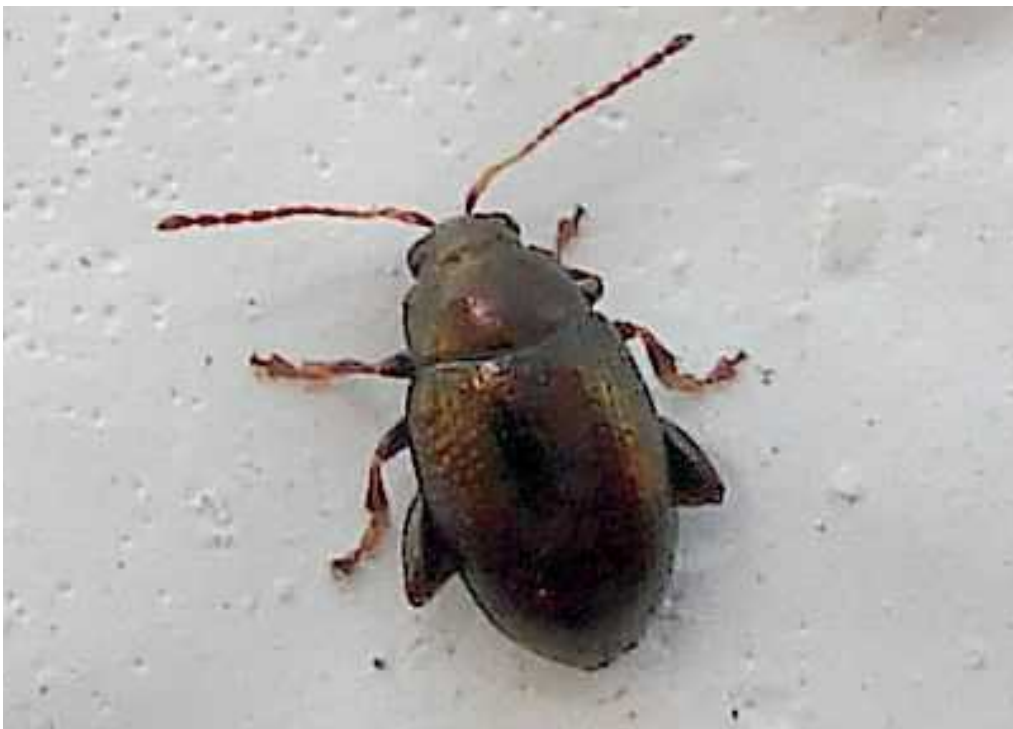
Chaetocnema cf. concinna ejemplares color bronce

Chaetocnema concinna – Mide de 1,5 a 2,4 mm de longitud. Pronoto y élitros bronce oscuro metálico con reflejos verdosos. Las tibias de las patas poseen una excrescencia hacia el exterior. Especies similares con Chaetocnema picipes y Ch. tibialis , que es una plaga de la remolacha azucarera. Se alimenta de plantas Poligonáceas: Rumex , Polygonum y Rheum .