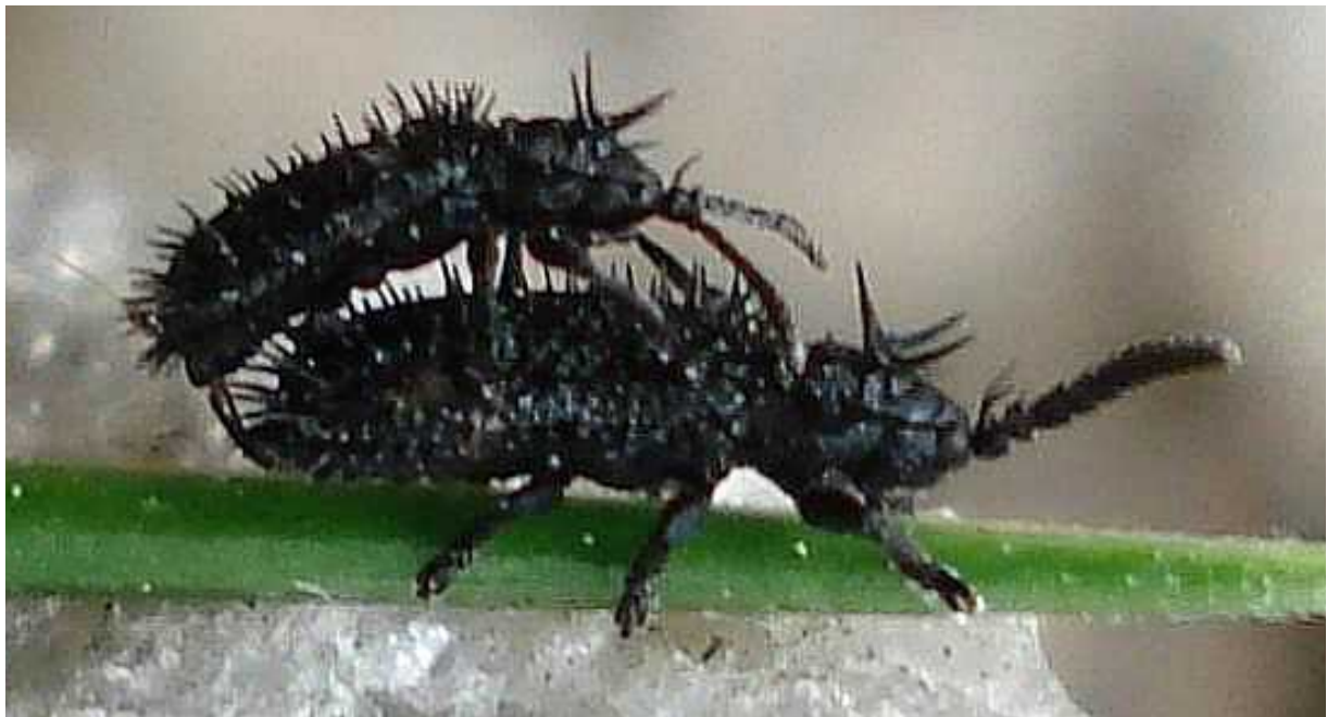
Hispa = Hispella atra macho y hembra

Hispa = Hispella atra – Mide de 3 a 4 mm de longitud. Aspecto muy característico, de color negruzco y totalmente cubierto de grandes espinas. Vive en zonas secas y cálidas con poca vegetación. Se alimentan de gramíneas, como Poa , Cynodon , Dactylis , etc, cuyo interior roe la larva. Los adultos nacidos en otoño hibernan enterrados en el suelo.