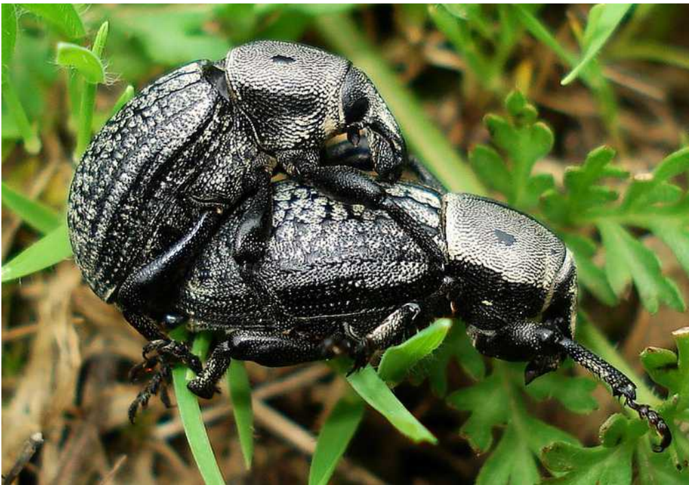
Anisorhynchus cf. hespericus varios ejemplares

Anisorhynchus hespericus – Mide unos 15 mm de longitud. Color general negro, cubierto densamente por escamitas marrones que van desapareciendo en los ejemplares viejos. Pronoto con una quilla longitudinal negra sin escamas, que no alcanza ni el extremo anterior ni el posterior y dos zonas redondas sin escamas a los lados de la quilla. Élitros con constillas longitudinales muy finas, y en el espacio entre las mismas, unos tubérculos intercalados desprovistos de escamas. Alimentación polífaga. Se desconoce su biología.