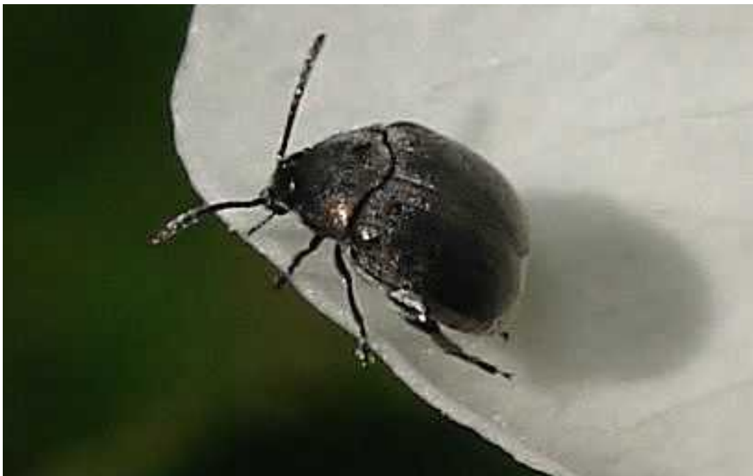
Spermophagus cf. sericeus macho

Spermophagus sericeus - Mide de 1,2 a 2,8 mm de longitud. Posee un cuerpo ovalado, de color gris oscuro o negruzco brillante, con pelos muy cortos y dispersos que no forman manchas. El tórax es de forma más o menos semicircular. El macho presenta dos espuelas en la tibia de la pata trasera. El adulto y la larva viven en las cápsulas florales de Convolvulus y Calystegia .