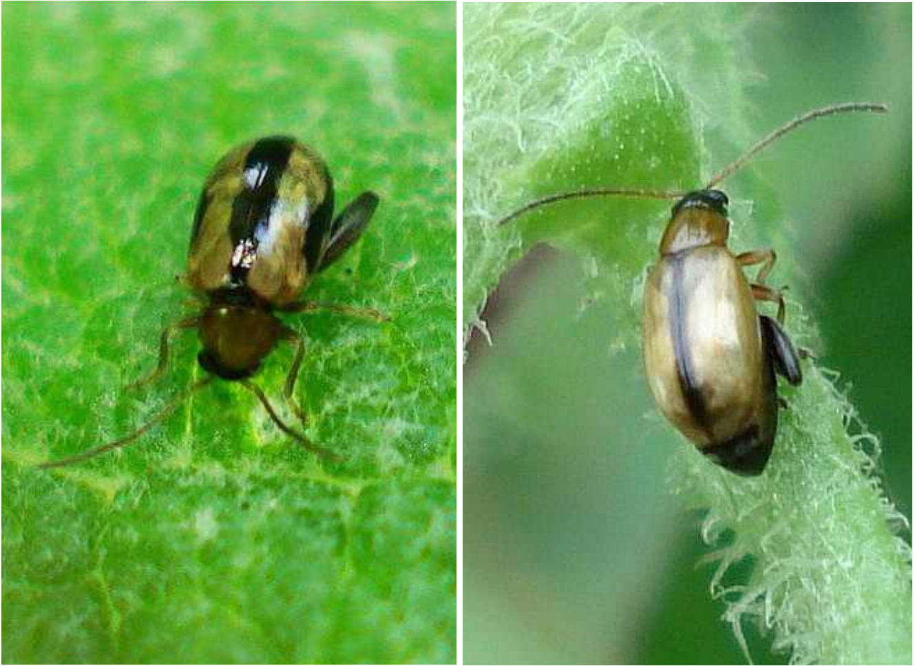
Longitarsus cf. tabidus dos ejemplares

Longitarsus tabidus – Mide de 3,5 a 4 mm de longitud. Color general ocreo anaranjado, a menudo con la zona de unión de los élitros negra, formando en algunos casos una banda ancha que recuerda a los Phyllotreta , aunque éstos nunca tienen el pronoto de color naranja. Antenas y patas amarillentas, excepto los fémures traseros, oscuros. Se alimenta de diversas herbáceas, como Verbascum , etc, en las cuales la larva roe las raíces y el adulto las hojas.