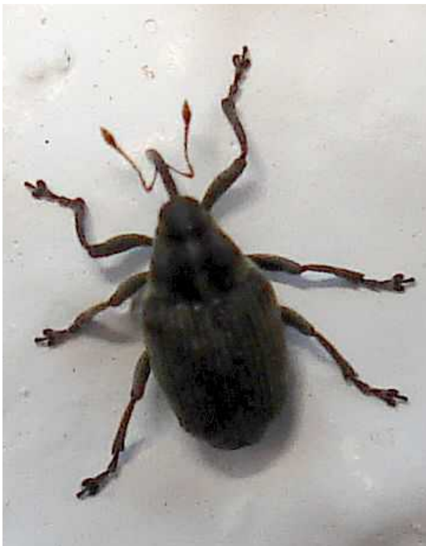
Ceutorhynchus cf. assimilis

Ceutorhynchus assimilis – Mide de 2,5 a 3 mm de longitud. Color general gris oscuro, con pelo gris claro en los élitros y generalmente una línea longitudinal de pelo blanco en la parte central de la cabeza y el pronoto. Rostro largo, fino y curvado. Se alimenta de las semillas de plantas como la colza ( Brassica napus ), la col ( Brassica oleracea ), etc.