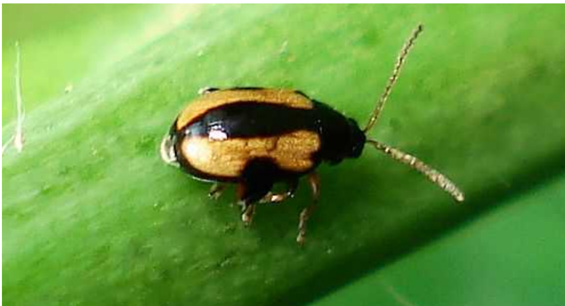
Phyllotreta cf. ochripes dos ejemplares

Phyllotreta ochripes – Mide de 2 a 2,4 mm de longitud. Color general negruzco, con dos bandas de color beige amarillento en los élitros, cuya parte interior forma una curva regular, lo que le diferencia de Phyllotreta striolata , cuyas bandas claras de los élitros son casi paralelas y rectilíneas en su interior. El 5° artejo antenal es más ancho y largo que los que le rodean. Vive sobre Crucíferas, en zonas húmedas.