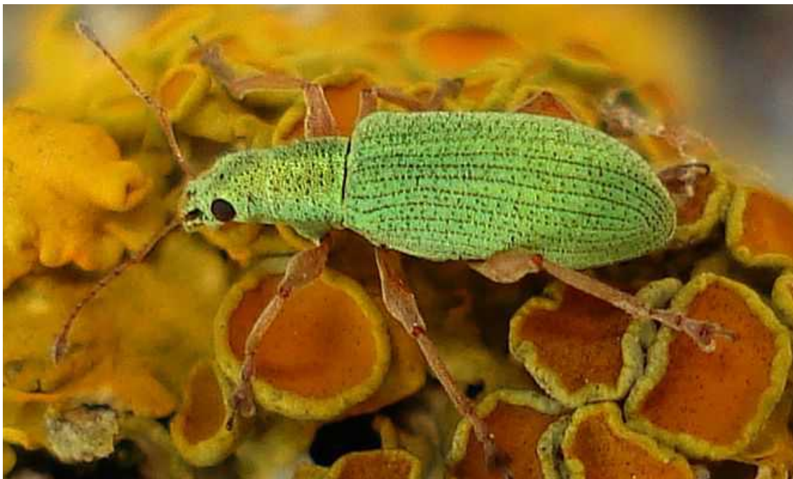
Polydrusus cf. impressifrons

Polydrusus impressifrons - Mide de 5 a 6 mm de longitud. Color del cuerpo verde claro más o menos vivo, debido a las escamas que lo recubren. Donde se pierden las escamas el color que queda es gris oscuro. Las patas son de color naranja pálido, lo que le diferencia de P. formosus y P. planifrons , cuyas patas son del color del cuerpo debido al recubrimiento de escamas. El adulto se alimenta de hojas y brotes de robles, avellanos, nogales y frutales, y la larva de sus raíces, por lo que se le considera una plaga.