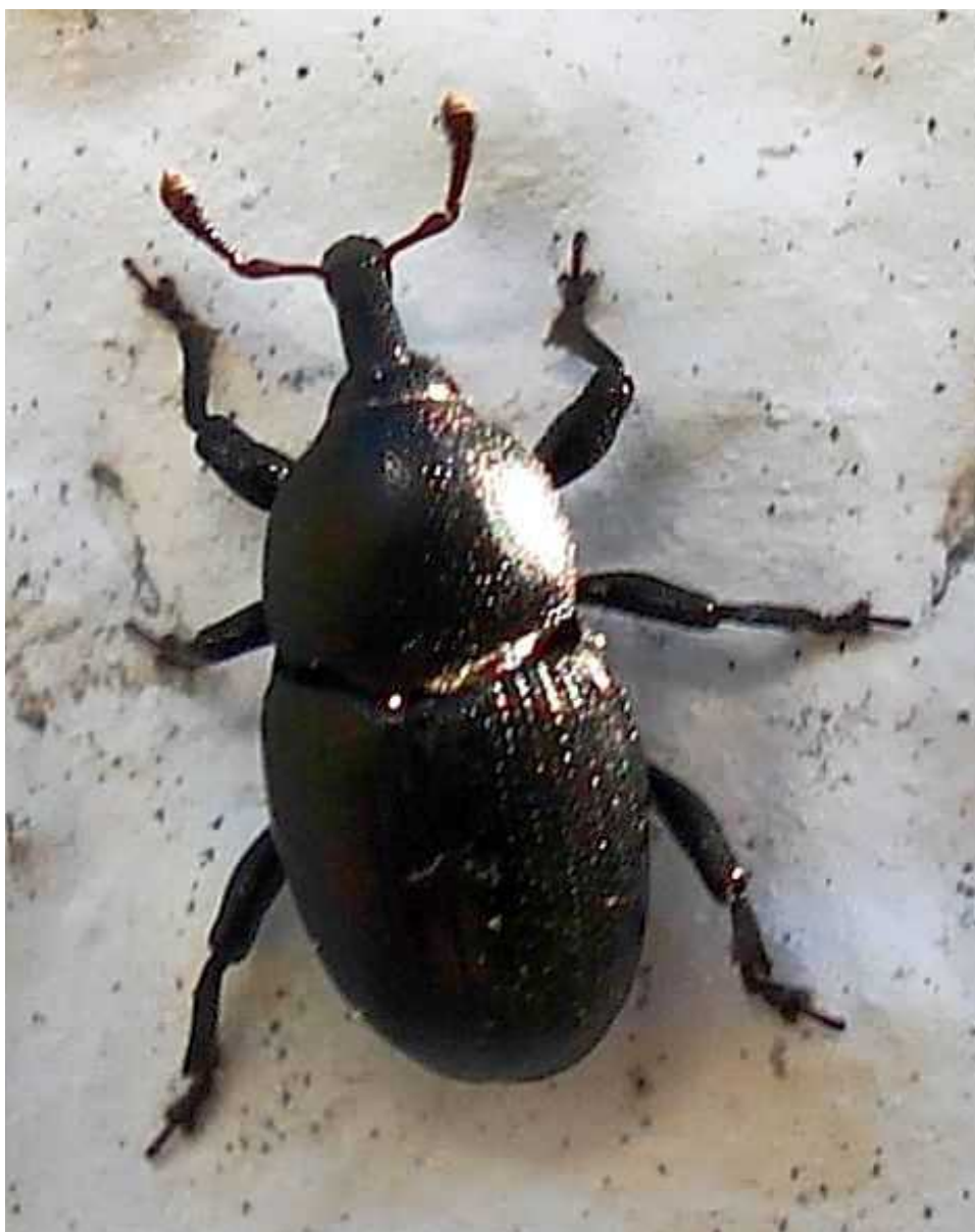
Baris cf. artemisiae

Baris artemisiae – Mide de 3 a 4,5 mm de longitud. Color general negro, con punteaduras densas y muy marcadas en el pronoto y las líneas elitrales. Los adultos hibernan.