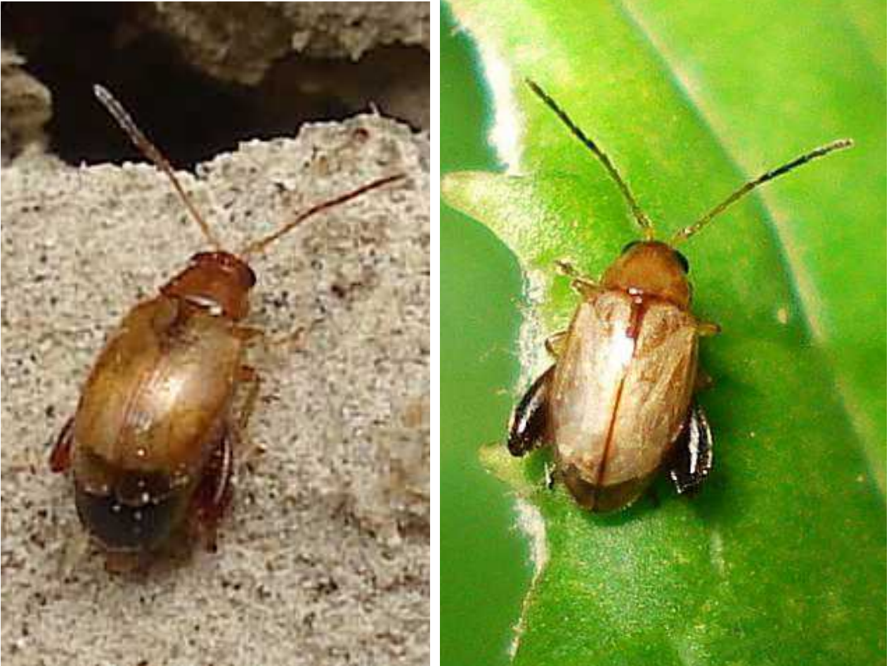
Longitarsus cf. ochroleucus dos ejemplares

Longitarsus ochroleucus – Mide de 2,2 a 2,6 mm de longitud. Color general amarillento, con la cabeza y el pronoto más anaranjados que los élitros, que son de color pálido. Los últimos seis segmentos de las antenas están oscurecidos. Las patas son amarillentas, excepto los fémures posteriores, que son más oscuros. Se alimenta de diversas plantas herbáceas de la familia de las Compuestas (Asteráceas).