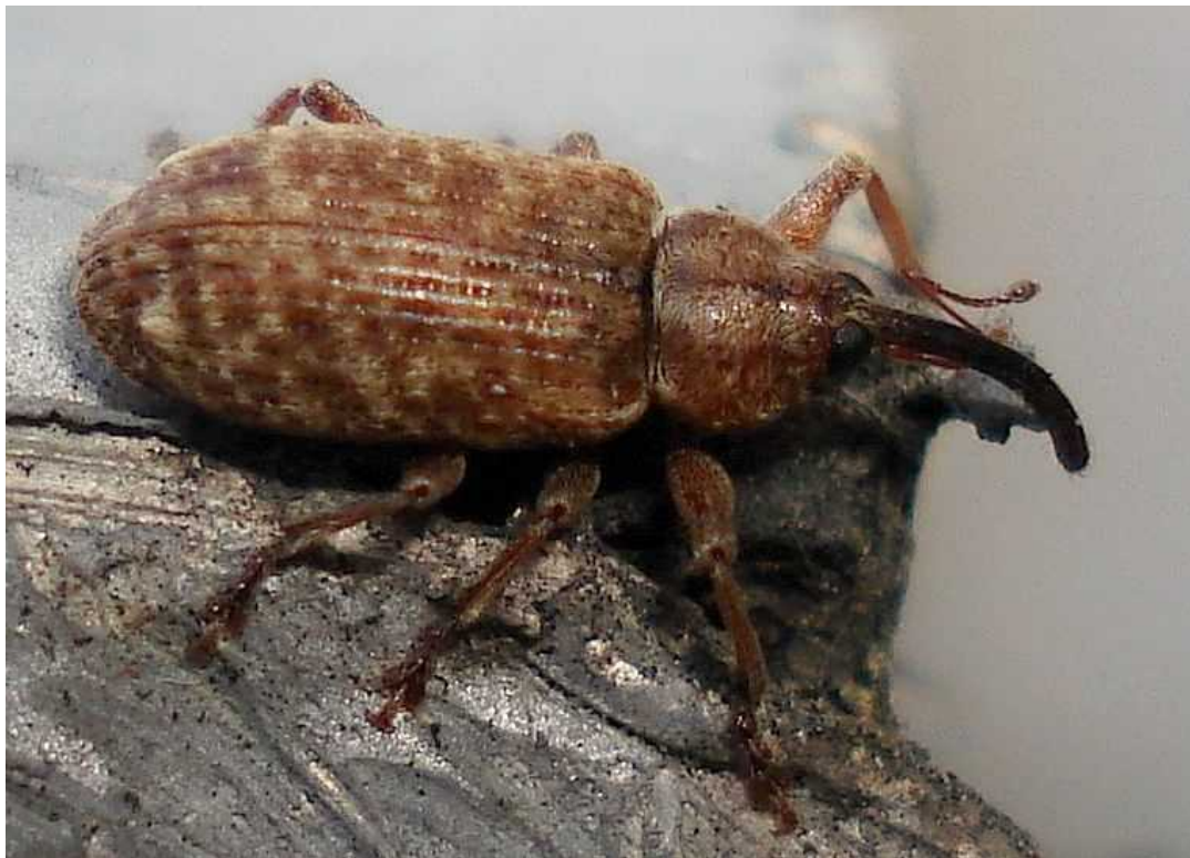
Dorytomus longimanus arriba: macho; abajo: hembra

Dorytomus longimanus – Mide de 4,7 a 7,5 mm de longitud. Color pardo más o menos oscuro hasta casi el negro. Se caracteriza por la gran longitud del fémur y tarsos del primer par de patas del macho. El pronoto y los élitros presentan grupos de escamas blanquecinas que forman dibujos. El adulto vive bajo la corteza de los chopos ( Populus ) y la larva se alimenta de brotes de los mismos. El adulto hiberna en el suelo o la corteza de los árboles.