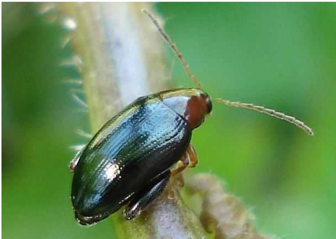
Psylliodes cf. tricolor = sophiae dos ejemplares

Psylliodes tricolor = sophiae – Mide de 2,8 a 3,6 mm de longitud. Cabeza y pronoto de color naranja, a veces castaño más oscuro. Élitros de color verde oscuro metálico. Puede ser confundido con la forma de pronoto naranja de Psylliodes chrysocephala . Vive sobre Descurainia sophia e Isatis tinctoria .