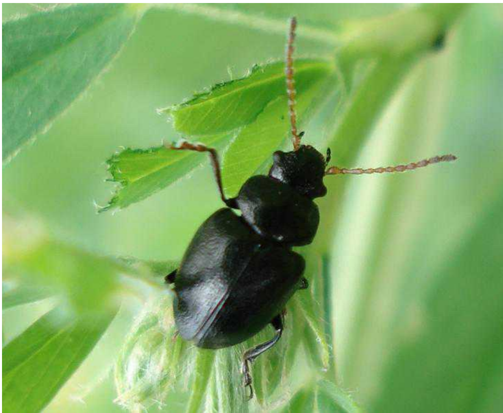
Colaspidema barbarum = atrum macho

Colaspidema barbarum = atrum – Mide de 4 a 6 mm de longitud. Color negro brillante. Los élitros son más anchos que el pronoto y se estrechan hacia atrás. Al igual que en el género Galeruca , el abdomen de la hembra se distiende considerablemente después de la fecundación. Los adultos hibernan en tierra y se alimentan de hojas de Medicago , Trifolium y Vicia sativa . Las larvas devoran las hojas de la alfalfa y si exfolian completamente la planta huésped, pueden buscar otras especies de plantas salvajes y cultivadas.