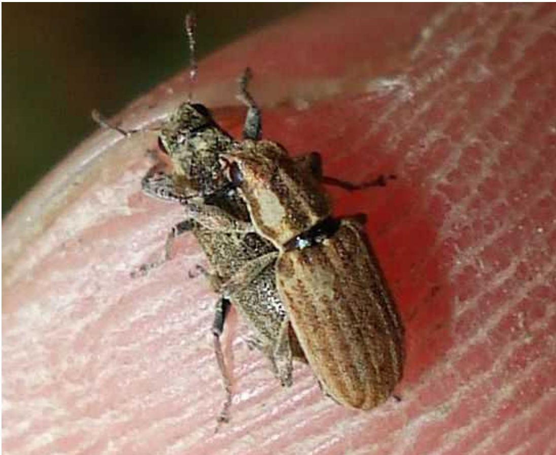
Sitona cf. lineatus macho y hembra

Sitona lineatus – Mide de 4 a 6 mm de longitud. El color general es pardo claro o gris claro, con un diseño de franjas longitudinales claras y oscuras alternativas. La cabeza, a la altura de los ojos incluidos éstos, es igual de ancha (100%) que el borde anterior del tórax, lo que le diferencia de Sitona discoideus , de cabeza más estrecha que el borde del tórax (83%). El adulto se alimenta de las hojas de diversas leguminosas silvestres y cultivadas: Vicia, Medicago, Trifolium, Pisum, Melilotus , etc, por lo que se le considera una plaga de las judías, habas y guisantes. La larva se alimenta de las raíces de la planta huésped.