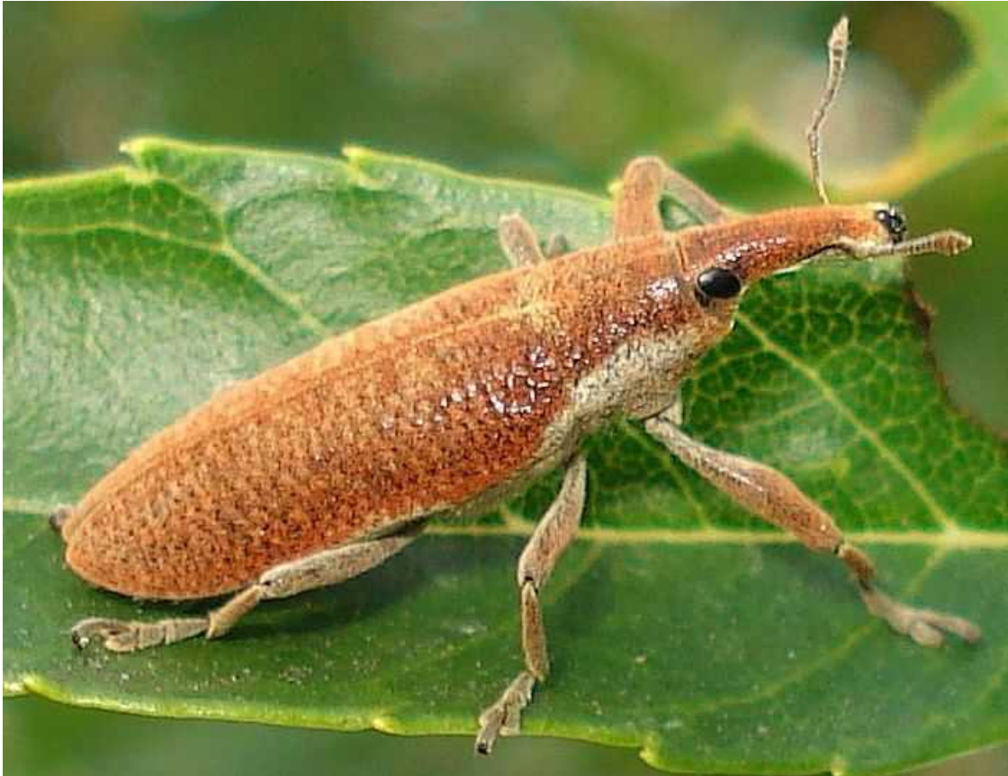
Lixus angustatus = pulverulentus dos variantes

Lixus angustatus = pulverulentus – Mide de 10 a 15 mm de longitud. Cuerpo cubierto de escamas pruinosas de color amarillo o naranja pálido, que en ejemplares viejos se van perdiendo, apareciendo el color del cuerpo que es pardo grisáceo oscuro. Las hembras tienen la probóscide algo más larga y, generalmente, sin escamas amarillas, por utilizarla para horadar las plantas huésped y colocar los huevos. Las plantas huésped son Cirsium , Carduus y Malva . El adulto se alimenta de las hojas y tallos, mientras las larvas horadan la médula de los tallos. Pueden volar, haciendo vuelos cortos. Como muchos otros gorgojos, en caso de peligro recogen las patas y se dejan caer al suelo.