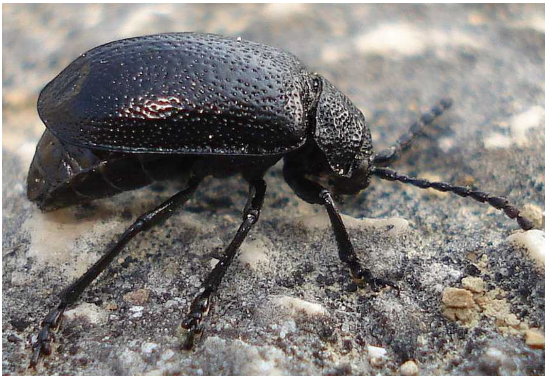
Galeruca tanacetii hembras

Galeruca tanacetii – Mide de 6 a 12 mm de longitud. Color negro, con fasetas tanto en el pronoto como en los élitros, dándole un aspecto de superficie irregular. Posee alas funcionales. Es una especie polífaga, alimentándose de gran número de plantas. La hembra coloca grandes ootecas fijadas en las hierbas y tallos en septiembre, pero las larvas no nacen hasta la primavera.