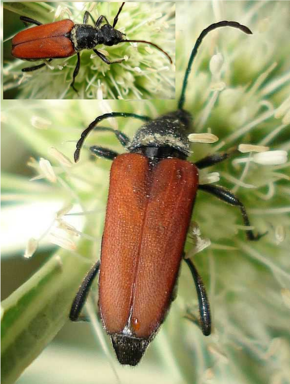
Anoplodera sanguinolenta hembras

Anoplodera = Anastrangalia sanguinolenta – Mide de 9 a 13 mm de longitud. Los élitros del macho son de color pardo amarillento o anaranjado brillante, con el ápice negro, mientras los de la hembra son de color más mate y carecen de negro en el extremo. El adulto es florícola, alimentándose de polen y néctar. La larva se alimenta de madera muerta de coníferas, como Pinus , Abies y Picea .