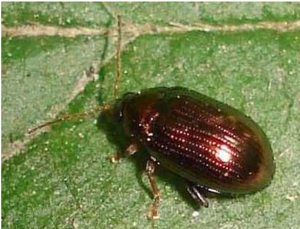
Crepidodera cf. aurea

Crepidodera aurea - Mide de 2,5 a 3,8 mm de longitud. El color general del cuerpo varía entre el verde, cobrizo, azul o violeta metálico, a veces en función de la luz del flash al ser fotografiado. Las antenas y patas son de color amarillento, excepto los fémures traseros, adaptados al salto, que son mucho más oscuros. Los élitros presentan varias filas de puntos muy aparentes. Vive en bosques de ribera, alimentándose de hojas de diversos Salix y Populus . El adulto hiberna.