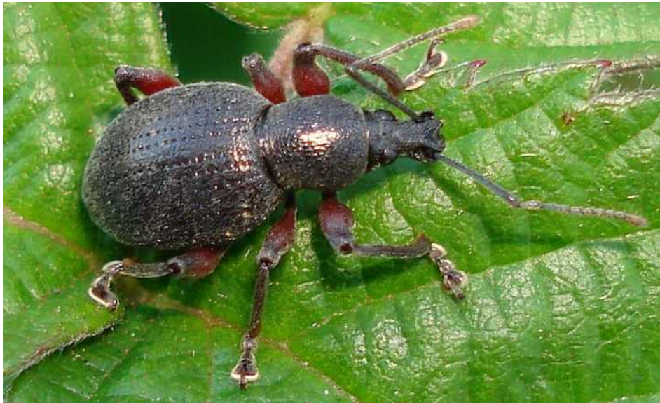
Otiorhynchus coecus = niger dos ejemplares

Otiorhynchus coecus = niger – Mide de 10 a 12 mm de longitud. Color del cuerpo gris o negruzco, con los fémures de las patas de color rojo más o menos oscuro. Los élitros del macho son más estrechos que los de la hembra, dándole un aspecto menos rechoncho. En las fosetas de los élitros presenta pelos claros que desaparecen con la edad. Vive en los bosques de coníferas y entre la hierba baja. La reproducción es partenogenética en ausencia de machos.