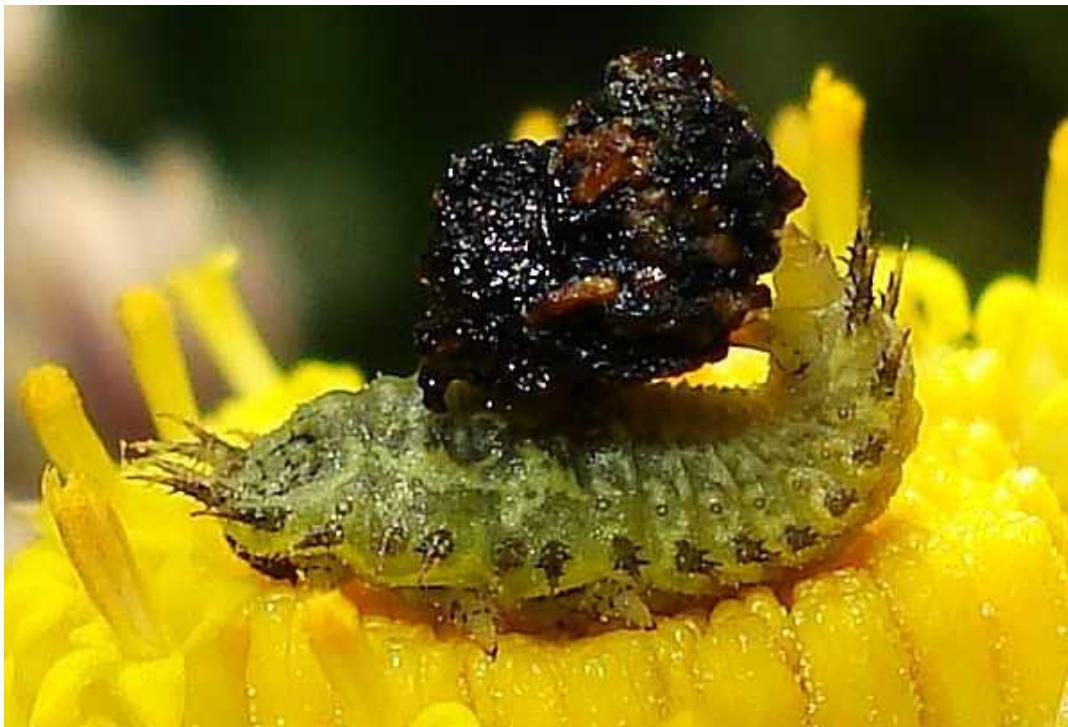
Cassida sp. larva con protección de excrementos

Cassida viridis – Mide de 7,5 a 10 mm de longitud. Cuerpo en forma de escudo, con el pronoto que sobresale por encima de la cabeza, formando un eficaz escudo del que no sobresalen las patas para evitar el ataque de depredadores. Color verde hierba uniforme, lo que le distingue de otras especies del género con manchas y dibujos. La larva se alimenta de brotes de hierbas labiadas: Stachys, Galeopsis, Mentha, Salvia, Lamium , etc. La larva, con aspecto espinoso, acarrea sobre su cuerpo los excrementos con ayuda de una horquilla caudal para engañar a los predadores.