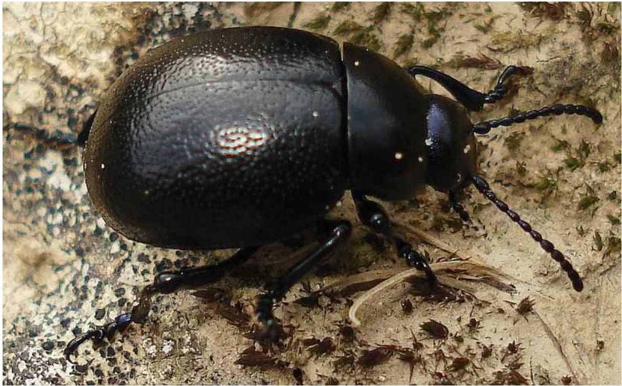
Timarcha goettingensis hembra