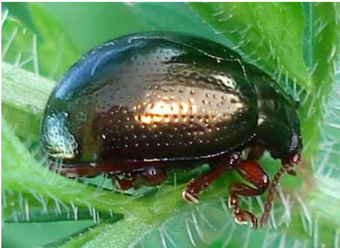
Chrysolina = Chrysomela bankii

Chrysolina = Chrysomela bankii - Mide de 7 a 9 mm de longitud. Cuerpo ovalado y abombado, de color bronce oscuro brillante, con ligeros reflejos metálicos verdosos. Los élitros presentan puntos más o menos alineados y bastante separados entre sí. Las antenas y patas son rojo oscuras. El adulto y la larva se alimentan de hojas y brotes de Lamium , Marrubium , Ballota , Mentha y otras plantas labiadas.