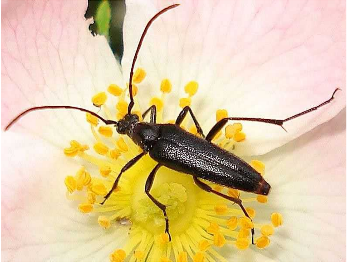
Stenurella = Leptura nigra

Stenurella = Leptura nigra – Mide de 6 a 9 mm de longitud. Se caracteriza por tener el cuerpo y las patas de color negro, aunque la parte inferior del abdomen es rojiza o anaranjada. El adulto es florícola, alimentándose de polen y néctar. La larva se desarrolla en la madera muerta de árboles caducifolios y arbustos variados.