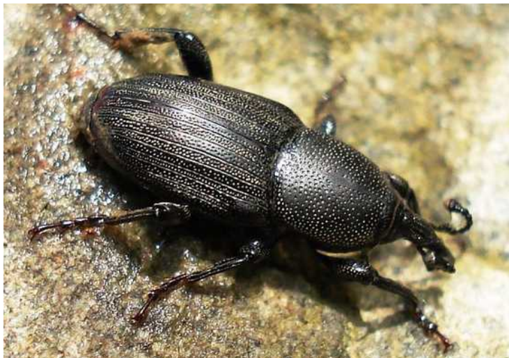
Sphenophorus striatopunctatus = piceus

Sphenophorus striatopunctatus = piceus – Mide unos 15 mm de longitud. Color del cuerpo negro brillante, con pequeños puntos de pelo claro en los puntos y estrías de los élitros. Pronoto con punteado grueso e irregular. Presenta un anillo rojizo en la parte posterior de la cabeza. Vive en praderas pantanosas, prados húmedos y en las proximidades de balsas de agua. Los adultos se alimentan de hojas de Scirpus , y las larvas de sus raíces.