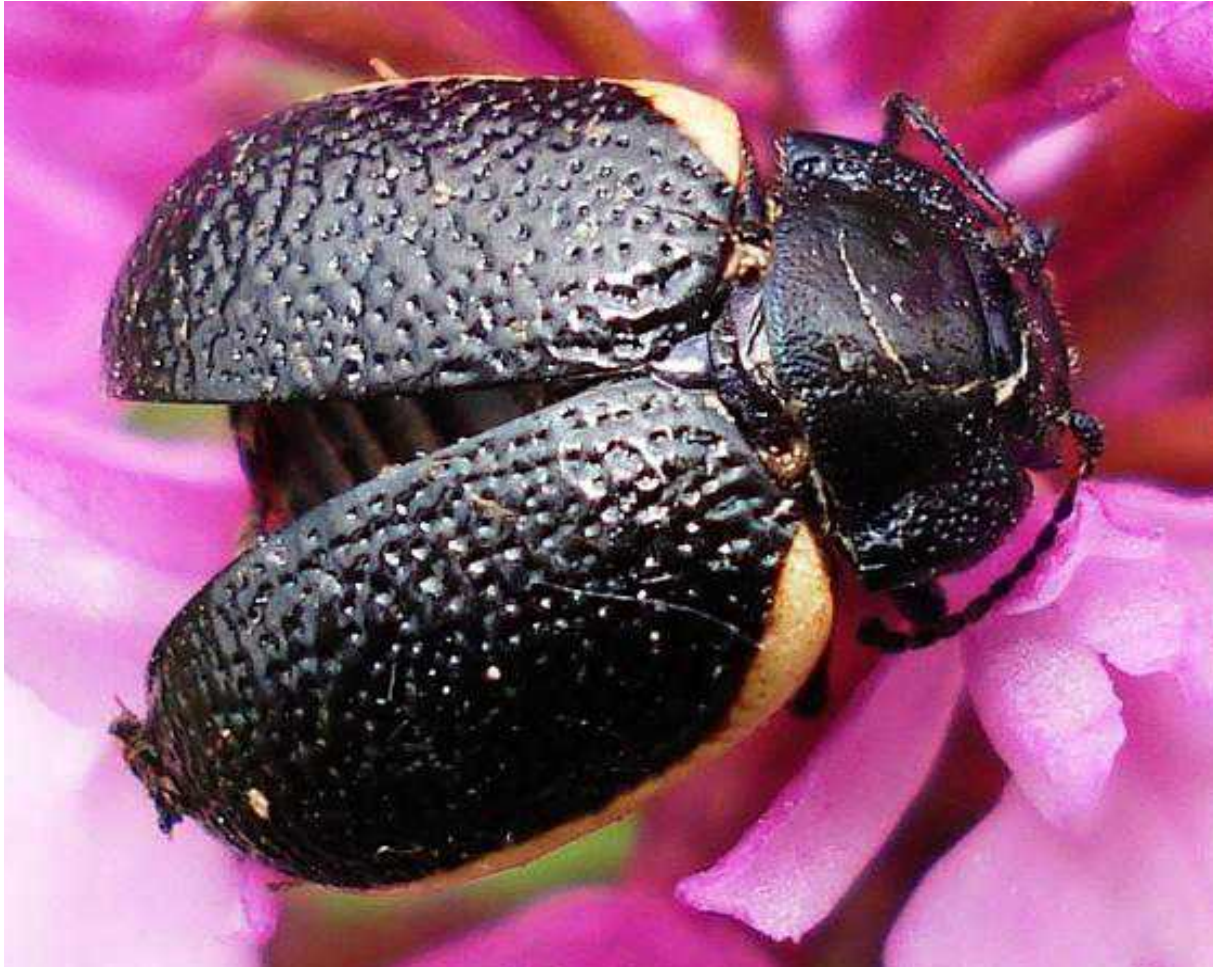
Chrysolina gypsophylae ejemplar muerto

Chrysolina gypsophylae – Mide de 6 a 9 mm de longitud. Color general negro, excepto el borde exterior de los élitros de color naranja o rojo. En los ejemplares muertos se vuelve beige. La puntuación de los élitros es muy marcada e irregular.