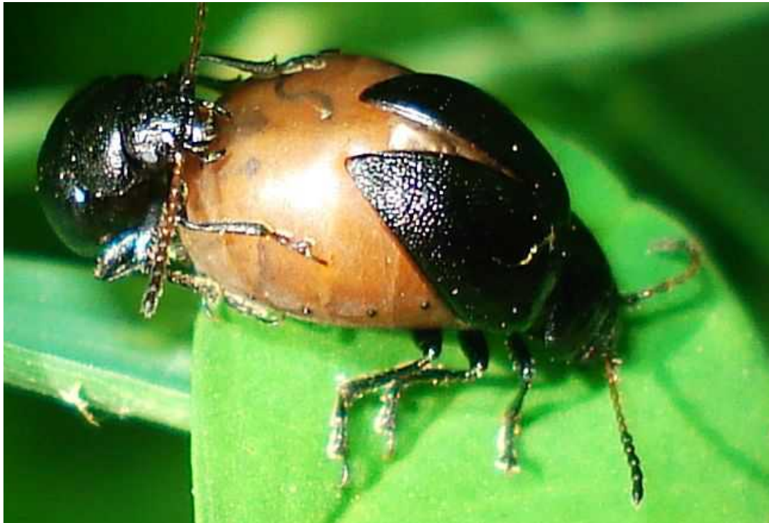
Colaspidema barbarum = atrum macho y hembra