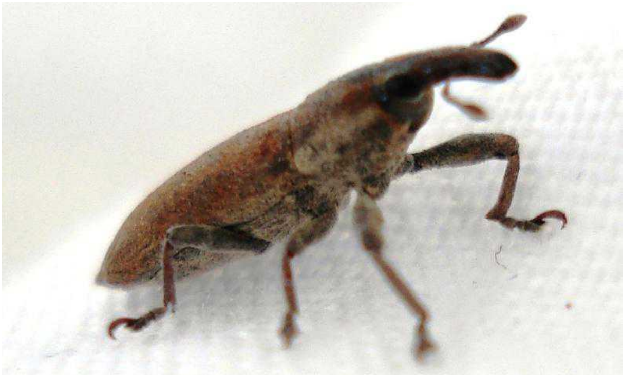
Lixus angustus = sanguineus

Lixus angustus = sanguineus – Mide de 8 a 9 mm de longitud. Cuerpo de escamas pruinosas de color pardo amarillento a rojizo más o menos oscuro, a veces rojo vino, que en los ejemplares viejos se va perdiendo, quedando a la vista el color oscuro del cuerpo. Los laterales del pronoto y los élitros son de color más claro, a veces amarillento. Rostro corto y ancho, poco curvado, lo que le diferencia de Lixus curvirostris . El rostro de la hembra es un poco más largo. El extremo de los élitros es puntiagudo.