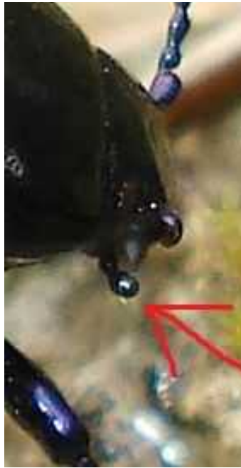
Palpos: T. cyanescens