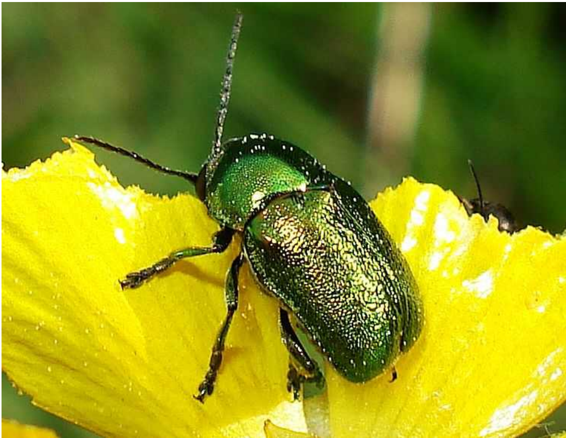
Cryptocephalus cf. aureolus = sericeus

Cryptocephalus aureolus = sericeus – Mide de 5,7 a 8 mm de longitud. Coloración verde metálica, aunque existen ejemplares que tienen reflejos dorados o azul metálico. Los élitros poseen punteado más profundo que el pronoto, y los puntos tienden a alinearse regularmente. El escutelo acaba en punta roma. La larva, durante la ninfosis elabora un capullo que le sirve de protección. El adulto se encuentra sobre diferentes herbáceas, como Ranunculáceas de flores amarillas y diversas compuestas como margaritas, crisantemos y cardos.