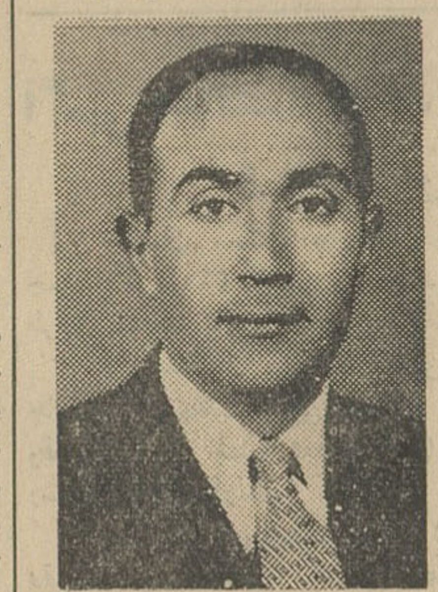
آقای نورالدین کیا سفیر ایران در کانادا

ايران وارد مرحله تاريخي تقسيم اراضي شده و بديهي است که اين امر باعث رشد نهضت اقتصادي ايران می شود