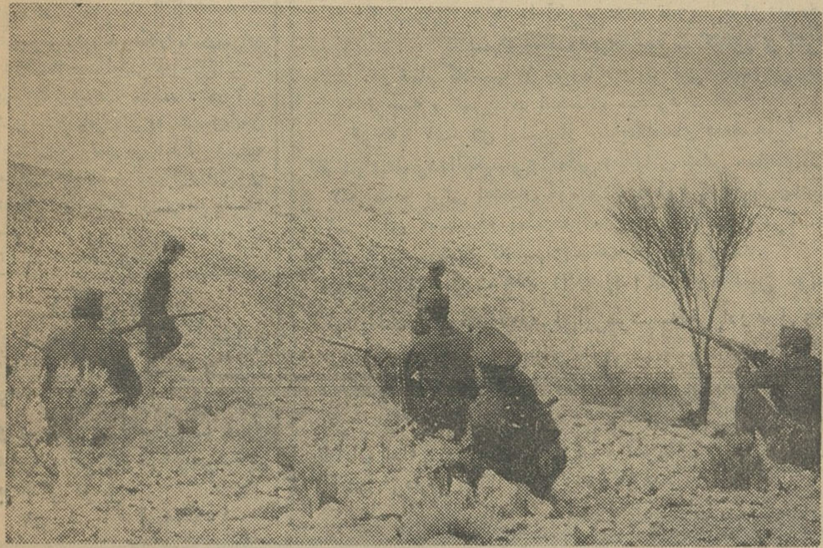
عده‌ای دیگر از دستیاران قتل مهندس عابدی هنوز در کوهستان متواری هستند، در عکس بالا ژاندارما کوهی را برای جستجو محاصره کرده‌اند.

آخر وقت امروز خبر نگار ما از فیروز آباد اطلاع داد: