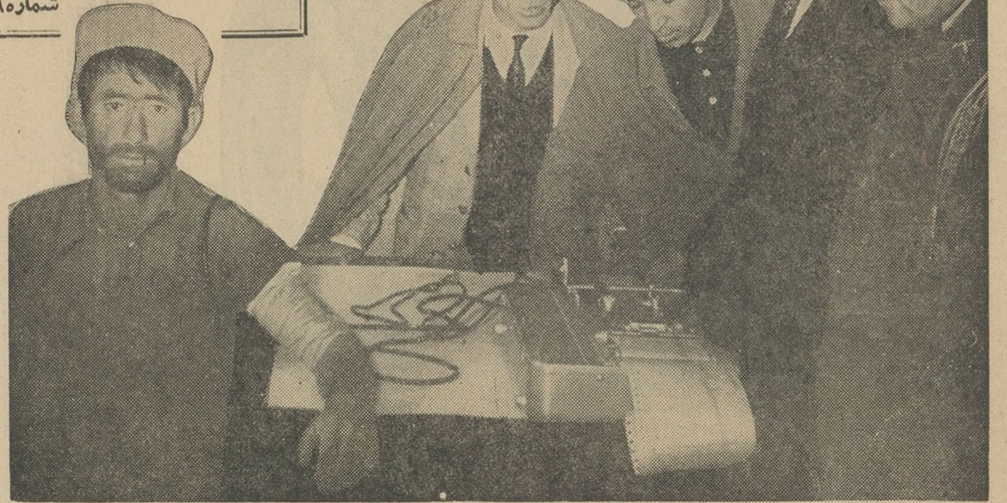
پس از تحقیقات مفصل:

سال سی و هفتم - دوشنبه پنجم آذرماه ۱۳۴۱ شماره ۱۰۹۵۹ - تک شماره ۳ ریال