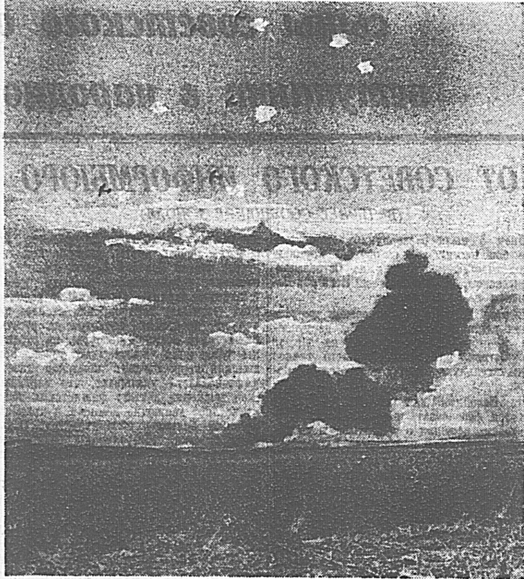
Советские зенитчики обстреливают вражеские самолеты. Внизу горит сбитый фашистский самолет.