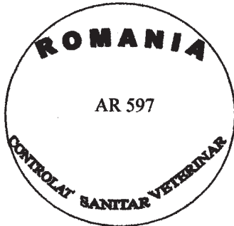
Figura nr. 1

pentru marcarea produselor de origine animală, cu excepția cărnii proaspete