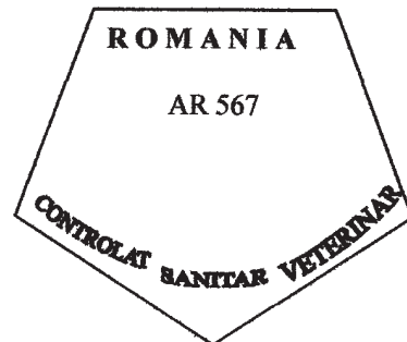
Figura nr. 2

Modelul ștampilei de sănătate pentru produsele de origine animala destinate comercializării pe piața nationala