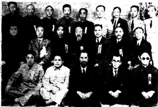
眞耶穌教會總會第十一屆理事監事職與政府代表合影

家人當知家中之事，國民當知國家之事，神子而不知神事，會友而不知會事，其目不識丁，手無財力者吾不敢誇許也，反是皆有閱看本報之義務，皆有推銷本報之責任，不飲食者吾知其不壽，不讀本報而能結佳者，實神之恩存耳，因其未館早作準備，吾云其難結碩菓，未爲奇也，經云「斧鋤則多費氣力」，不看何以求聖靈助爾想起？語云「臨河羨魚，不如退而結網」，本報其良網也，轉盼靈報持能得人之業如得魚焉阿們。