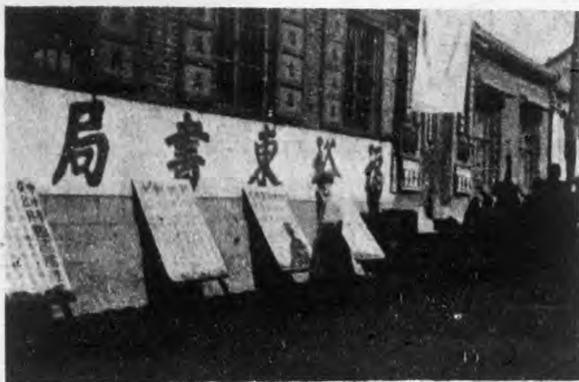
煙台福裕東書局面