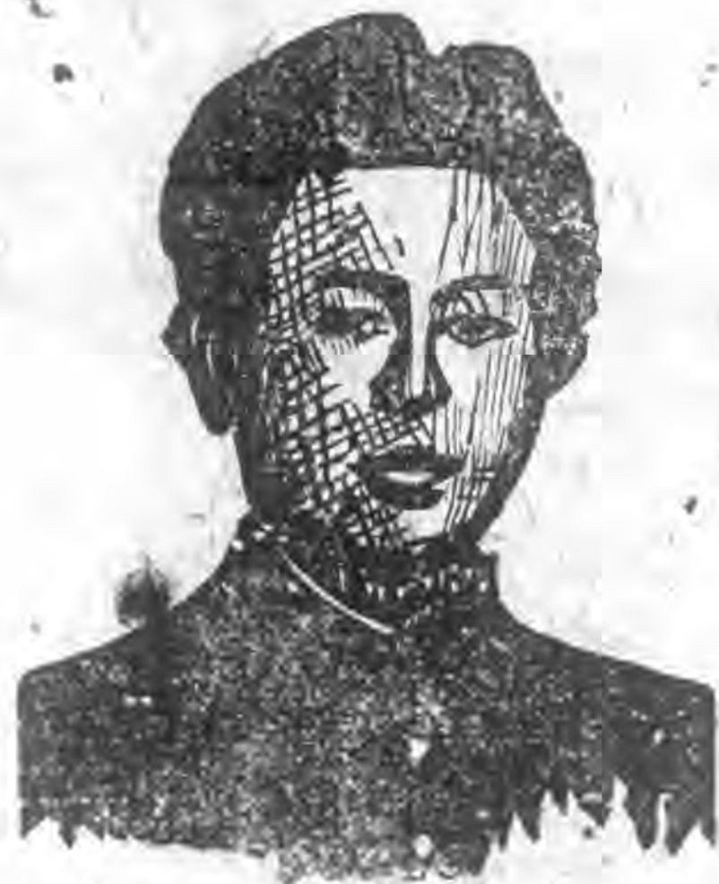
(超) 影 剪 者 相 爲

此種光譜儀法 (Spectrographic method) 之優點，乃具有特殊之靈敏性，因此雖用普通方法所不能偵察出來的微小物證，如針尖大小的東西，都一樣可拿到光譜儀下去，一看便瞭如指掌，任何疑難問題即立時解決。光譜儀法的第二個優點是迅速，據說不