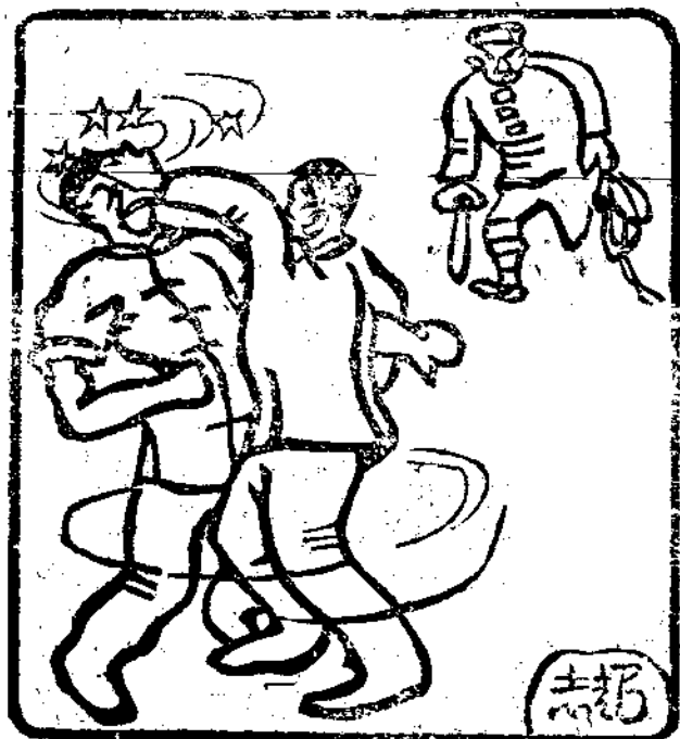
我們堅決保障社會安寧秩序

沿途各站有着成羣結隊，衣不蔽體面黃肌瘦的十歲左右兒童售賣小食，小小年紀爲了衣食不得不犧牲了寶貴的求學時光，不怕風吹雨打，來追逐蠅頭之利，這正反映着中國人民普遍的窮困十二點左右汽車將到固城鎮時忽然下起雨來了，旅客們被淋