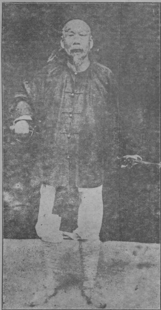
馮子材先生督大刀隊在鎮南關戰勝法軍時映像