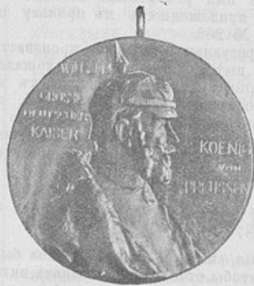
Медаль въ память царствованія императора Вильгельма I.

10-го (22-го) марта въ 11 часовъ утра состоялось торжественное открытіе памятника, къ которому депутатіи возложили серебряные вѣнки съ лентами. Затѣмъ мимо памятника и стоявшаго у онаго императора Вильгельма II войска Берлинскаго гарнизона проходили церемониальнымъ маршемъ. Наканунѣ всѣмъ чинамъ депутатій были вручены