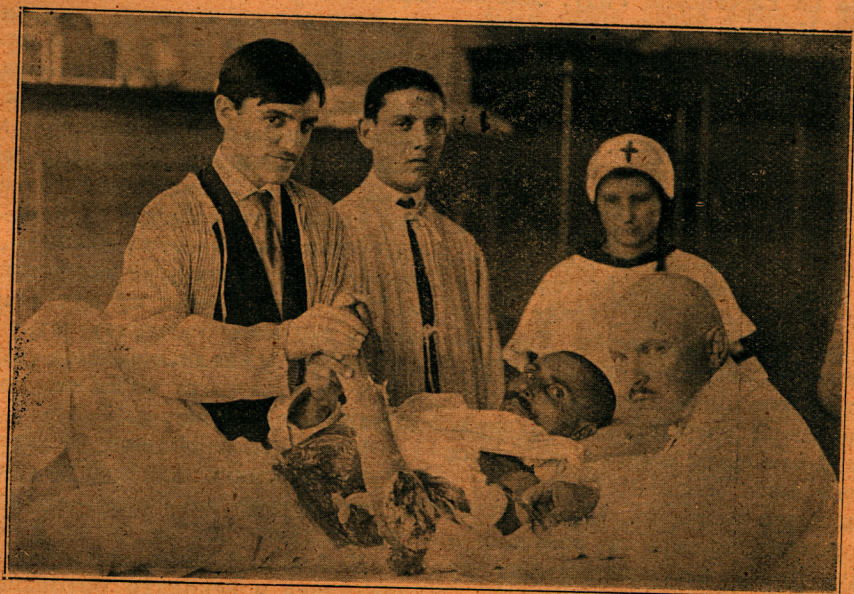
Тешки српски рањеник у болници, јунак са Једрена рањен од Бугара

На Рајчанском Риду изгледа као да је избио вулкан. Из лагане и убрзане паљбе прелази се у брзу која се слива у тупо, потмуло кључање које нервира и због своје несношљивости инстинктивно натерује да се иде напред, јер за време покрета, ма да је човек више изложен ватри него кад лежи и гађа, ипак се осећа другожачије, осећа неку топлоту, сигурност,