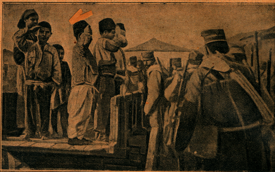
Турска деца поздрављају српску војску која је од Бугара отела Штип

Човека подузимају неки пријатни осећаји, јер види да пролазе велике историјске слике, да се догађају велики догађаји. Нигде негативног при-