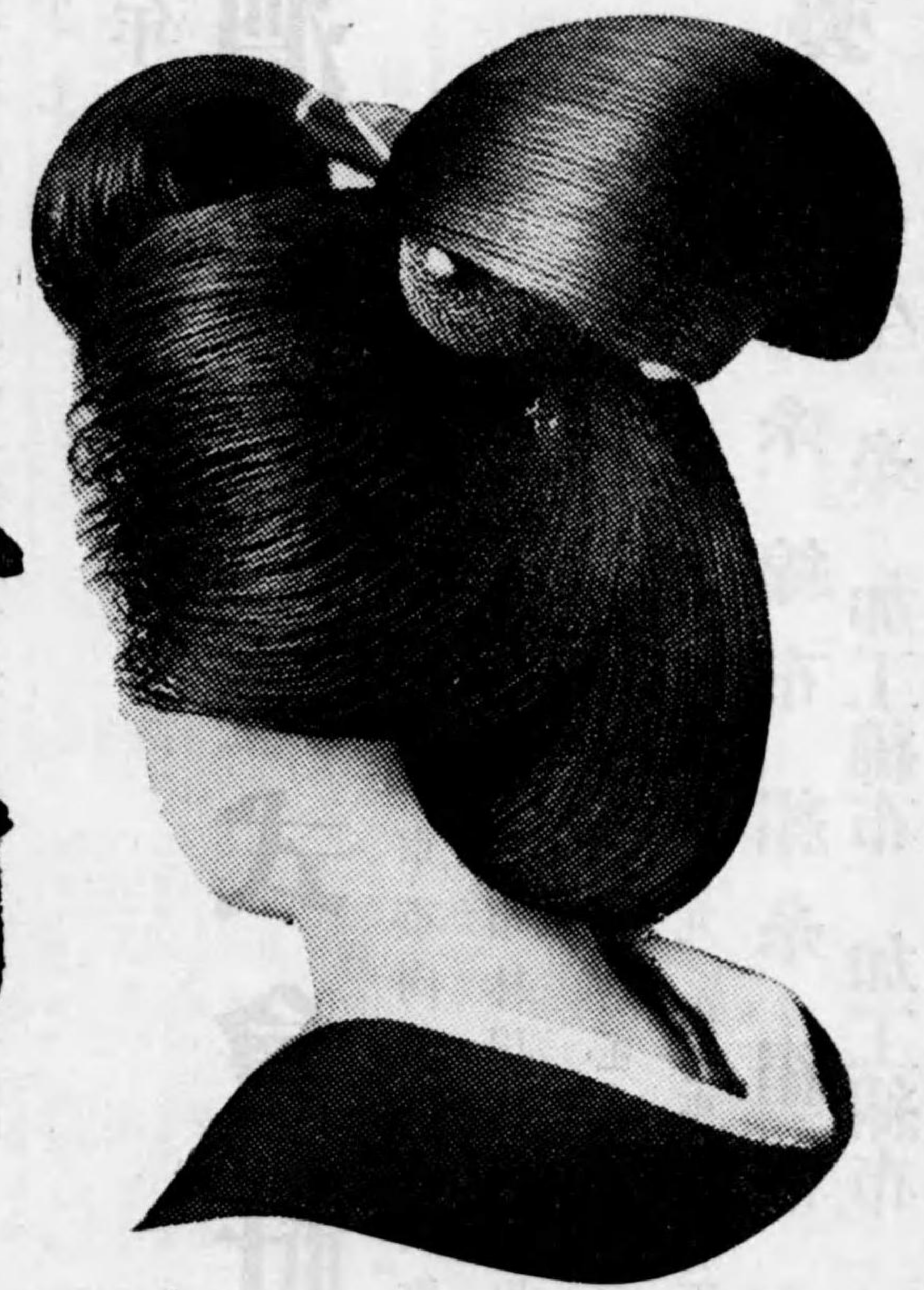
善井・舖本 町形人市京東

日本髪 にほんがみ の優美こそ 清く尊 たつ とき 貞淑 ていしゆく の表象 ひょうしょう