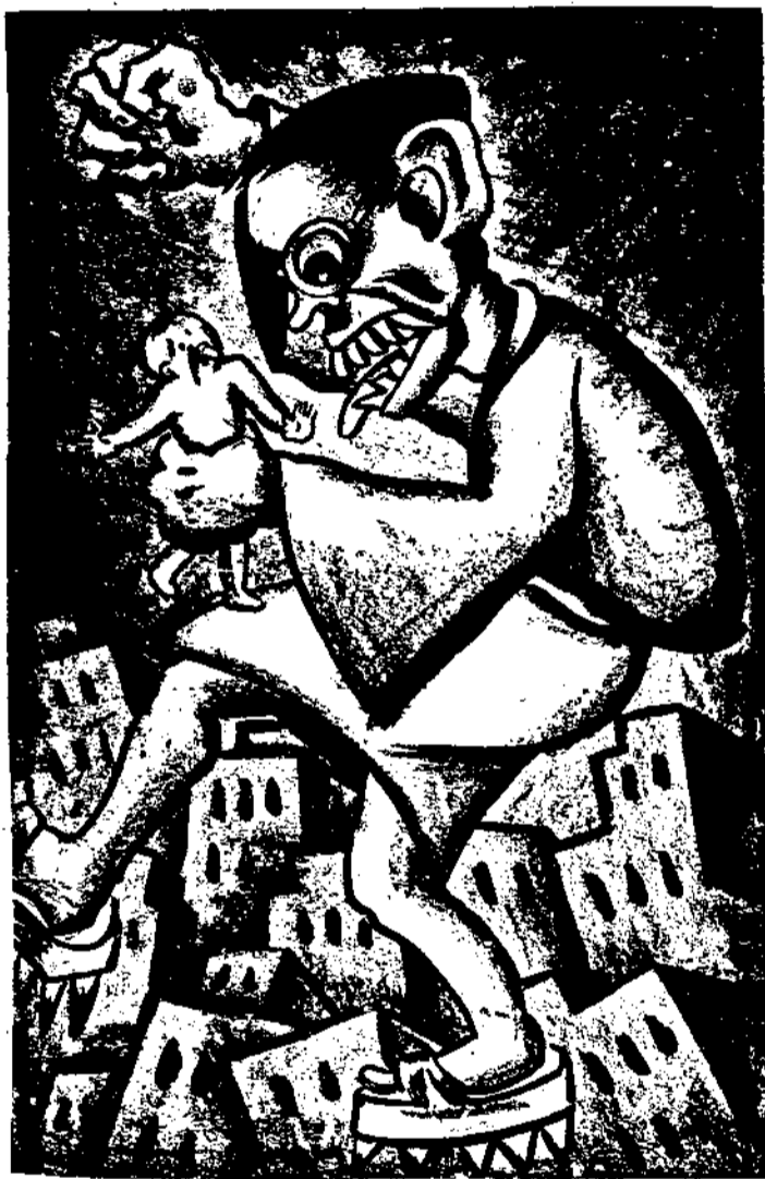
倭寇的武士精神！ 卜貞作

宣傳的方法，甚至宣傳綱領都可由黨部決定；實際的宣傳工作，如對國內外國內宣傳，印發各種各式的書籍，小冊，傳單，標語和定期刊物，不妨交由政府機關或教育機關去辦。此外，關於民衆訓練，也可以由黨部決定辦法，交由社會教育