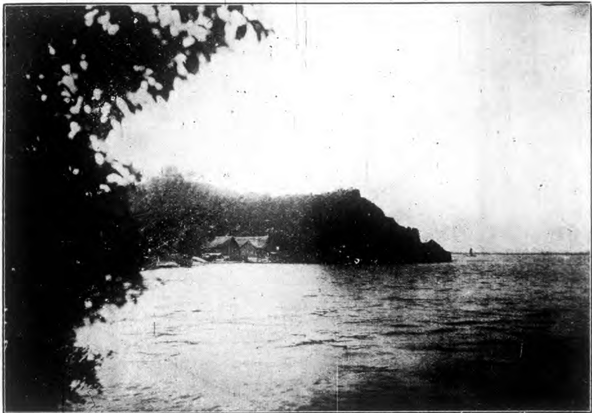
燕 子 磯 攝 影