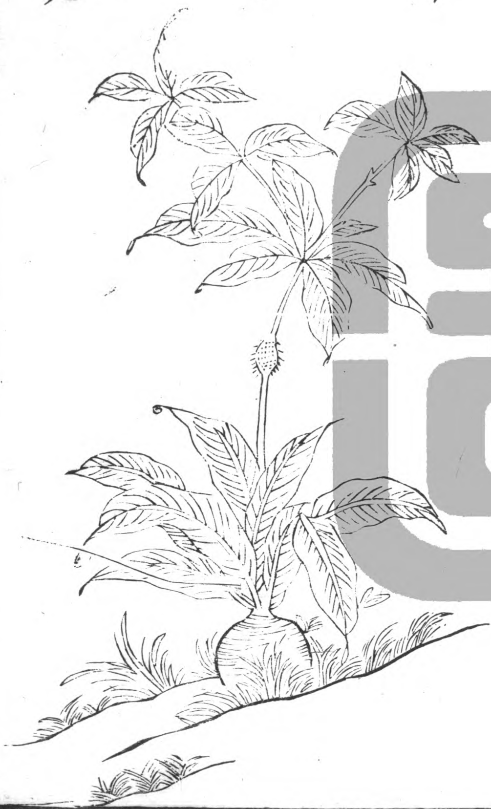
羊 蹄 秃

天南星生平澤今處處有之二月生苗似荷梗莖高一尺 以來葉如蒟蒻兩枝相抱五月開花似蛇頭黃色七月結 子作穗似石榴子紅色根似芋而圓二月八月採根亦與 蒟蒻相類即虎掌也小者名由跋苗高一二尺莖似蒟蒻 而無斑根如雞卵又有白蒟蒻亦曰鬼芋根都似天南星 但天南星小柔膩肌細炮之易裂差可辨爾味苦辛有毒 主中風除痰麻痺下氣破堅積消癰腫利胃隔散血墮胎