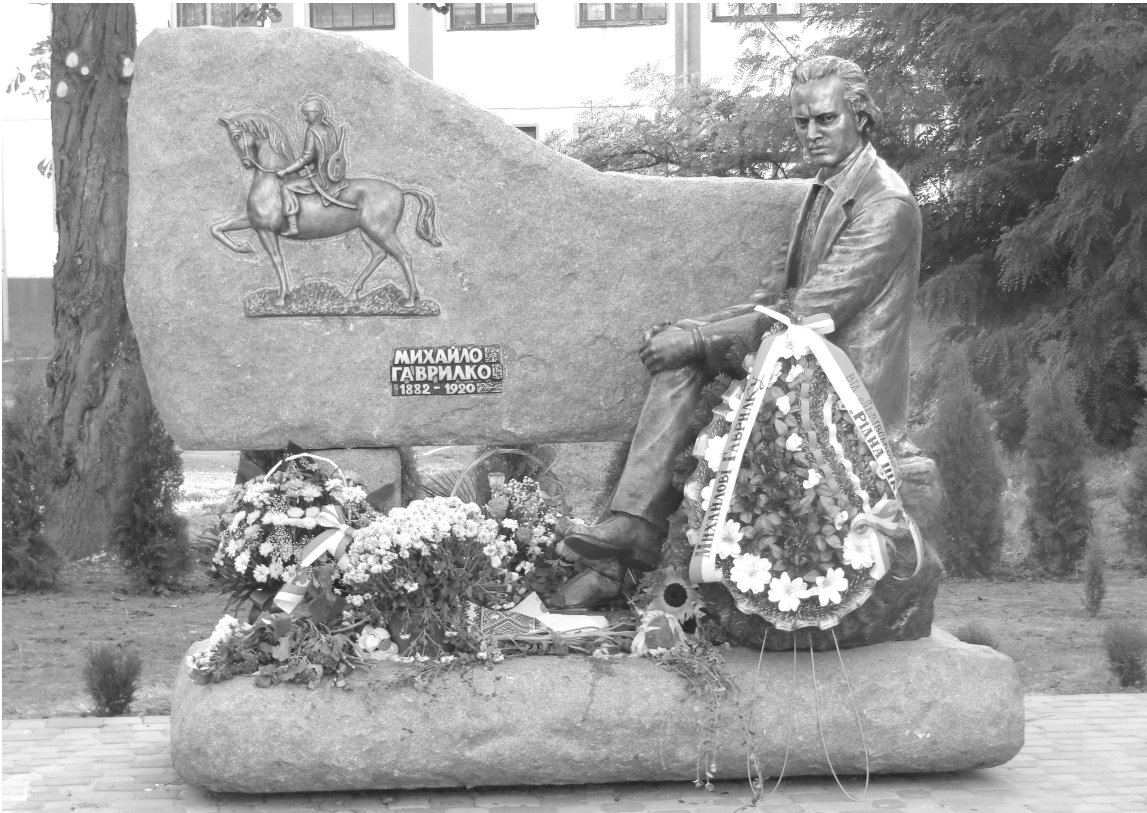
Пам'ятник М. Гаврилку. Болехів Івано-Франківської обл., 7 вересня 2014 р.

7 вересня в м. Болехові Івано-Франківської області зусиллями Історичного клубу "Холодний Яр" та Болехівської міської організації Союзу українок відкрито пам'ятник митцеві-воєні з Полтавщини Михайлові Гаврилку.