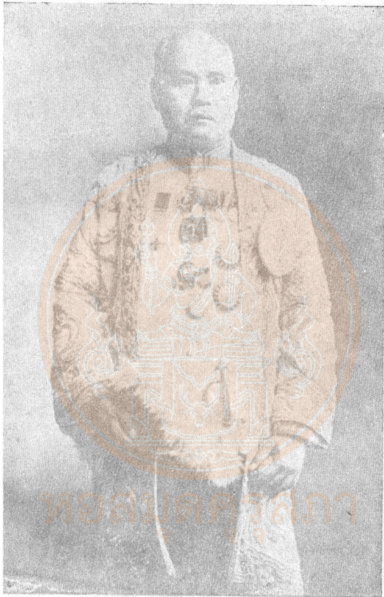
พระยาภักदनฤเบศร์ (แก้ว สาลิกุปต)