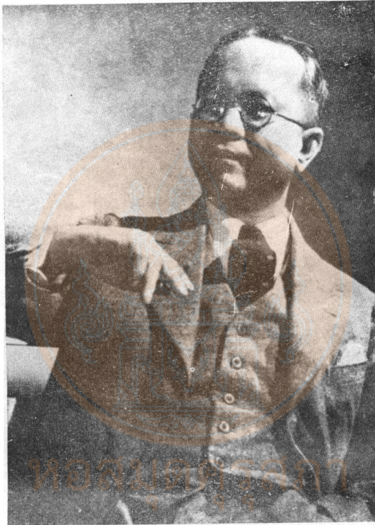
พระสาโรชรัตนนิมมานก์ (สาโรช ร. สุขยางค์)