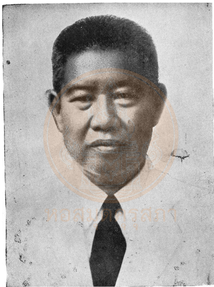
พระยาวรวิทย์พิศาล (ศุข นิโลดม)