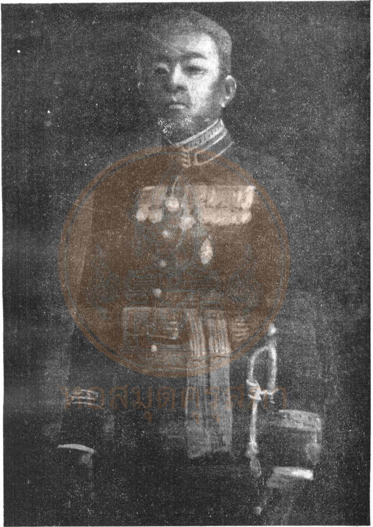
พระยาพจนสุนทร (เรือง อติเปรมานนท์)