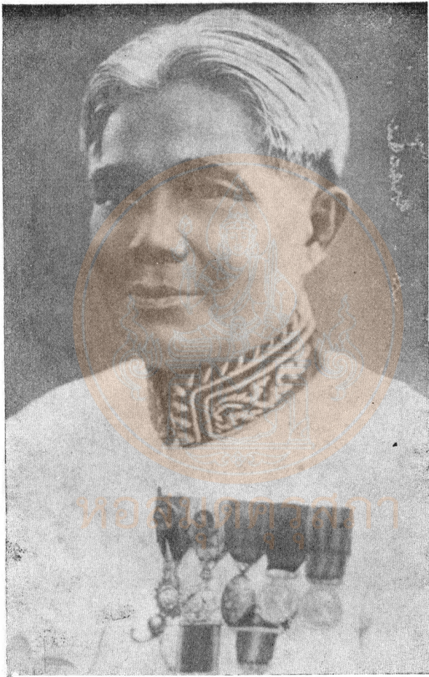
พระวรวงศ์พิเศษ (บุญ เทวะผลิน)