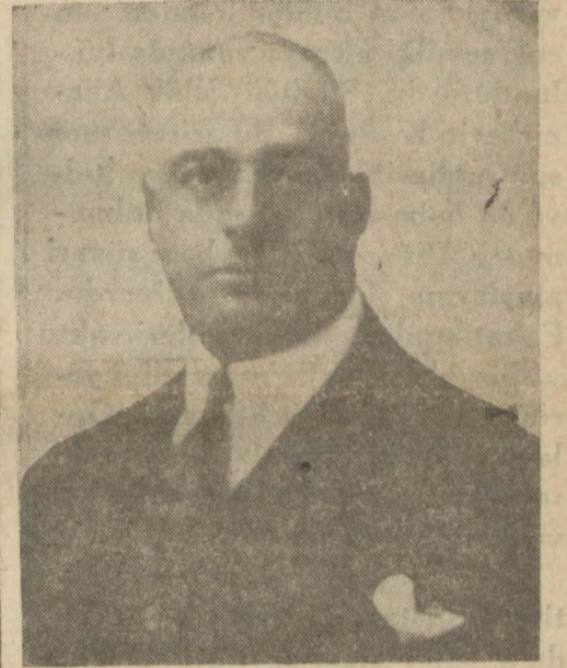
Kocaeli Valisi Eşref Bey

Yangının esbabı zuhuruna gelince sabahleyin mahallinde yaptığım ve tetkikata memur ettiğim Gebze jandarma bölük kumandanı Nurettin Beyin şimdi aldığım tahkikat evrakına göre, yangın kazan dairesinde bir kenarda yığılı duran yün kırpıntıları üzerine sıçrayan ateşten veya dikkatsizlikle atılan bir sigaradan çıkmıştır. Ateşin sıçradığı veya sigaranın düştüğü görülmemiş ve yünler yandıktan sonra ateşler tavana