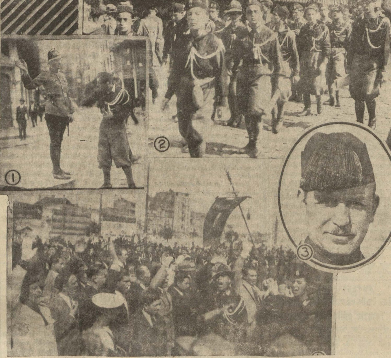
(1) Bir İtalyan izcisi işaret memurundan yol sorarken, (2) İtalyan izcileri abideye giderlerken, (3) İzicilerin kumandanı Jeneral Chioppo, (4) İtalyan izcileri yaşasın Türkiye diye bağırırken.