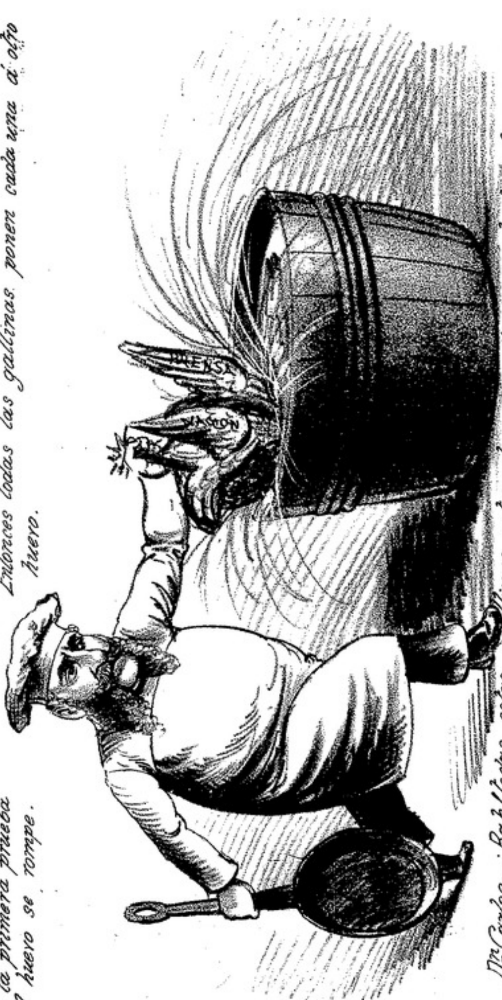
Dr. Carías - ¡Bah! todas estas gallinas están ávencas, sera mejor echárselas al agua para que se refresquen un poco. Sáemas yo tengo mucho que hacer y me voy á las Carreras.