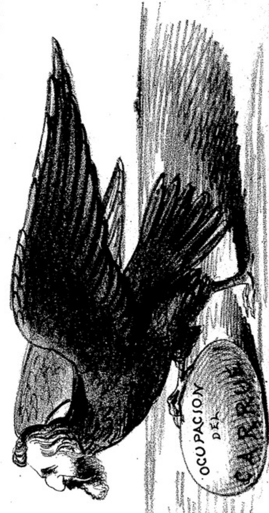
EL HUEYO DE LA ULTIMA HORA